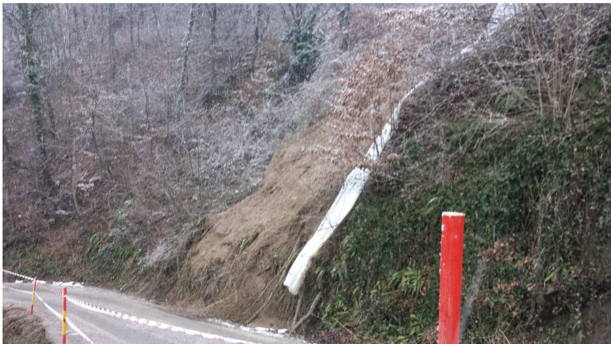
Slika 3 - plaz na LC 358041 - nad cesto