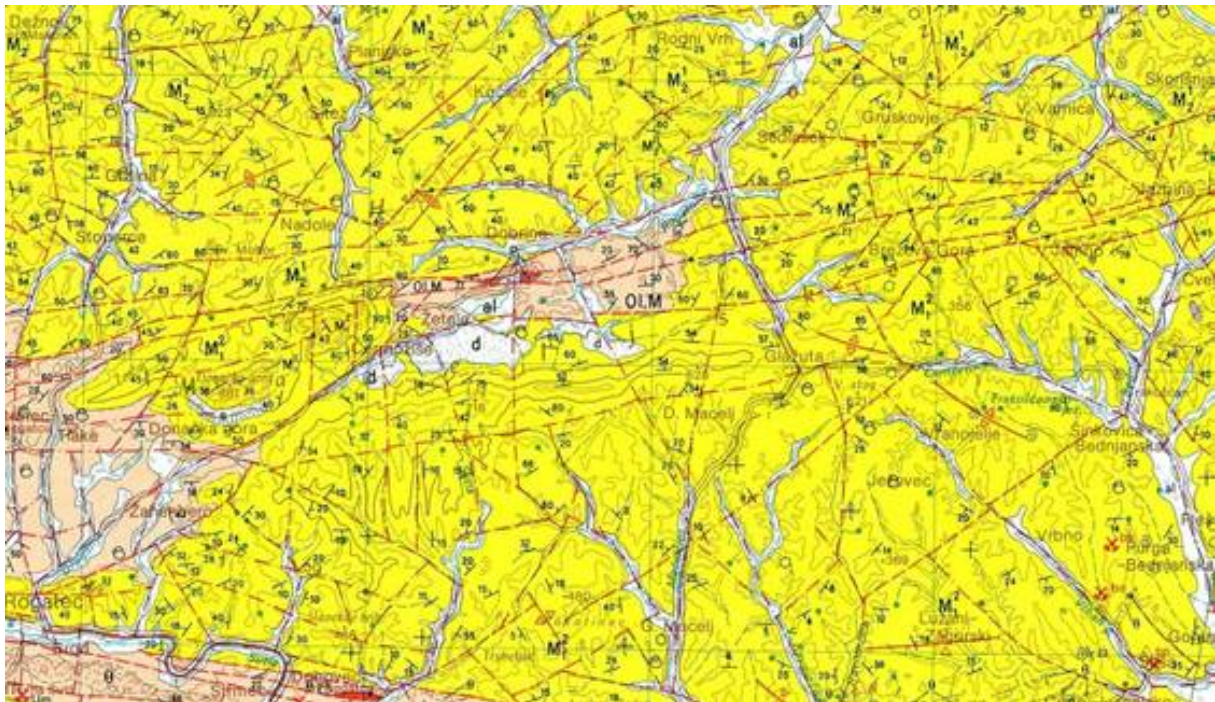
Slika 4 - izsek iz geološke karte

V hidrogeološkem smislu je mogoče obravnavati aluvijalne sedimentne kamnine (pesek, prod,...) kot dobro prepustne, glinice kot slabo prepustne, medtem, ko laporje, peščenjake, apnenice, dolomite,...kot praktično neprepustne ali zelo omejeno prepustne kamnine.