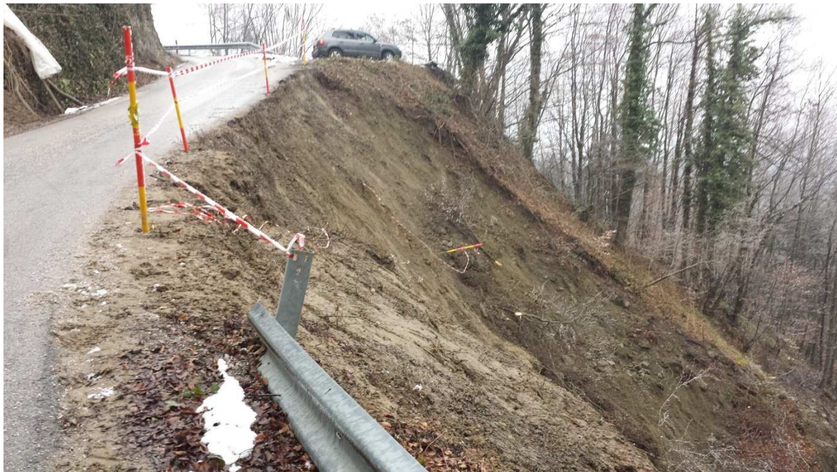
Slika 2 - plaz na LC 358041 – pod cesto

Plaz se je prvotno sprožil nad LC, kjer je gmota materiala zdrsela na cesto. Dodatna obtežba na cesti je povročila preobremenitev v spodnjih slojih, ki je zaradi presežene strižne trdnosti popustila. Plaz se je utrgal v skupni dolžini 26 m, cesta in cestna infrastruktura je poškodovana v skupni dolžini 35 m.