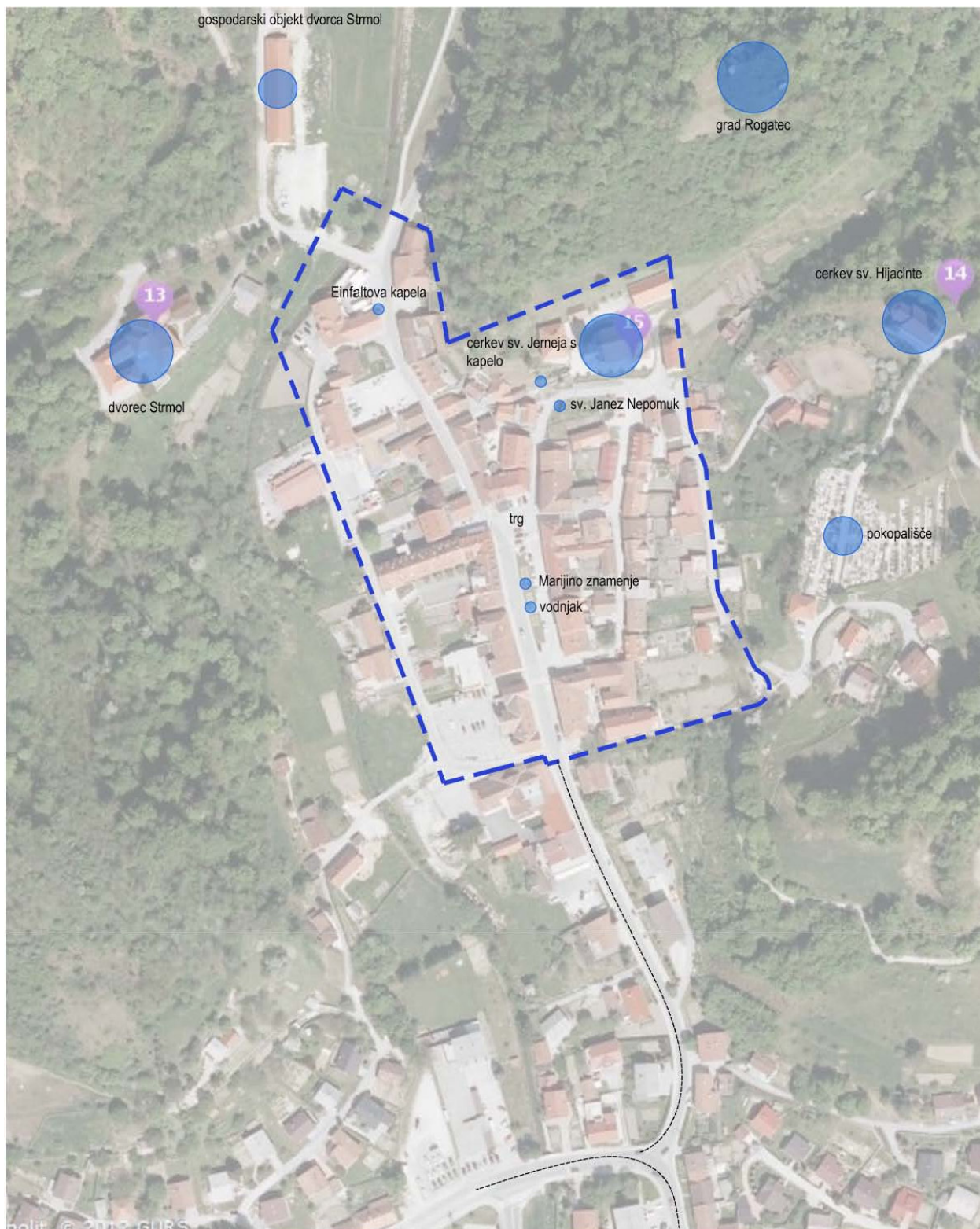
Slika 2 Prikaz območja obravnave s prikazom objektov krajevne kulturne in sakralne dediščine