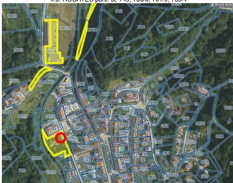
k.o. ROGATEC parc. št. 749, 733/3, 761/9, 759/4