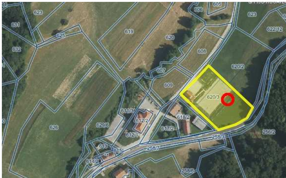
k.o. DONAČKA GORA parc. št. 620/3