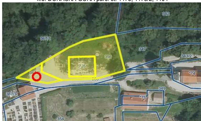
k.o. DOBOVEC parc. št. 356, 726, 367/2