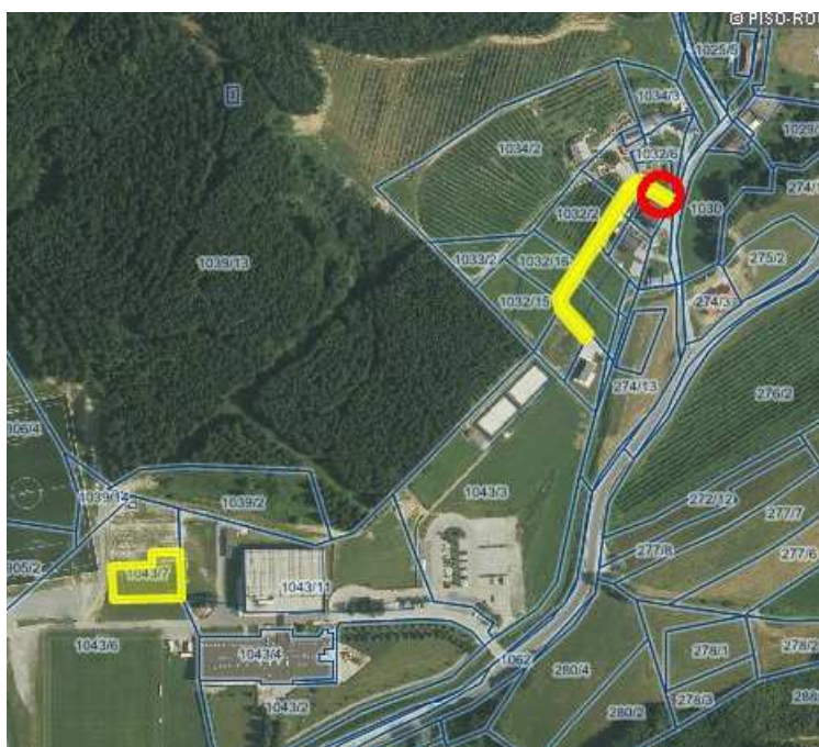
k.o. TLAKE parc. št. 1043/7, 1032/25, 1032/9