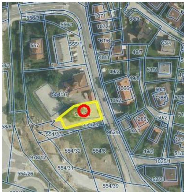
k.o. ROGATEC parc. št. 554/36