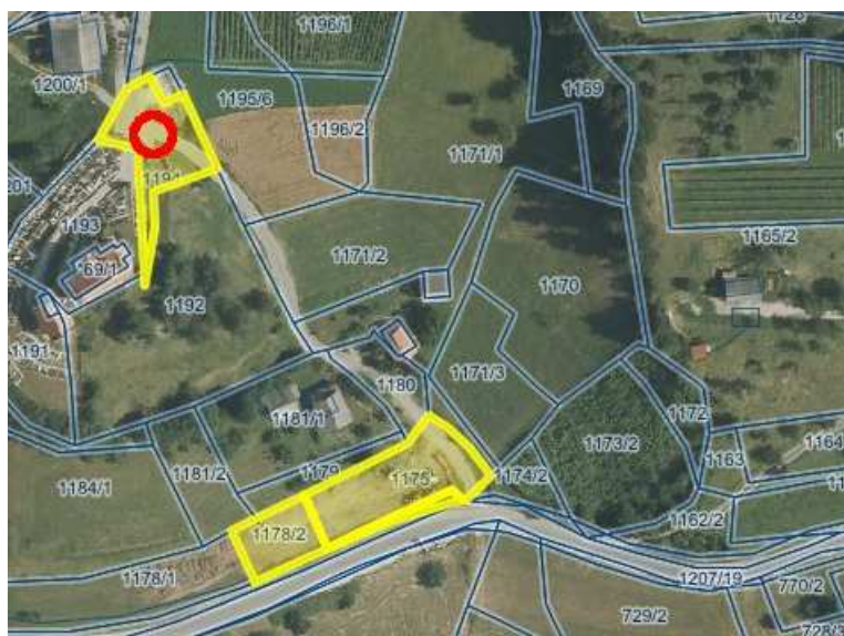
k.o. DONAČKA GORA parc. št. 1175, 1178/2, 1194