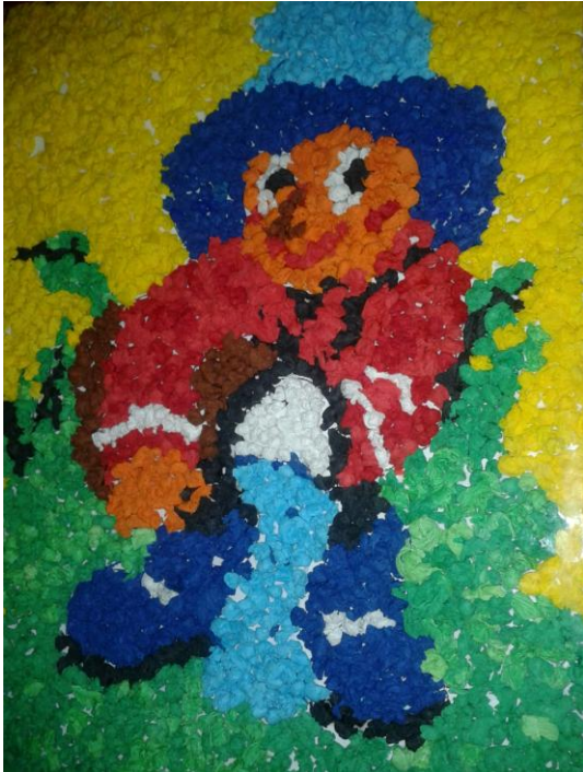
Nagrajeni izdelek: Škrat Vodko (1.- 4. razred OŠ Košana)

Podjetje Kovod Postojna, ki je v januarju po šolah in vrtcih v občini Postojna in Pivka izvajalo zanimive učne urice, katerih namen je bil otroke preko številnih zabavnih in poučnih aktivnosti seznaniti z nekaterimi ključnimi dejstvi o boljši skrbi za našo čisto pitno vodo, je izmed vseh prejetih izdelkov, ki so jih malčki in učenci skrbno izdelali v ta namen, izbralo najbolj izviren in privlačen izdelek. Obljubljeni nagrado – zabaven izlet so si s podobo škratka Vodka iz krep papirja prislužili učenci nižje stopnje iz osnovne šole Košana, ki bodo v februarju deležni ledene zabave na drsališču v Postojni ter prijetnega druženja ob pogostitvi.