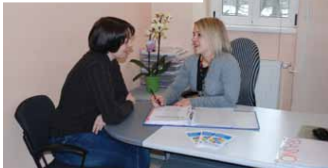
Postopek vrednotenja znanja na LU Postojna.

Strokovni delavci za vrednotenje v izobraževalnih organizacijah, kjer izvajajo aktivnosti za vrednotenje neformalno pridobljenega znanja, vam lahko brezplačno pomagajo pri vrednotenju predhodno pridobljenega znanja in izkušenj ter pri načrtovanju vaše izobraževalne ali poklicne poti.