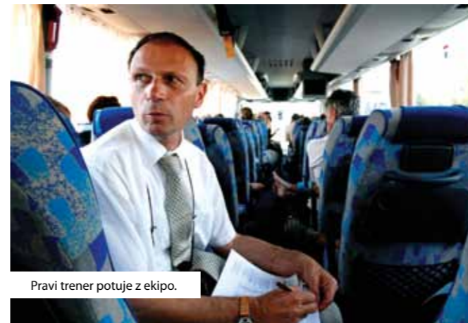
Pravi trener potuje z ekipo.