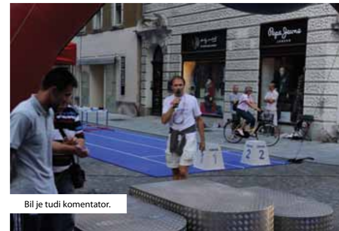
Bil je tudi komentator.

predavanji, postal pa je tudi komentator na atletskih tekmovanjih. Zaradi njegove visoke strokovne usposobljenosti so ga številni klubi vabili za komentatorja državnih prvenstev. Tako je veliko tekem komentiral doma in tudi drugod, vse pa še pred 30. letom starosti.