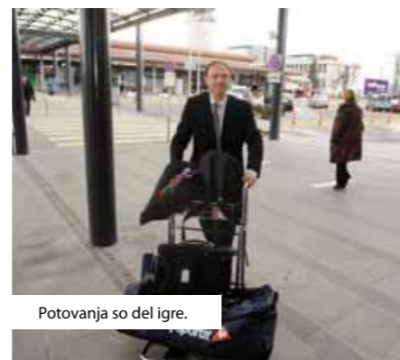
Potovanja so del igre.