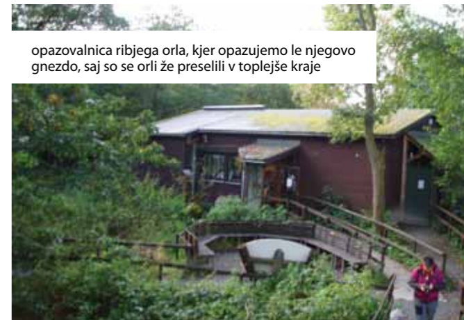
opazovalnica ribjega orla, kjer opazujemo le njegovo gnezdo, saj so se orli že preselili v toplejše kraje

membno vlogo, saj je vanj vključenih približno 200 prostovoljcev, ki opravljajo različna dela. Vsem nam je bilo zanimivo, da jim uspe v ta center (predvsem zaradi ribjega orla) letno privabiti približno 25.000 obiskovalcev ter narediti takšno turistično atrakcijo. Takoj smo imeli v mislih veliko pestrost rastlinskih in živalskih vrst v Sloveniji, pogojeno s pestrostjo samega okolja, od reliefa, klime, geologije ... in za zdaj slabo trženje naravnih danosti. Možnosti pa imamo vsekakor zelo dobre.