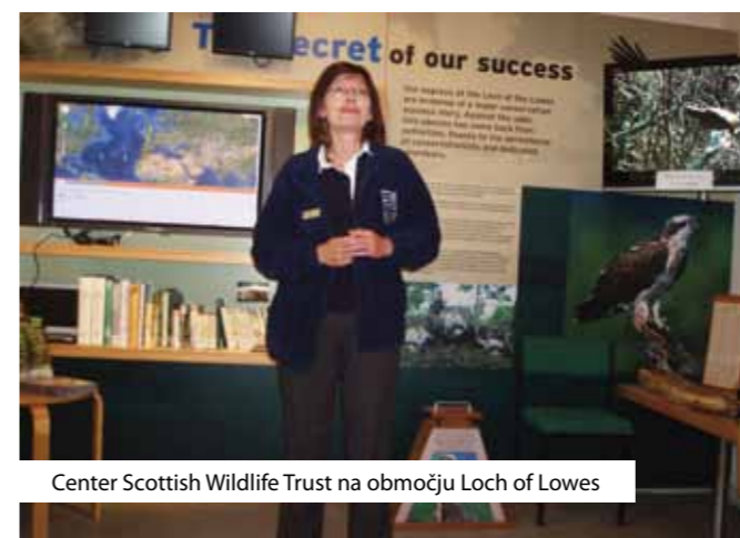
Center Scottish Wildlife Trust na območju Loch of Lowes

V Dunkeldu smo obiskali naravni rezervat Loch of Lowes, ki je znan po gnezdišču ptice, imenovane the Osprey ali ribji orol, ki spada med ogrožene vrste ujed. Upravlja ga Scottish Wildlife Trust, organizacija, ki združuje več kot 30.000 članov po celotni Škotski. Članstvo je osnovano na dobrodelnosti, tako v smislu različnih oblik prostovoljnega dela kot tudi denarnih dotacij. Financirajo se tako s pomočjo članarine, donacij ter finančnih podpor partnerskih organizacij. Njihov namen delovanja je zaščititi naravo ter jo ohraniti tudi za naslednje rodove. S tem namenom prirejajo različne in zelo številne aktivnosti čez vse leto, ki po starosti privabljajo vse skupine obiskovalcev. Izmed vseh aktivnosti je v tem naravnem rezervatu najbolj popularno opazovanje ribjega orla ter čuvanje njegovega gnezda, ki poteka na prostovoljni bazi 24 ur dnevno v pomladansko/poletnem času gnezdenja orla. Prav prostovoljstvo ima tu po-