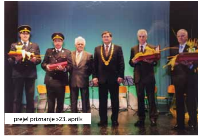
prejel priznanje »23. april«

ji, saj se mu pravzaprav v prostorih Karitasa dnevno razkrivajo skozi hudo revščino vse številnejših družin in posameznikov. Sam opravi mesečno vsaj 130 prostovoljnih ur, ker je tudi svetovalec, pa njegovo srce parajo stiske mnogih someščanov. Ko pomisli nanje, se njegove oči v najinem pogovoru prvič zarosijo. »Ti ljudje so globoko prizadeti, lahko bi rekli ranjeni. Do njih je treba biti skrajno spoštljiv in razumeti njihovo stisko, kar vsi naši prostovoljci Karitasa še kako dobro vedo. Še dobro, da je med nami veliko solidarnih ljudi, dobrotnikov, ki priskočijo na pomoč z donacijami ali uslugami. Tem se tudi na tem mestu iskreno zahvaljujem! Posebej se moram zahvaliti Občini Postojna za prostore, ki nam jih je omogočila letos za naše delovanje, še posebej zato, ker so ti v središču mesta. Pa postojnskemu županu, ki se je za to posebej zavzemal.«