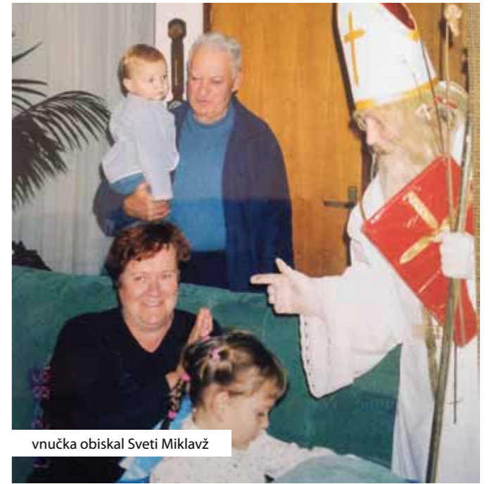
vnučka obiskal Sveti Miklavž