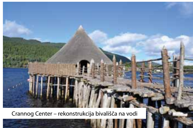
Crannog Center – rekonstrukcija bivališča na vodi

Kot primer dobre prakse naj omenim t. i. »Crannog Center«, kjer smo si ogledali rekonstrukcijo železnodobnega bivališča na vodi ter razstavo eksponatov (starih približno 2.500 let), ki so jih odkrili arheologi s podvodnim raziskovanjem. Stavbo so na vodi v stilu koliščarjev gradili kar tri leta. Ker sredstev na razpolago ni bilo, so jo zgradili prostovoljno v lastni režiiji. Sama vodička nam je lastnoročno prikazala tudi nekatere večine, ki so jih obvladali tedanji prebivalci: od netenja ognja, klesanja in vrtnanja kamna do trenja žit ... Zelo nam je bil všeč »živ način« predstavitev tamkajšnjega življenja. Financirajo se pretežno z donacijami, nekaj pa tudi s prodajo vstopnic, spominkov in kave. Od njih smo se na žalost poslovili z grenkim priokusom, saj smo se spraševali, le koliko časa bodo obiskovalci imeli še možnost obiska centra, saj so nas seznanili tudi s težavami. V neposredni bližini se bo namreč gradila marina ter hotelski kompleks. Z gradnjo marine bo potrebno poglobljati dno jeze-