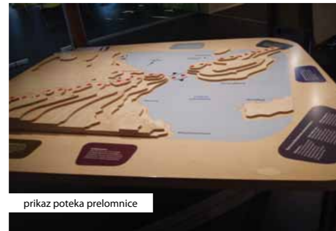
prikaz poteka prelomnice

Strateški cilji parka so varovanje narave (tako žive kot nežive), doživetje obiskovalcev (park je prostor doživetij) in trajnostni razvoj podeželja. Čez park vodi tudi več kot 160 km dolga t. i. »West Highland Long Distance Route«, ki jo letno v celoti prehodi okrog 30.000 pohodnikov. V parku smo si ogledali tudi Salloch, kjer so uredili prostor, namenjen kampiranju. Do takrat je bil tam problem z nelegalnim kampiranjem, območje je bilo umazano s človeškimi iztrebki in odpadno embalažo. Sedaj so ta problem na »mehek način« rešili.