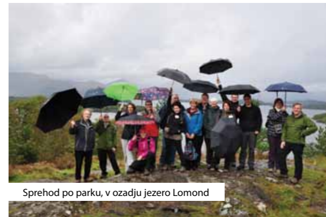
Sprehod po parku, v ozadju jezero Lomond

V Dunkeldu smo obiskali naravni rezervat Loch of Lowes, ki je znan po gnezdišču ptice, imenovane the Osprey ali ribji orol, ki spada med ogrožene vrste ujed. Upravlja ga Scottish Wildlife Trust, organizacija, ki združuje več kot 30.000 članov po celotni Škotski. Članstvo je osnovano na dobrodelnosti, tako v smislu različnih oblik prostovoljnega dela kot tudi denarnih dotacij. Financirajo se tako s pomočjo članarine, donacij ter finančnih podpor partnerskih organizacij. Njihov namen delovanja je zaščititi naravo ter jo ohraniti tudi za naslednje rodove. S tem namenom prirejajo različne in zelo številne aktivnosti čez vse leto, ki po starosti privabljajo vse skupine obiskovalcev. Izmed vseh aktivnosti je v tem naravnem rezervatu najbolj popularno opazovanje ribjega orla ter čuvanje njegovega gnezda, ki poteka na prostovoljni bazi 24 ur dnevno v pomladansko/poletnem času gnezdenja orla. Prav prostovoljstvo ima tu po-