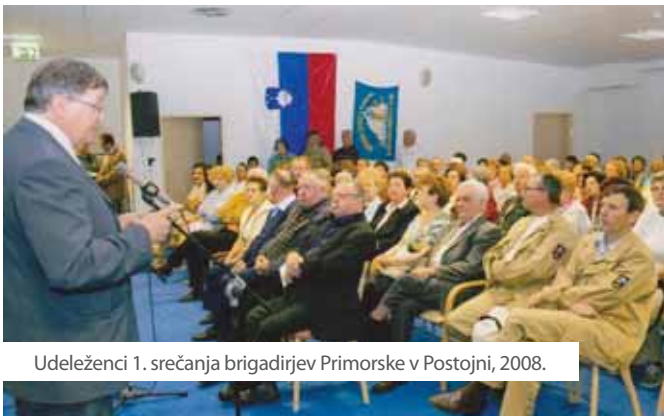
Udeleženci 1. srečanja brigadirjev Primorske v Postojni, 2008.