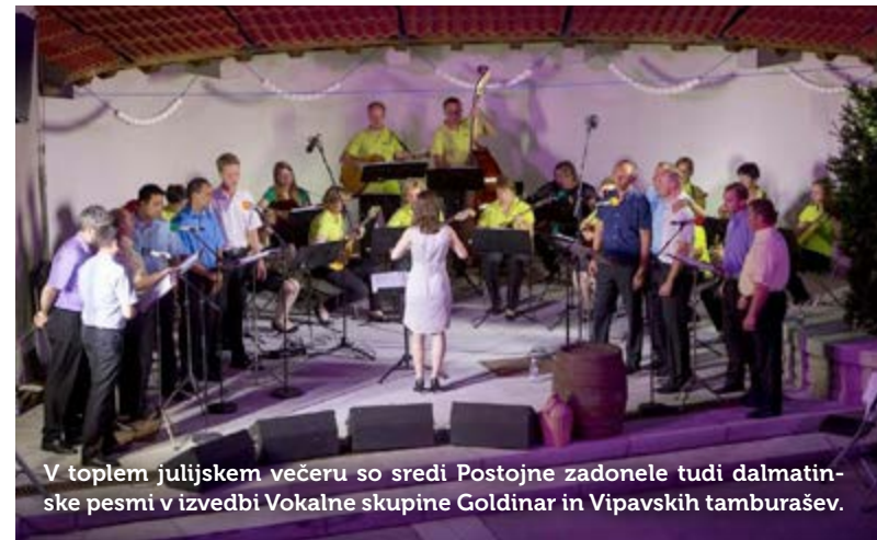
V toplém julijskem večeru so sredi Postojne zadonele tudi dalmatinske pesmi v izvedbi Vokalne skupine Goldinar in Vipavskih tamburašev.