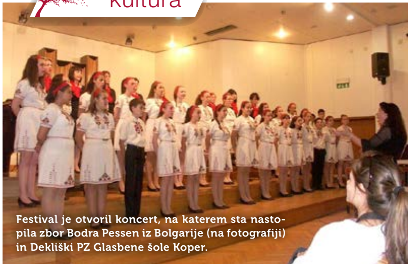
Festival je otvoril koncert, na katerem sta nastopila zbor Bodra Pessen iz Bolgarije (na fotografiji) in Dekliški PZ Glasbene šole Koper.