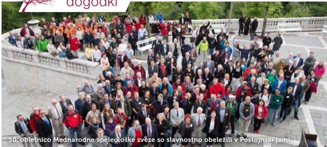
50. obletnico Mednarodne speleološke zveze so slavnostno obeležili v Postojnski jami.