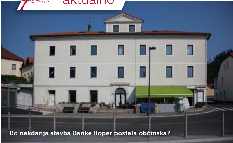
Bo nekdanja stavba Banke Koper postala občinska?