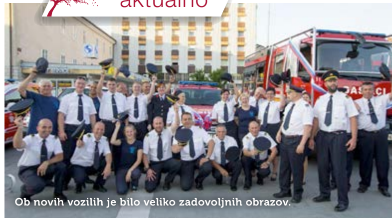
Ob novih vozilih je bilo veliko zadovoljnih obrazov.

Besedilo: Alenka Furlan Čadež