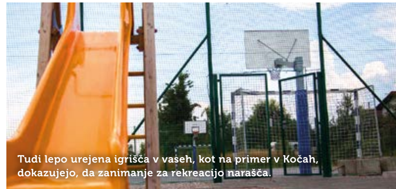
Tudi lepo urejena igrišča v vaseh, kot na primer v Kočah, dokazujejo, da zanimanje za rekreacijo narašča.