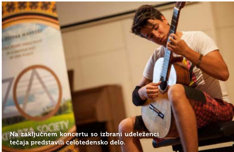
Na zaključnem koncertu so izbrani udeleženci tečaja predstavili celotedsko delo.