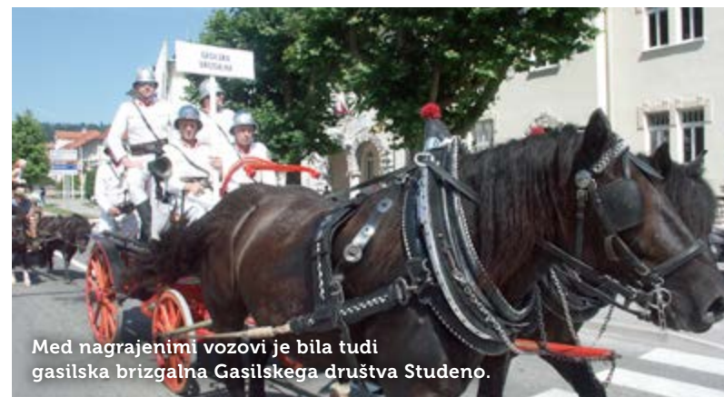
Med nagrajenimi vozovi je bila tudi gasilska brizgalna Gasilskega društva Studeno.

Bogato dediščino tovorniških in prevoznih dejavnosti v Postojni tradicionalno obeležujemo s praznikom, ki je prerasel v vseslovensko etnološko prireditev. 5. julija je Turistično društvo Postojna v sodelovanju z Občino Postojna in Postojnsko jamo, d. d. vnovič pripravilo obsežen program, ki je ponujal obilo dogajanja čez cel dan in kljub peklenskim temperaturam tudi letos privabil prek deset tisoč obiskovalcev od blizu in daleč. Dopoldne so bila na ogled orodja in prikazane obrti furmanskih dejavnosti, nekaj društev se je pomerilo v pripravi najboljšega furmanskega golaža, harmonikarji pa so se na diatonič-