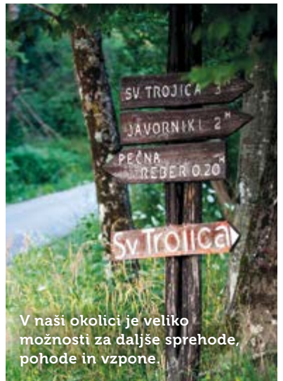
V naši okolici je veliko možnosti za daljše sprehode, pohode in vzpone.