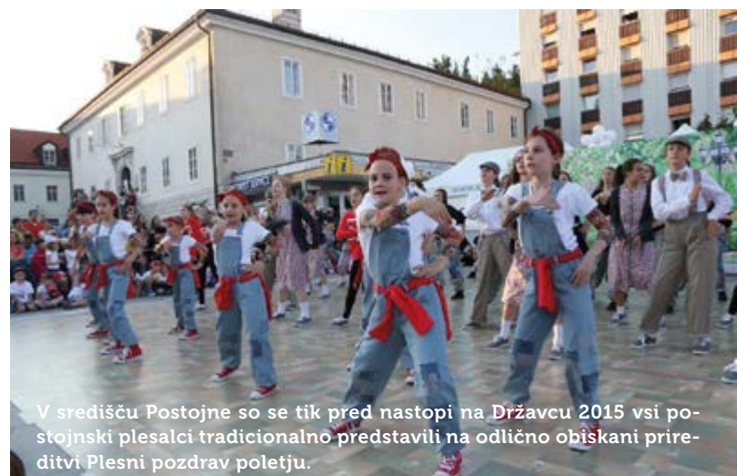
V središču Postojne so se tik pred nastopi na Državcu 2015 vsi postojnski plesalci tradicionalno predstavili na odlično obiskani priveditvi Plesni pozdrav poletju.

Besedilo: Ester Fidel