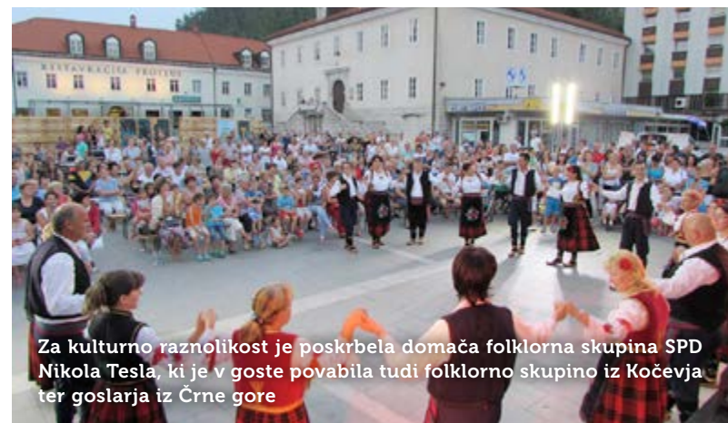
Za kulturno raznolikost je poskrbel domača folklorna skupina SPD Nikola Tesla, ki je v goste povabila tudi folklorno skupino iz Kočevja ter goslarja iz Črne gore

spodbujati domače skupine in izvajalce k resnemu delu in s tem ohranjati slovenski jezik, kulturo, identiteto naroda in slovenske običaje. Seveda povabimo k sodelovanju tudi goste iz drugih občin in skupine iz tujine, ki gojijo svojo kulturo. Koncept festivala zaokrožujejo večeri narodnozabavne glasbe, zborovske glasbe, pop glasbe, dixiland, rock