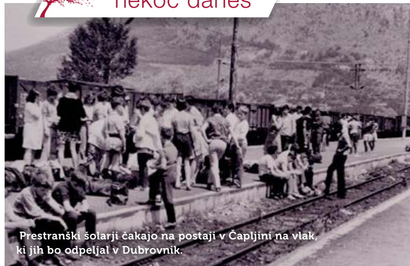
Prestranški šolarji čakajo na postaji v Čapljini na vlak, ki jih bo odpeljal v Dubrovnik.

Besedilo: Mateja Jordan; fotografija: arhiv Soulfesta.