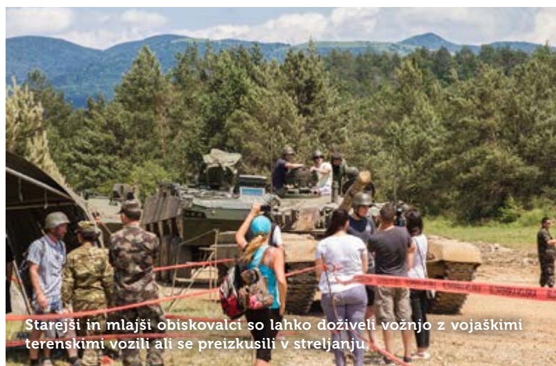
Starejši in mlajši obiskovalci so lahko doživeli vožnjo z vojaškimi terenskimi vozili ali se preizkusili v streljanju.

Besedilo: Polona Škodič; fotografija: Foto Atelje Postojna.