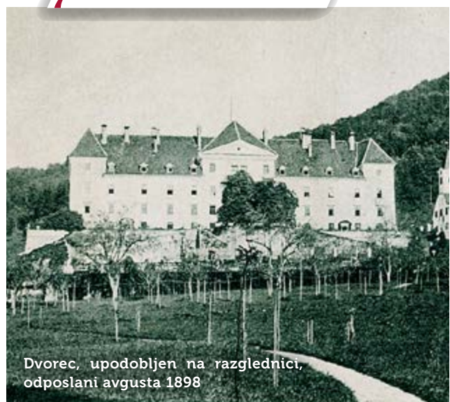
Dvorec, upodobljen na razglednici, odposlani avgusta 1898

Besedilo: Alenka Čuk; fotografiji: arhiv Osnovne šole Prestranek in zasebna zbirka.