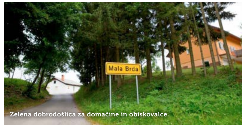
Zelena dobrodošlica za domačine in obiskovalce.

Besedilo: Gabriela Brovč; fotografije: Foto Atelje Postojna.