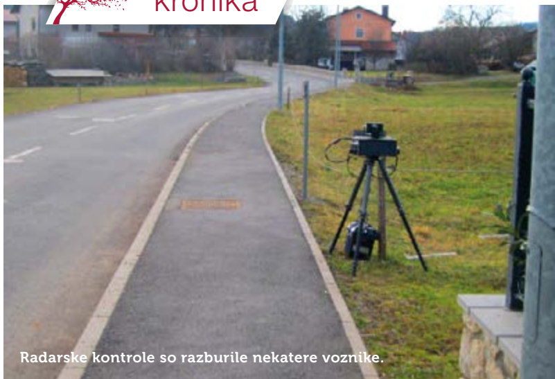
Radarske kontrole so razburile nekatere voznike.