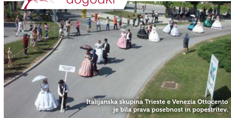
Italijanska skupina Trieste e Venezia Ottocento je bila prava posebnost in popestritev.