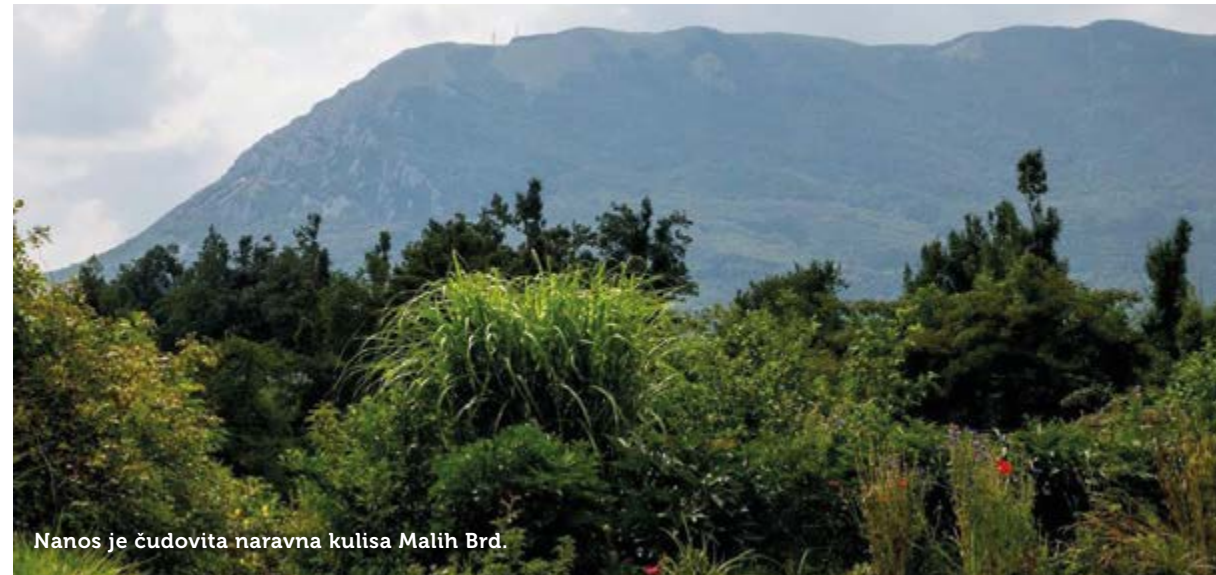
Nanos je čudovita naravna kulisa Malih Brd.

nilo, da pomeni brdo nižji, položen in razpotegnjen hrib, navadno višavje ob vznožju gora. Brdo je bodisi gola, travnata površina, redko porasla z grmovjem in s posameznimi drevesi, bodisi površina z obdelano zemljo in vinogradi. »Bo že držalo, le zadnja trditev na žalost ne drži.« Omenila sem mu še navedbo iz knjige Postojna upravno in gospodarsko središče, iz katere izhaja, da je v listini iz leta 1300 najden zapis »in villa de Werdi prope Arisperch«, nato v letu 1499 Klain Berdlein, 1822 Kleinber-