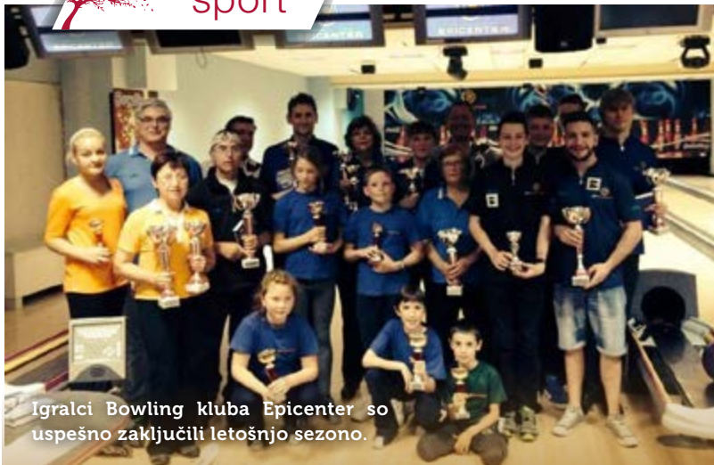
Igralci Bowling kluba Epicenter so uspešno zaključili letošnjo sezono.