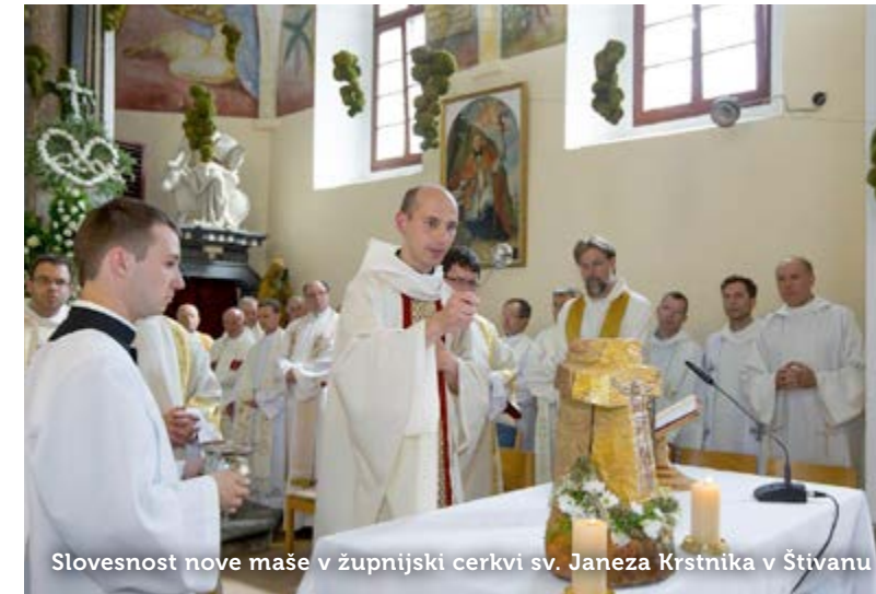
Slovesnost nove maše v župnijski cerkvi sv. Janeza Krstnika v Štivanu

Besedilo: Tjaša Blaško; fotografija: Srečko Šajn.