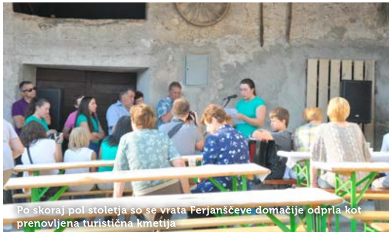
Po skoraj pol stoletja so se vrata Ferjanščeve domačije odprla kot prenovljena turistična kmetija