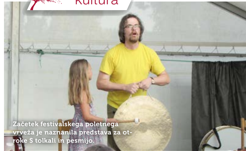
Začetek festivalskega poletnega vrveža je naznanila predstava za otroke S talkali in pesmijo.