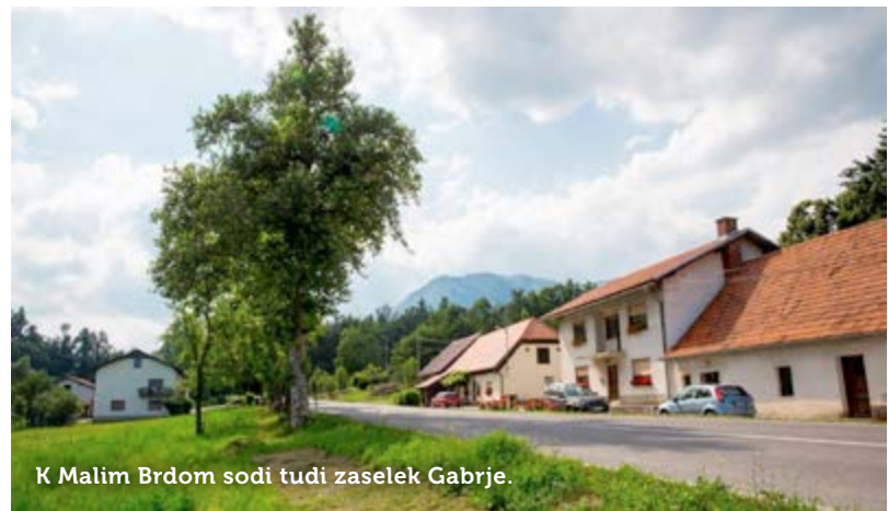
K Malim Brdom sodi tudi zaselek Gabrje.