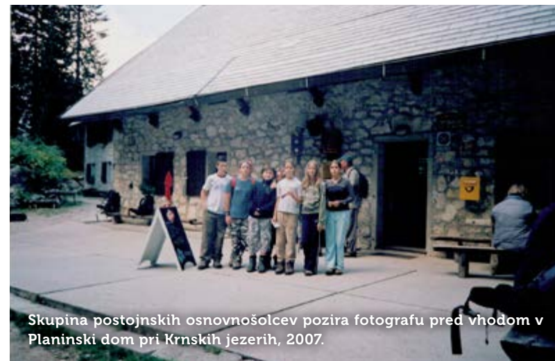
Skupina postojnskih osnovnošolcev pozira fotografu pred vhomom v Planinski dom pri Krnskih jezerih, 2007.

Sprva so se šolarji (ta navada ni »stara« toliko kot šola, saj izletov, tudi skromnih, denimo pred dvesto leti niso poznali) odpravili peš v bližnjo okolico šole; potem so si počasi širili obzorja, se namenili do bolj znanega kraja v sosesčini, še vedno peš, lahko tudi z lojtrnim vozom. Ko so na izlet lahko odšli z vlakom, je to pomenilo, da se bodo podali nekam dlje. To je bilo posebno doživetje, saj se je prenekateri otrok