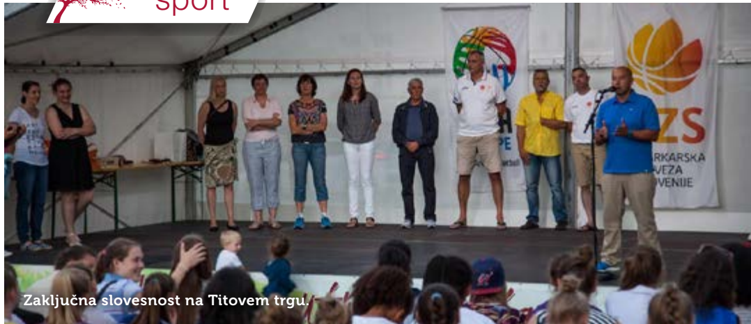
Zaključna slovesnost na Titovem trgu.