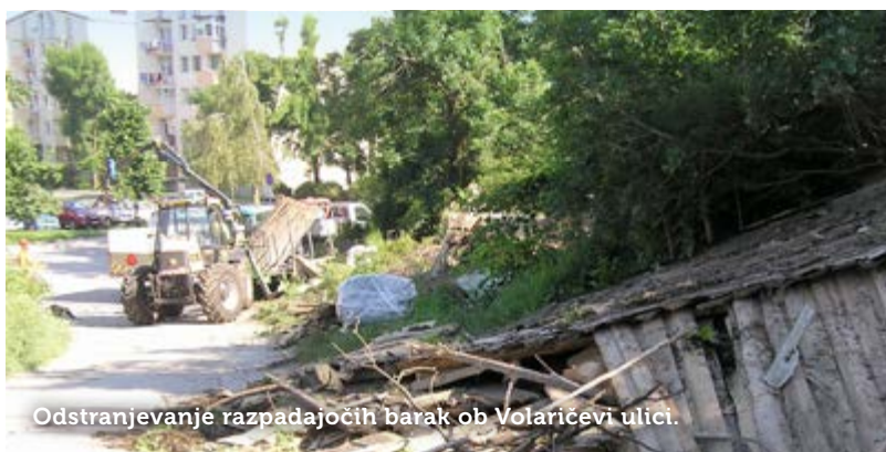
Odstranjevanje razpadajočih barak ob Volaričevi ulici.

Besedilo: Tjaša Blaško.