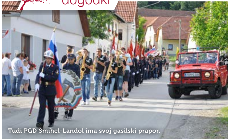
Tudi PGD Šmihel-Landol ima svoj gasilski prapor.