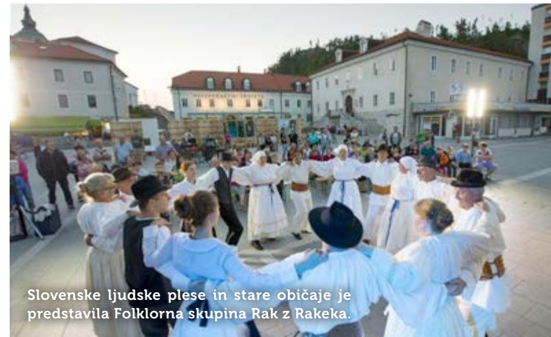
Slovenske ljudske plesne in stare običaje je predstavila Folklorna skupina Rak z Rakeka.