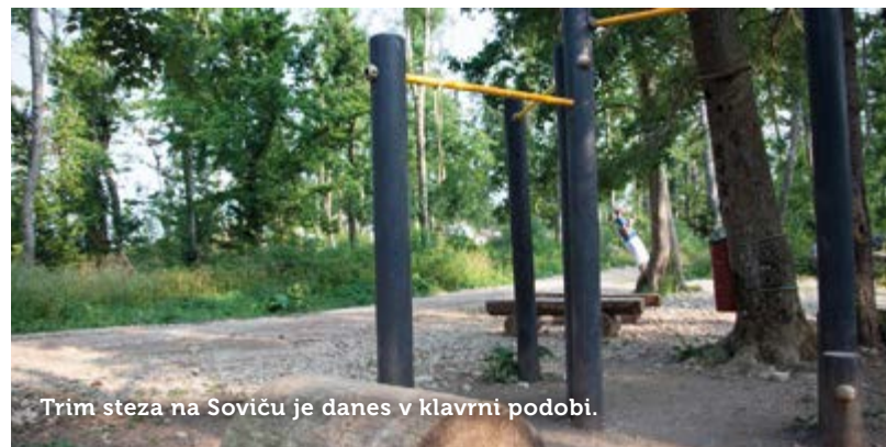
Trim steza na Soviču je danes v klavni podobi.

nasutje drobnega peska ter postavitve klopi ob poti. Za nadaljnje posege zaenkrat ni časovnih obljub, saj bodo premiki odvisni od financ, zunanjih virov in prostovoljstva. »Predvideti je treba celovit program za ves Sovič, tudi v povezavi s športnim stadio-