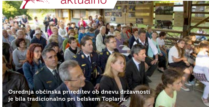
Osrednja občinska prireditev ob dnevu državnosti je bila tradicionalno pri belskem Toplarju.