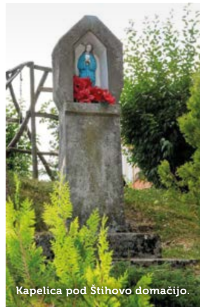
Kapelica pod Štihovo domačijo.

»Miro, zakaj se vaša vas imenuje Mala Brda, zakaj se ne imenuje Mali Hrib?« sem ga vprašala hudomušno. Pogledal me je malce postrani in skomignil z rameni. Povedala sem mu, da sem pobrskala po različnih zapisih in našla poja-