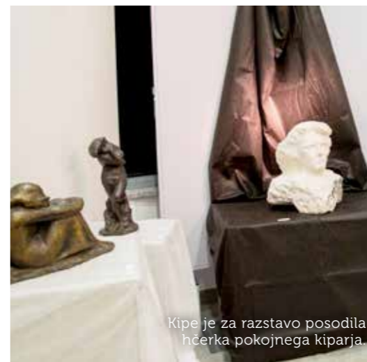
Kipejeje za razstavo posodila hčerka pokojnega kiparja.

Besedilo: Mateja Jordan; fotografija: Valter Leban.