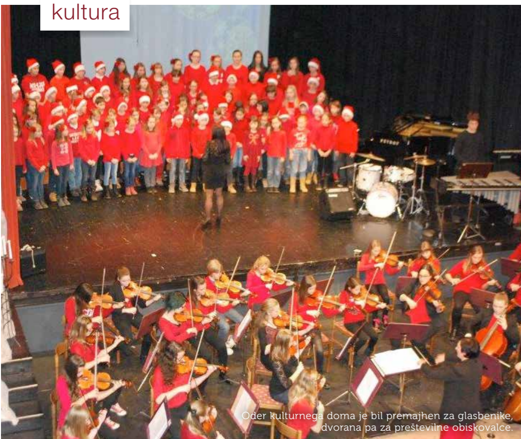
Oder kulturnega doma je bil premajhen za glasbenike, dvorana pa za prešteviline obiskovalce.