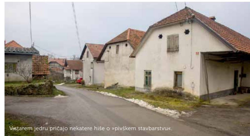
V starem jedru pričajo nekatere hiše o »pivškem stavbarstvu«.

prireditvah, igrali so igre, zapeli pod vaško lipo, hodili v Studeno, Predjamo in predvsem k Spodnjemu Bolku na veselice in si tudi medsebojno pomagali pri kmečkih opravilih. Pri Lubarjevi cerkev sv. Martina Pri Fari vključena v turistično ponudbo postojnskega območja.