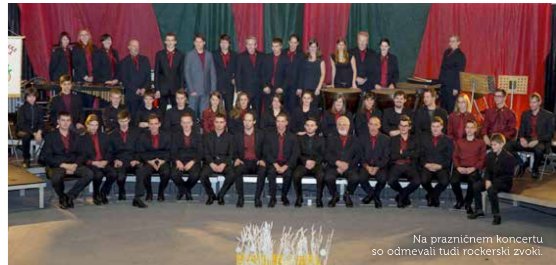
Na prazničnem koncertu so odmevali tudi rockerski zvoki.