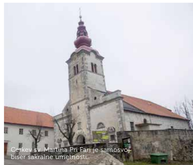
Cerkev sv. Martina Pri Fari je samosvoji biser sakralne umetnosti.

Ob cerkvi sv. Martina je mogočen »farovž« in ob njem veliki hlevi. Pri Fari