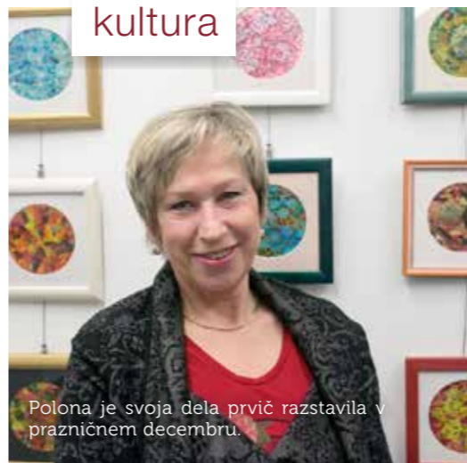
Polona je svoja dela prvič razstavlila v prazničnem decembru.

Besedilo: Polona Škodič, Alenka Čuk; fotografije: Foto Atelje Postojna, Maja Batagelj, Franc Tominc.