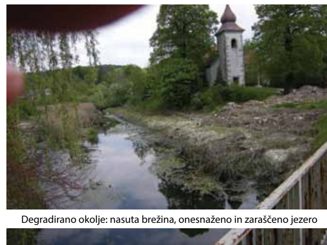
Degradirano okolje: nasuta brežina, onesnaženo in zaraščeno jezero

sistem«. Glede zasipanja brežin pa: »Prav tako se z ARSO dogovarjamo tudi o ureditvi brežin potoka Stržen ...«