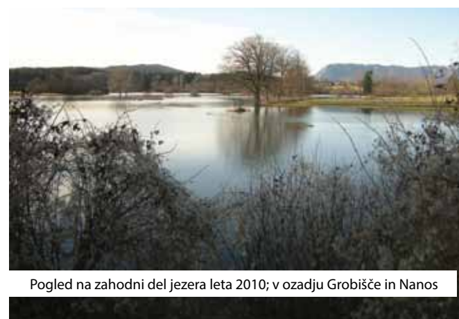
Pogled na zahodni del jezera leta 2010; v ozadju Grobišče in Nanos