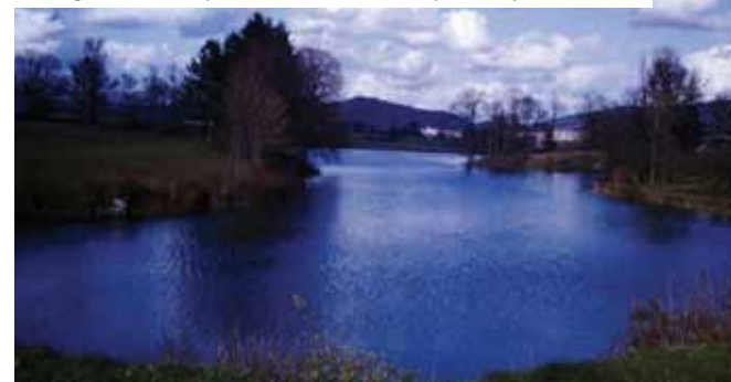
Pogled z vasi na jezero leta 1975; v ozadju Postojna in Sovič

Višji svetovalec za investicije U. Pinter je lani na vprašanje o zaraščanju in zasipanju brežin odpisal, da je »dobro, da je potok Stržen čim bolj zaraščen in da teče čim bolj počasi, saj tako rastline in dobre bakterije v vodi porabijo hranila v vodi, še preden ta pride do reke«. Na ta način naj bi se manj hranil preneslo v Pivko in »v jamski