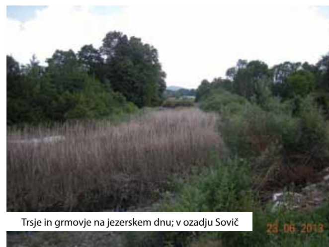
Trsje in grmovje na jezerskem dnu; v ozadju Sovič