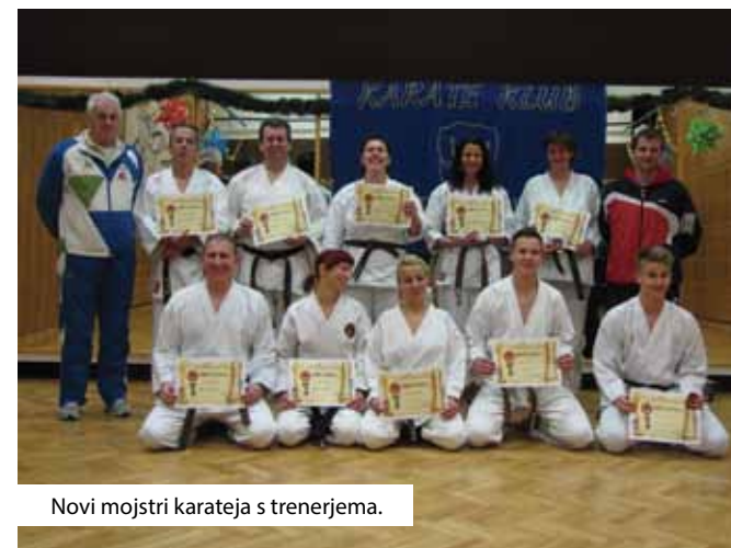
Novi mojstri karateja s trenerjema.