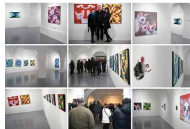
Ljubljana, Galerija Eqrna