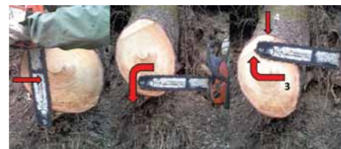
Postopek prežaganja debelejšega drevesa, ki je izruvano na ravnini ali po strmini navzgor.

Pri debelejšem drevju pa bo postopek podoben, le da moramo najprej stanjšati premer debela, nadaljujemo z vbodnim rezom in režemo po pravilu najprej stisnjena vlakna, na koncu napeta vlakna. Zadnji rez naj bo, če je le možno, opravljen čim dlje od debela, zato nam bo prav prišla daljša letva na motorni žagi.