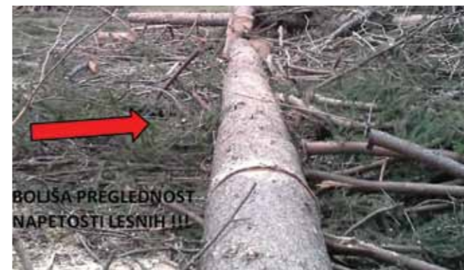
Kleščanje in odstranjevanje vej zaradi boljšega pregleda.

Začel bi s primerom, ko nam izruvano drevo leži na ravnini ali po strmini navzgor. Pri takem drevesu si najprej v predelu panja označimo mesto, kjer bomo drevo prežagali, nato pričnemo s kleščanjem in odstranjevanjem vej, med tem delom si označujemo (krojimo) deblo na mestih, kjer ga bomo prežagali in s tem dobili gozdne lesne sortimente za prodajo. Pri delu v strmini je smiselno, če je le možno, pričeti s kleščanjem vej od vrha drevesa proti panju, saj je s tem delo lažje in tudi bolj varno. Ko je to opravilo končano, še enkrat preglejmo celotno drevo, saj bomo zaradi odstranjenih vej lažje presodili, kakšne so napetosti v njem, ter pričnemo s prežaganjem od vrha proti panju na mestih, ki smo jih označili, saj bomo tako dodatno zmanjšali napetosti v drevesu.