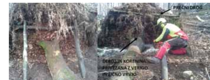
Varovanje sekača pred prevalom korenine s pomočjo rogovil in s pomočjo traktorskega vitla.

Ko je korenina zavarovana, pričnemo s prežaganjem debela. Prežagujemo ga lahko na načine, ki sem jih opisal pri prejšnjem primeru, za še večjo varnost pa lahko uporabimo stopničasti rez. Ker korenina pritiska proti debelu, so stisnjena lesna vlakna na vrhu, prvi rez naredimo z vrha, drugi rez pa je s spodnje strani in nekaj centimetrov odmaknjen proti korenini, kar nas bo obvarovalo pred stiskanjem letve na motorni žagi. Če delamo na zelo strmih terenu pa prežaganja ne zaključimo, ampak pustimo tanek neprežagani predel. Tako pripravljeno deblo bo traktorist sprostil z varne razdalje s pomočjo vitla.