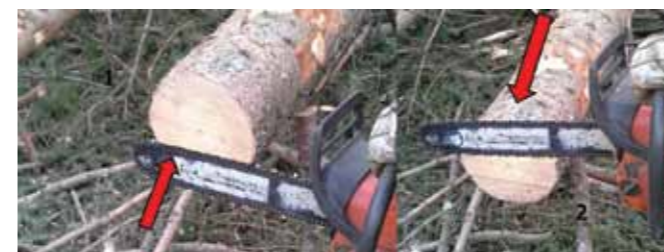
Prežaganje tanjšega drevesa s kombinacijo hrbtnega in trebušnega vzdolžnega reza glede na napetost lesnih vlaken.

Če želimo delo končati, je potrebno prežagati deblo še v predelu panja, kjer smo drevo najprej označili. Pozorni moramo biti na korenino, ki se bo po prežaganju zvrnila v dno, ki nam pove, da so stisnjena lesna vlakna v spodnjem delu, napeta lesna vlakna pa na zgornjem delu debela. Tako bomo pri tanjšem drevju najprej pričeli s prežaganjem v predelu stisnjenih vlaken in zaključili s prežaganjem v predelu napetih vlaken.