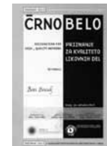
»SREČANJA 2013« Priznanje za kvaliteto likovnih del

Sodelovala je tudi na likovnem festivalu »Srečanja 2013«, na razstavi v Galeriji mestne občine Kranj »Geometrija na Slovenskem – ČRNO in BELO«, kjer je prejela priznanje za kvaliteto likovnih del.