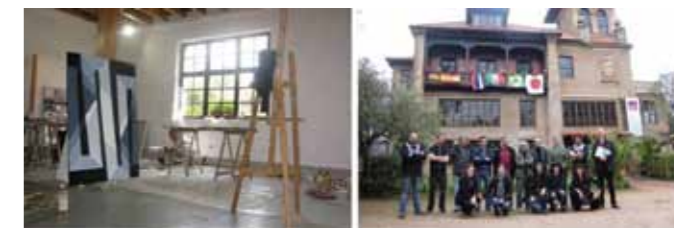
Španija – Noja, »XIII. Simposio Internacional de Artistas en Noja SIANOJA 2013«

Art Creation – Camp 2013 (Art circle – CHINA – Kabaj)«. Tudi začetek poletja je bil nadvse aktiven. Povabili so jo na simpozij v Španijo (Noja, »XIII. Simposio Internacional de Artistas en Noja SIANOJA 2013«). Julija je sledilo sodelovanje na 16. mednarodni koloniji Festivala Ljubljana.