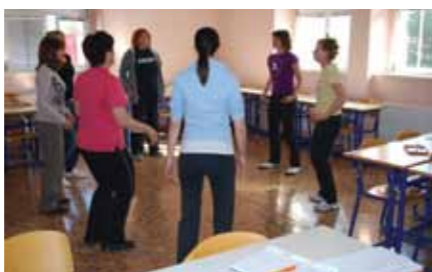
Iz delavnic Borze Znanja Postojna

V preteklem letu je Borza znanja Postojna vpisala 77 novih članov in pripravila številne delavnice z raznoliko vsebino: udeleženci so se učili osnov slikanja na svilo, oblikovali so spomladansko okrasje, izdelovali božično-novoletne voščilnice in okraske, se seznanili z zvijačami ličenja, se poglobljali v svoje notranje svetove, se učili tehnik sproščanja ... Tekoče informacije