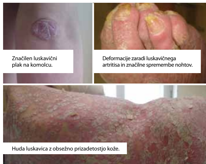
Značilen luskavični plak na komolcu.