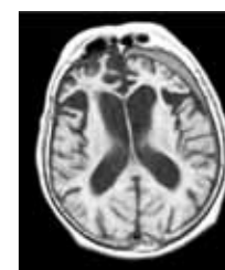
Slika desno: Možgani bolnika z demenco.