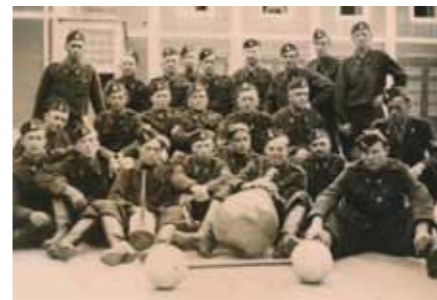
Slavenski gasilci v 87. formaciji gasilskega korpusa

V svoji zgodovini so slavenski gasilci uporabljali različna vozila pri gašenju požarov. Sredi 80. let je bilo potrebno zaradi iztrošenosti prej omenjenega kombija kupiti novejšega, prav tako znamke IMV. V začetku 90. let je društvo postalo bogatejša za terensko vozilo znamke UAZ, z novim tisočletjem se je pripeljal tovornjak Zastava, leto 2008 pa je presenetilo z novim Mercedesom Atego GVC16/25. Zadnja pridobitev je iz leta 2011. Takrat