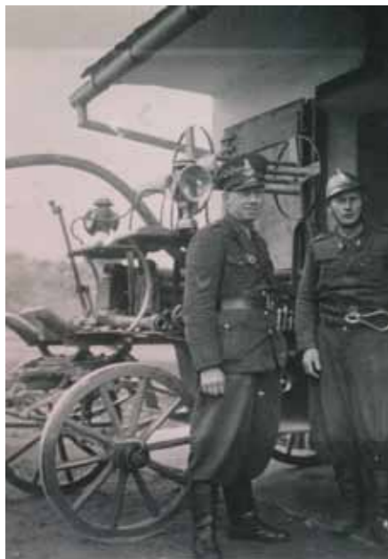
Prva gasilska črpalka v Slavini