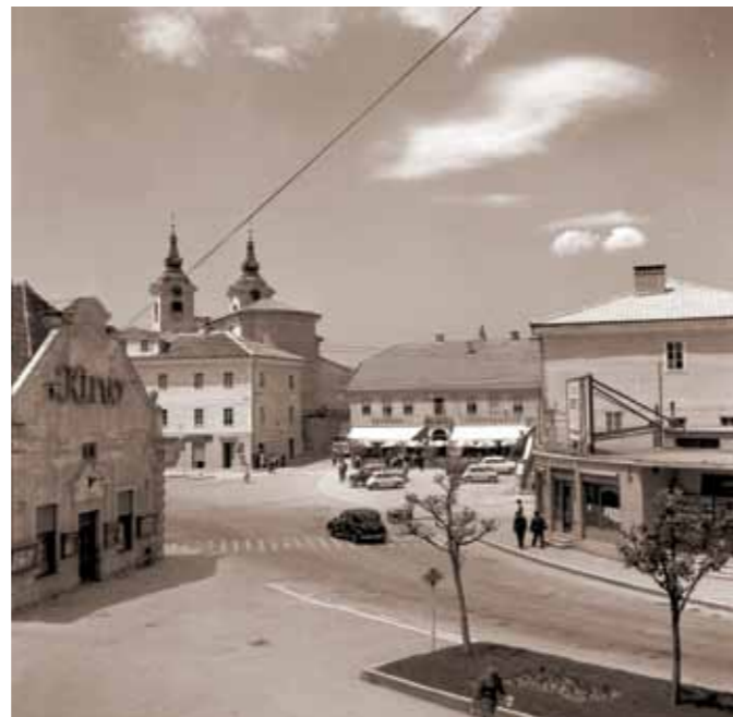
Pogled na središče Postojne okoli leta 1960.

Ohranjene podobe Postojne in drugih primorskih krajev, mest in pokrajine kažejo na Zirmannov nemirni, ustvarjalni