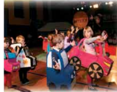
MALČKE vodimo v čarobni svet plesa