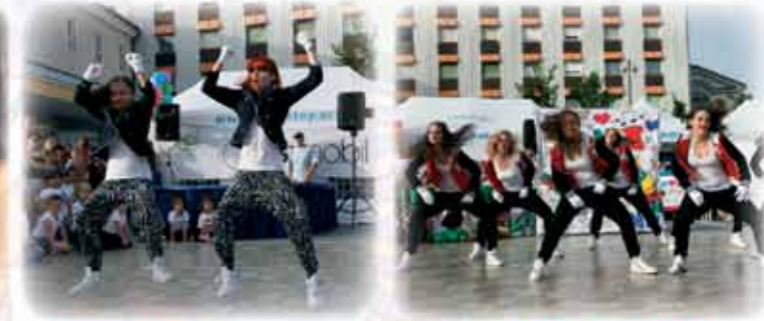
OSNOVNOŠOLCEM ponudimo obilico zabave ob HIP-HOP-u