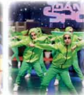
TEKMUJEMO na državnih, evropskih in svetovnih prvenstvih