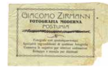
Oglas na pisemski ovojnici v italijanskem jeziku.