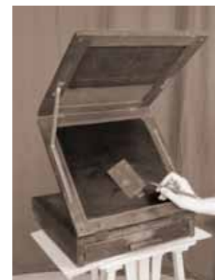
Retuširna mizica.

Retuša je bila namenjena glajenju gub, kože, podočnjakov, mozoljev ... Na ta način je pomladil in polepšal portretirance. Za negativ retušo je Zirmann uporabljal »retuš pult«, ki je bil narejen po naročilu in svinčnik z grafitno minico, ki se je brusila na brusnem kamnu v zelo tanko konico. Za boljši oprijem grafita na negativ je film namazal z matolajnom (zmes kolofonije in terpentina). Pozitiv retušo pa je izvajal na pozitivu oz. na fotografiji. Uporabljal je fotomaterial Agfa, Ferrania, Forte, Tensi in Fotokemika. Fotografski material je kupoval v trgovini Buffa v Trstu in Fotokemiki v Zagrebu. 9