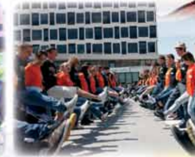
MATURANTE in VALETANTE naučimo plesnih korakov