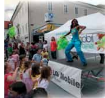
ZUMBA FITNESS - za dušo in telo