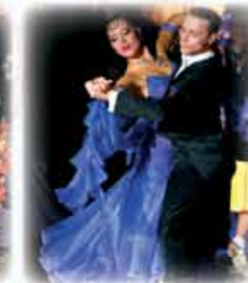
DRUŽABNI PLES ZA ODRASLE: standardni, latino in swing plesi