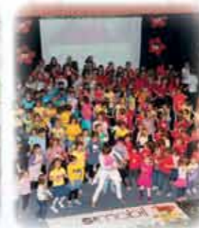
NASTOPAMO na plesnih prireditvah in se zabavamo