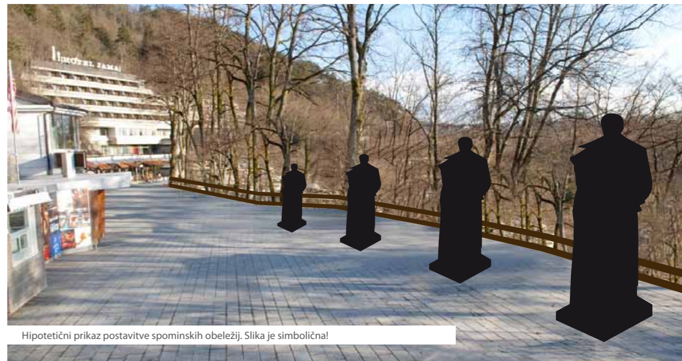
Hipotetični prikaz postavitve spominskih obeležij. Slika je simbolična!

Vsa naselja, tudi mesta, v svet odsevajo nekakšen »nebeški« red – iz sveta pa med drugim sprejemajo različne vplive. Zato