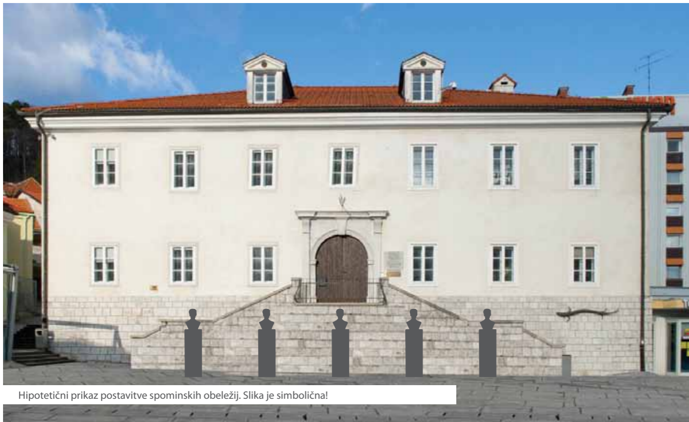
Hipotetični prikaz postavitve spominskih obeležij. Slika je simbolična!