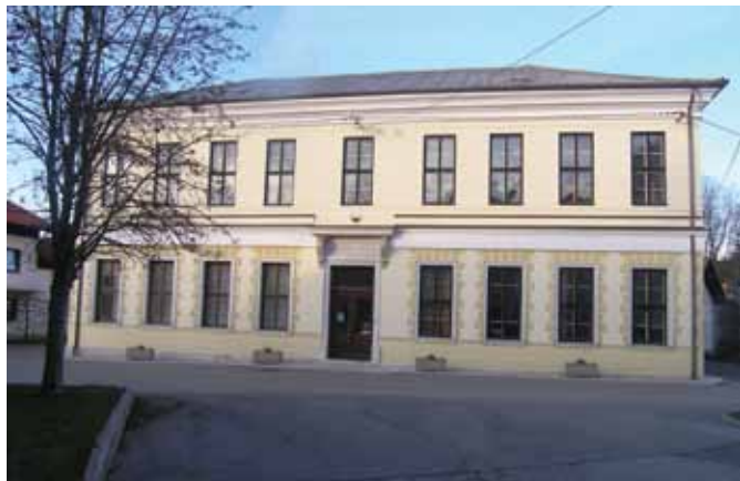
Mogočno poslopje nekdanje ljudske šole v Slavini