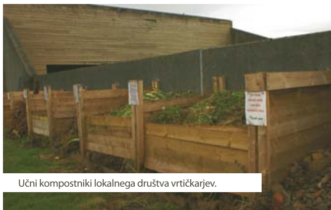
Učni kompostniki lokalnega društva vrtničarjev.

Vendar pa je sedanji trend razvoja panoge ravnanja z odpadki na Škotskem čisto drugačen od slovenskega. Medtem ko v Sloveniji že drugo leto neuspešno zapiramo odlagališča in ljudje nekako nočejo sprejeti, da so odpadki del njihovega življenja, je vkomponiranost problematike ravnanja z odpadki v vsakdanjem življenju Škota velika. To je posledica predvsem drugačnega pristopa k reševanju javne problematike in drugačnega načina sprejemanja odločitev, saj skuša Škotska vlada v proces odločanja čim bolj vključiti lokalno javnost in posameznike, ki bodo promovirali ta projekt. Tako nudi možnost sofinanciranja, sponzorstev in nagrad skupinam, društvom in prostovoljcem, ki morajo potem v svojo dejavnost vključiti tudi promoviranje sodobnega ravnanja z odpadki. Primeri takšne prakse na Škotskem, ki si jih je pogledala naša odprava, so npr. učenje kompostiranja v društvu vrtničarjev, modna revija z oblekami iz recikliranih odpadkov, otroške igrice z odpadki, sortirni stroj za embalažo pred supermarketom, popravljavnica odvrženih koles, kjer popravijo in prodajo 3.000 koles letno in popravljavnica odvrženih računalnikov, kjer hkrati izobražujejo nekvalificirane ljudi. V te programe Škotska vključuje predvsem težje zaposljive ljudi in ljudi s posebnimi potrebami. Na ta način blažijo tudi socialno problematiko, saj dajo tem ljudem možnost, da si sami zaslužijo za svoje življenje.