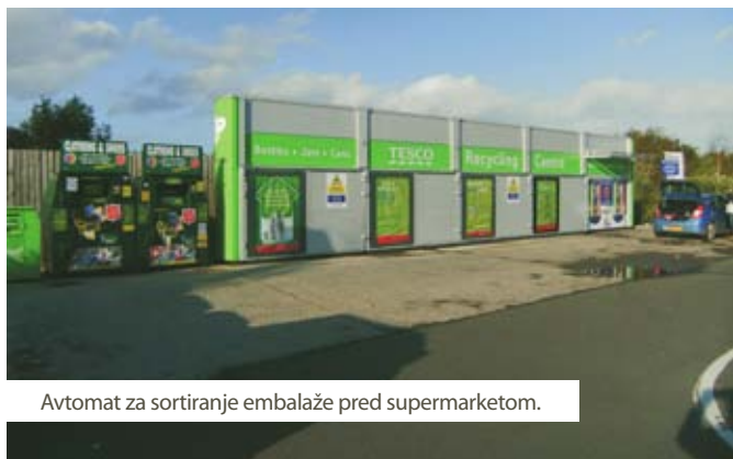
Avtomat za sortiranje embalaže pred supermarketom.

Na Škotskem se na področju odpadkov dela s polno paro. Med objekti ravnanja z odpadki, ki si jih je ogledala naša odprava, je bil najbolj zanimiv Binneco park ( http://binnecopark.com ), kjer popolnoma zasebni investitorji gradijo najsodobnejši center za obdelavo odpadkov na Škotskem, s ciljem proizvajati elektriko ter toploto, s katero bi gredli rastlinjake za gojenje alg za proizvodnjo biogoriva. Zanimiv je bil tudi ogled stare čistilne naprave, katero so spremenili v kompostarno, nato pa dogradili bioplinarno, ki sedaj predela 30.000 t kuhinjskih odpadkov letno in hkrati oskrbi z elektriko kar 2000 hiš.