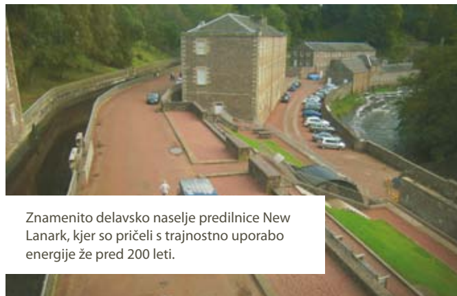
Znamenito delavsko naselje predilnice New Lanark, kjer so pričeli s trajnostno uporabo energije že pred 200 leti.

odpadki Škoti niso tako zelo različni od Slovenije, ravno zaradi tega, ker so se se problematike lotili dokaj pozno. Z nacionalnim programom ločevanja odpadkov so pričeli leta 1999, takrat so odložili 90 % odpadkov na odlagališčih. Zaradi pomanjkanja infrastrukture in neozaveščenost prebivalstva so se rezultati le počasi izboljševali in so tako še pred 7 leti ločeno zbrali le 20 % odpadkov. Danes je ta številka že 40 %, vendar še vedno zaostajajo za zadanimi cilji. V prihodnjih letih želijo povečati odstotek ločeno zbranih odpadkov na 60 %, do leta 2025 pa na 70 %.