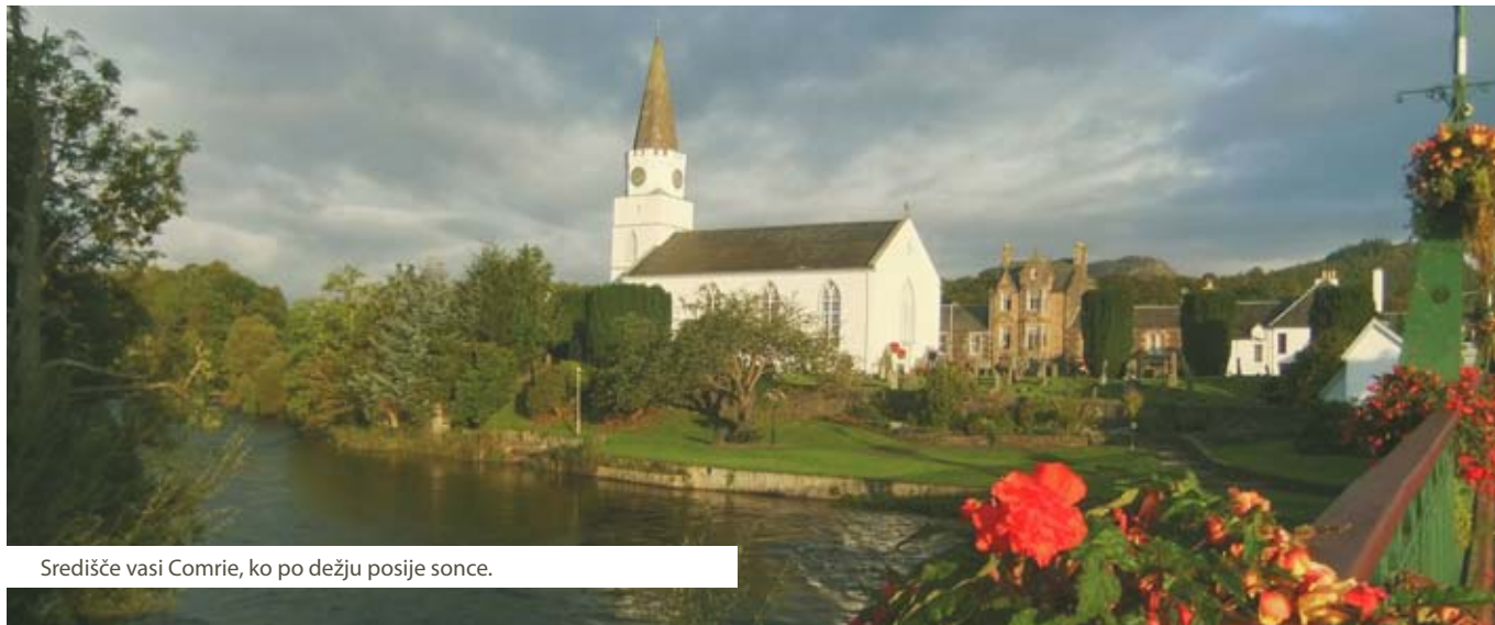
Središče vasi Comrie, ko po dežju posije sonce.