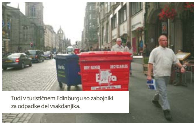
Tudi v turističnem Edinburgu so zabojniki za odpadke del vsakdanjika.

Na Škotskem se na področju odpadkov dela s polno paro. Med objekti ravnanja z odpadki, ki si jih je ogledala naša odprava, je bil najbolj zanimiv Binneco park ( http://binnecopark.com ), kjer popolnoma zasebni investitorji gradijo najsodobnejši center za obdelavo odpadkov na Škotskem, s ciljem proizvajati elektriko ter toploto, s katero bi gredli rastlinjake za gojenje alg za proizvodnjo biogoriva. Zanimiv je bil tudi ogled stare čistilne naprave, katero so spremenili v kompostarno, nato pa dogradili bioplinarno, ki sedaj predela 30.000 t kuhinjskih odpadkov letno in hkrati oskrbi z elektriko kar 2000 hiš.