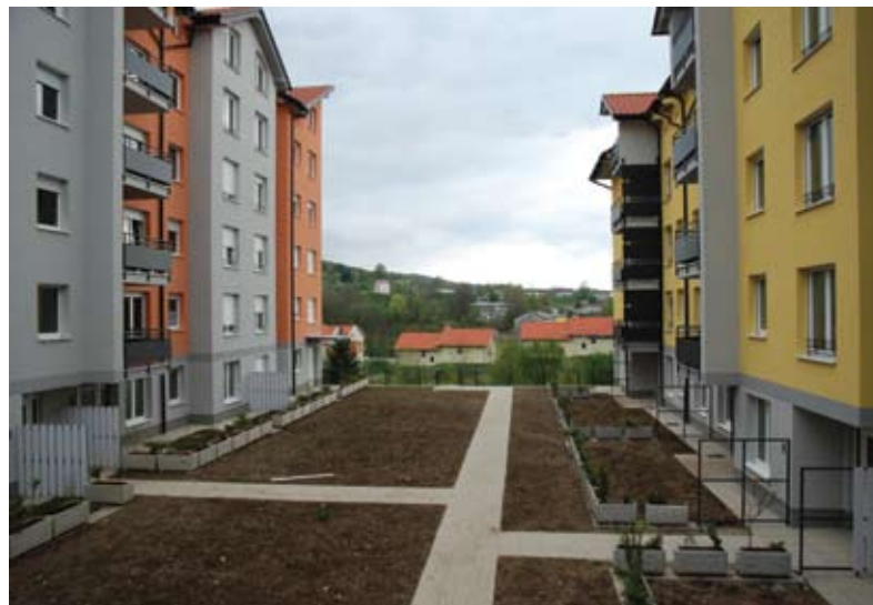
Park pod Javorniki