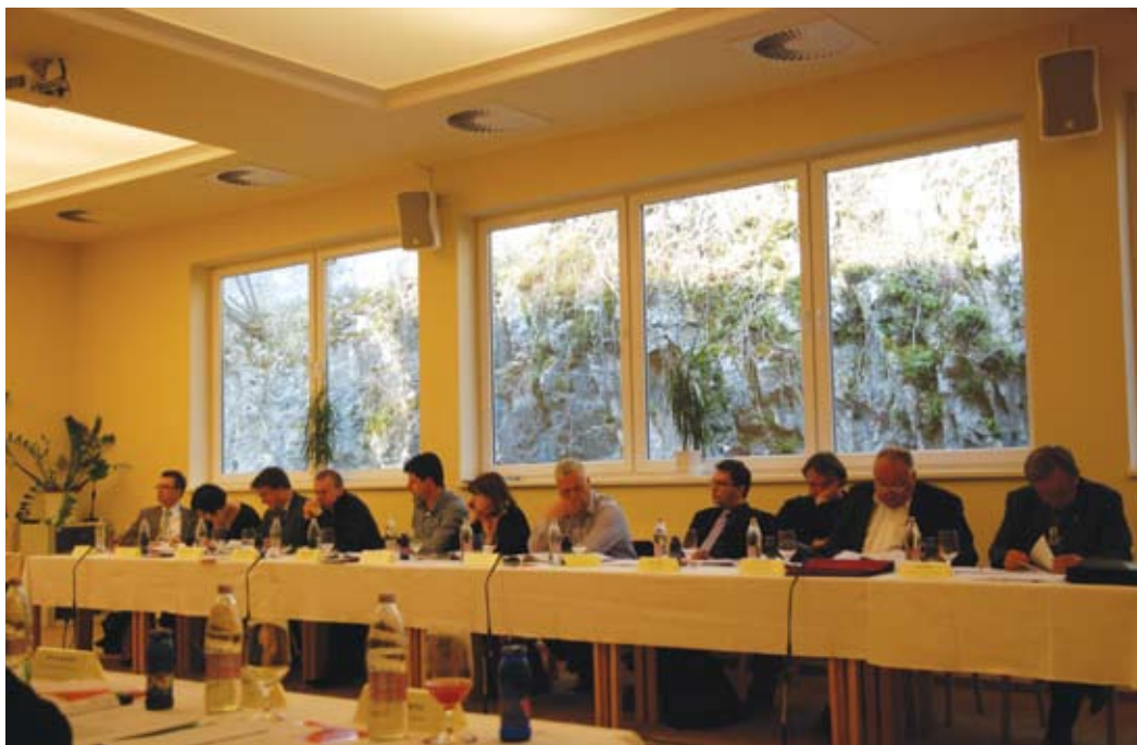
Občinski svetniki in svetnice na seji 7. aprila, ki je potekala v Jamskem dvorcu v Postojni.