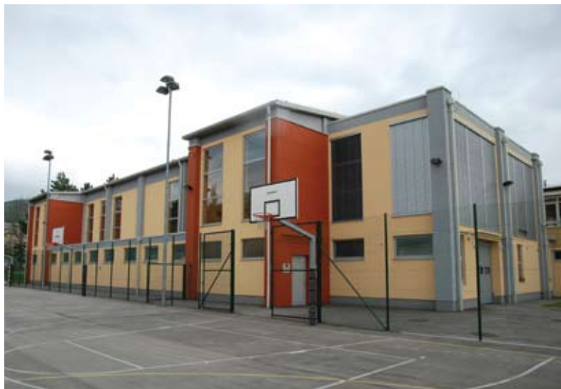
Telovadnica OŠ Antona Globočnika