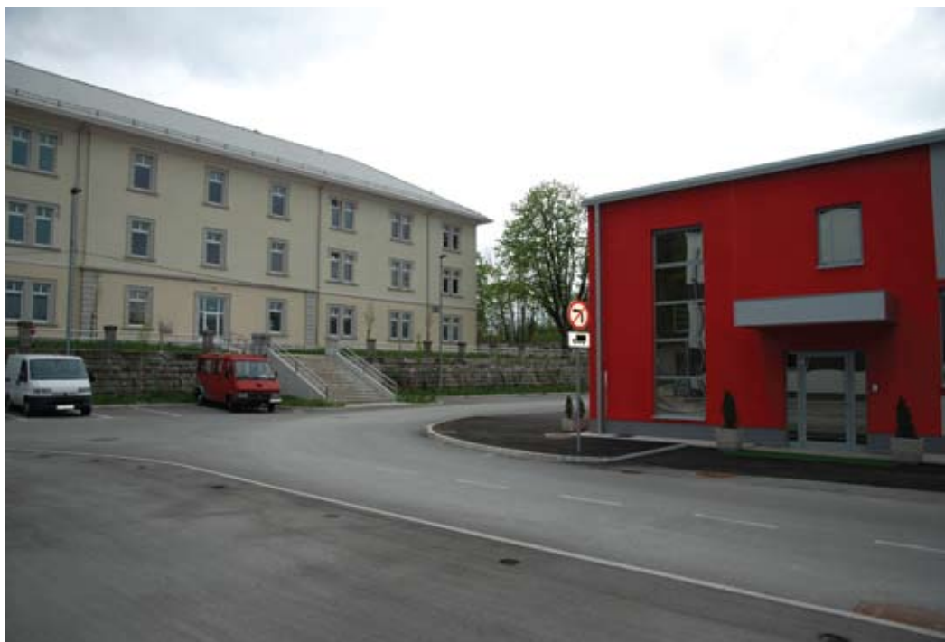
Podjetniški inkubator v Velikem otoku