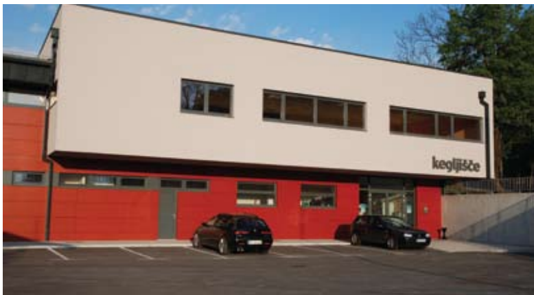
Izvedena je bila tudi ureditev večnamenskih objektov z zunanjo ureditvijo v športnem parku v Postojni (kegljišče)