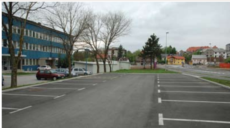
na infrastrukturi Prečne ulice, krožišča ter parkirišča pri zdravstvenem domu ter na Reški, Tržaški in Kosovelovi ulici.