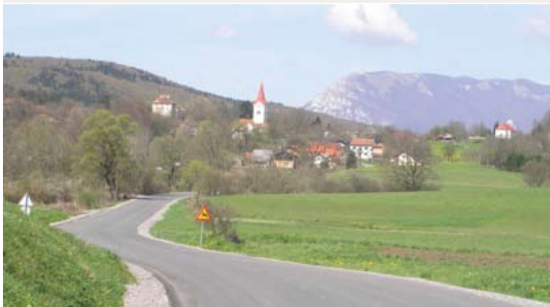
... na cesti okoli Soviča, cesti skozi Orehek (na fotografiji zgoraj),