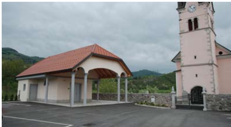
in novogradnja mrliške vežice v Studenem.