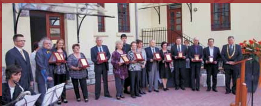
Odprtje Notranjskega muzeja Postojna in podelitev občinskih priznanj | str. 4 – 10

| Junij 2011 | letnik 5 | številka 15 | ISSN 1855-2382 |