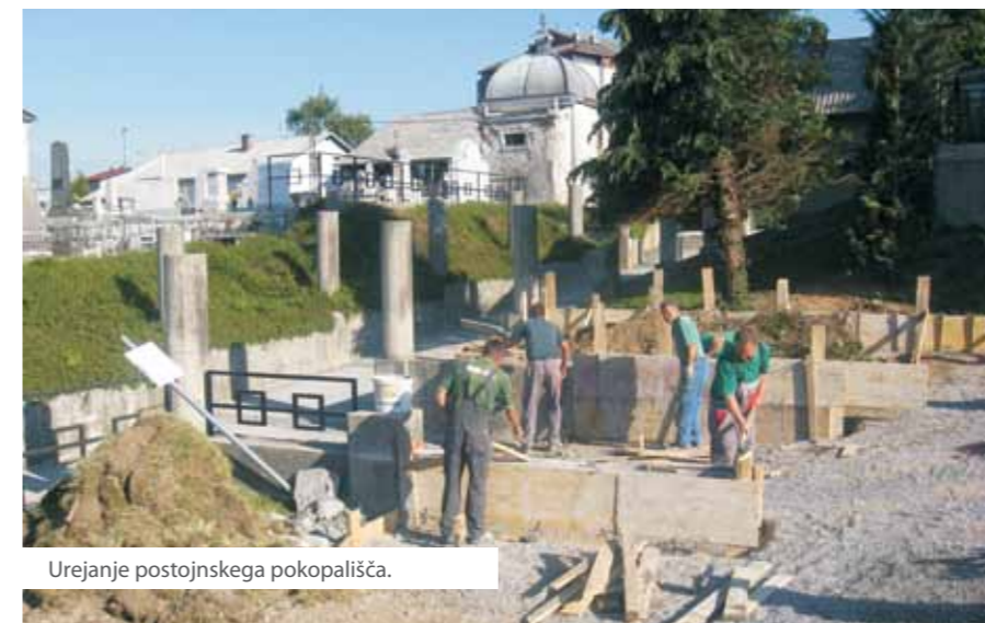
Urejanje postojnskega pokopališča.