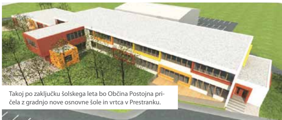
Takoj po zaključku šolskega leta bo Občina Postojna pričela z gradnjo nove osnovne šole in vrtca v Prestranku.

Menim, da se je že prvega pol leta pokazalo, da je bila naša odločitev pravilna. Muzej ni izginil. Ravno nasprotno. Preselil se je v nove prostore in v petek, 20. maja 2011, smo lahko skupaj prisostvovali otvoritvi prve, lahko bi rekli zgodovinske