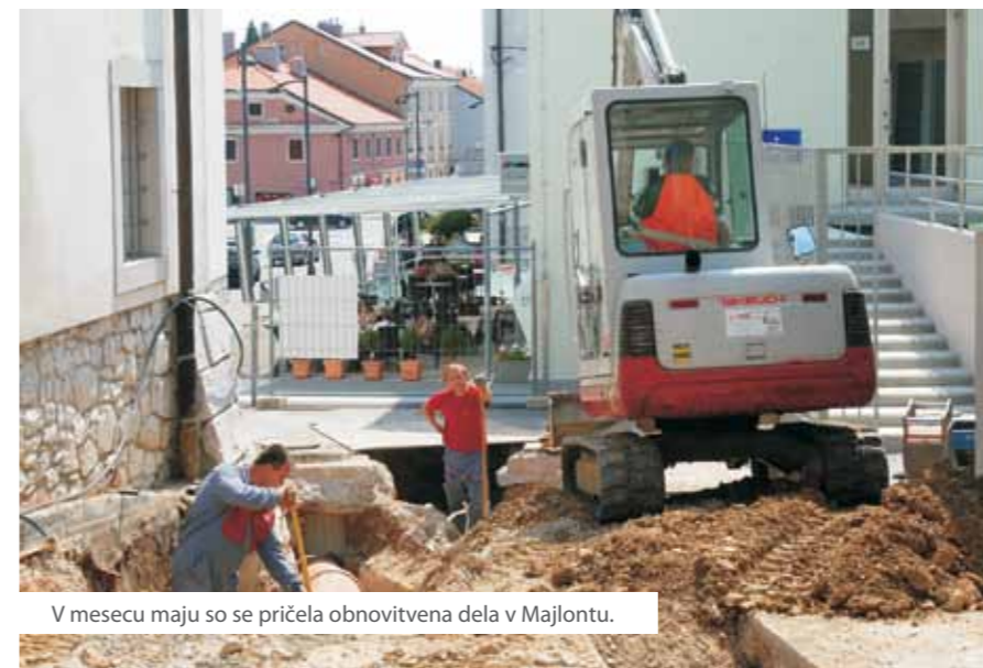
V mesecu maju so se pričela obnovitvena dela v Majlontu.