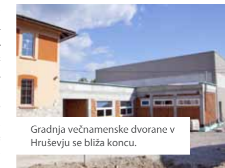
Gradnja večnamenske dvorane v Hruševju se bliža koncu.

Ogromno je bilo tudi investicij v objekte po vaseh. Tako smo obnavljali ali gradili kulturne in gasilske domove ter poslovilne objekte. V nekaj mesecih pa bo zaključena tudi gradnja večnamenske dvorane v Hruševju. Že čez dober mesec pa bomo pričeli z gradnjo nove osnovne šole v Prestranku.