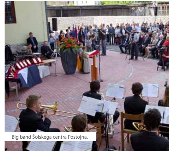
Big band Šolskega centra Postojna.

Od začetkov do danes so znali vedno prisluhniti prošnjam in potrebam lokalnih društev v Planini, kot so Kulturno društvo, Balinarsko društvo in Vzgojni zavod Planina. Tudi gasilci se za finančno in materialno pomoč vedno obračajo na njihova vrata.