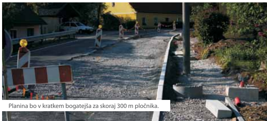
Planina bo v kratkem bogatejša za skoraj 300 m pločnika.

Gotovo smo s tem zagrizli v kislno jabolko. Vendar so takšni ukrepi nujno potrebni za zagotavljanje napredka v občini. Po mnenju strokovnih služb in očitno tudi občinskega sveta bo na ta način muzej lažje deloval in bo v svojem poslanstvu bolj učinkovit. V prejšnji organizaciji muzej ni zagotavljal tega, kar smo od njega kot ustanovitelji pričakovali, zato nas je upravičeno skrbelo, če bo v nespremenjenih razmerah uspel zadostiti pogojem, ki so bili postavljeni za črpanje evropskega denarja.