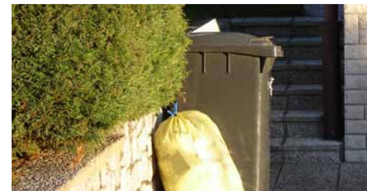
Primer dobre prakse: rumena vreča z odpadno embalažo je na odvoz pripravljena poleg črne posode