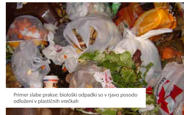
Primer slabe prakse: biološki odpadki so v rjavo posodo odloženi v plastičnih vrečkah

Kot pri vsaki uvedbi novega sistema se tudi pri tem kažejo tudi prve pomanjkljivosti. Največji problem predstavljajo količine rumenih vreč, predvsem na območju večstanovanjskih stavb. Izkušnje na terenu namreč kažejo, da je odvoz rumenih vreč na tri tedne zastavljen prereditko. V podjetju Publicus, d.o.o., Ljubljana že pripravljamo analizo, na podlagi katere bomo skupaj v dogovoru z Občino Postojna v najkrajšem možnem času izvedli spremembe. Glede na to, da pri večini večstanovanjskih stavb namestitve dodatnih posod zaradi pomanjkanja prostora ni mogoča, vidimo možnost za izboljšavo sistema le v povečanju frekvence odvoza rumenih vreč. O nameranih spremembah vas bomo sproti obveščali.