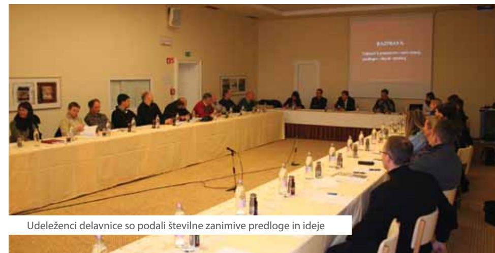
Udeleženci delavnice so podali številne zanimive predloge in ideje