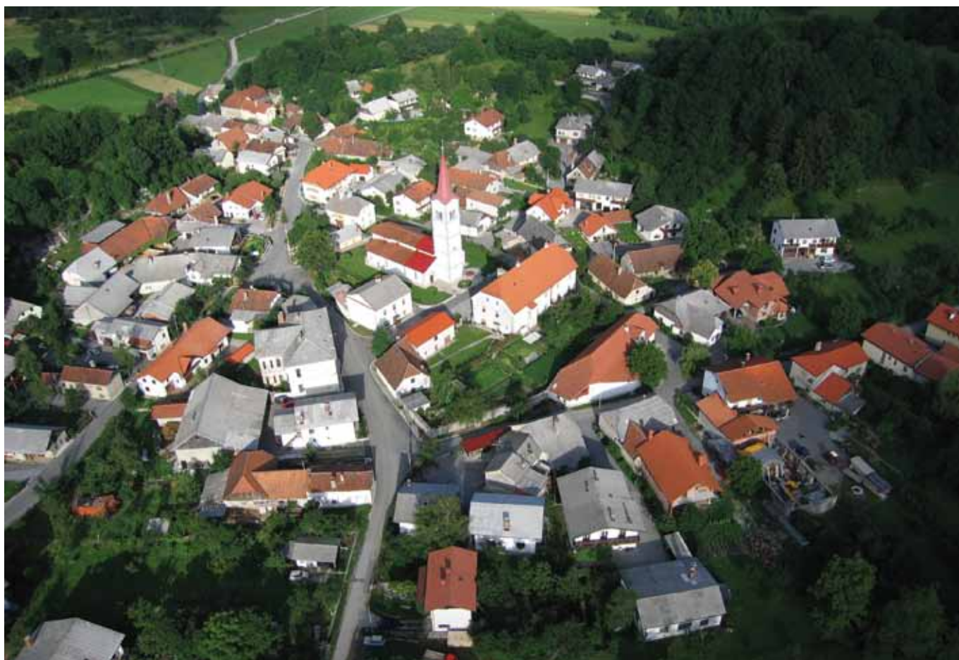
Slavina iz zraka