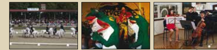
Kobilarna Lipica Pustni karneval v Cerknici Festival Svirel Štanjel

2015 KOLENDAR PRIREDITEV BRKINI • KRAS • NOTRANJSKA