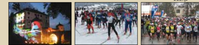
Mednarodni festival, Grad Snežnik Bloški teki, Nova vas Mali Kraški maraton, Sežana