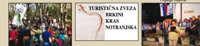
Pohod po sledih Soške fronte, Brestovica pri Komnu TURISTIČNA ZVEZA BRKINI KRAS NOTRANJSKA Škocjanski festival, Škocjan