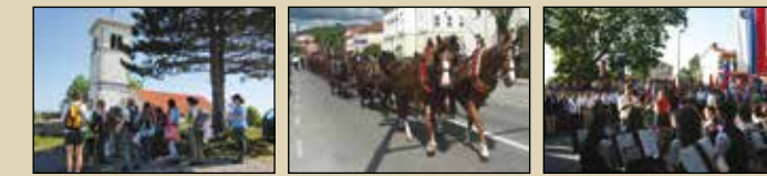
Krpanov pohod, Pivka Furmanski praznik, Postojna Spominski dan občine Hrpolje-Kozina