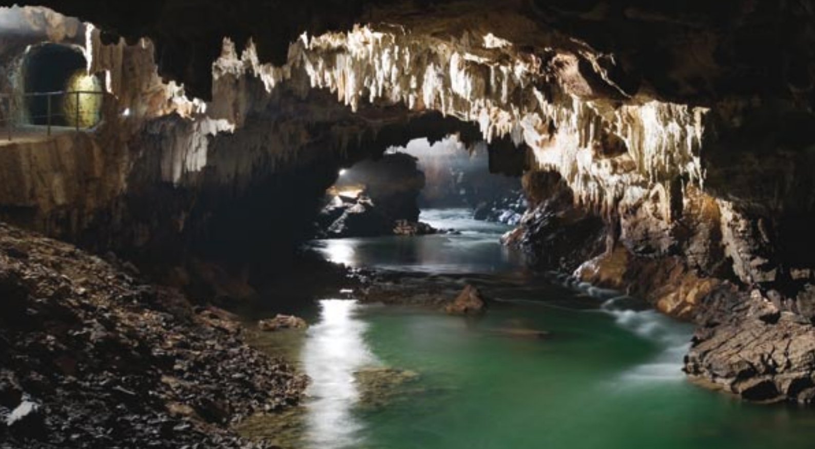
Pivka jama, kanjon reke Pivke