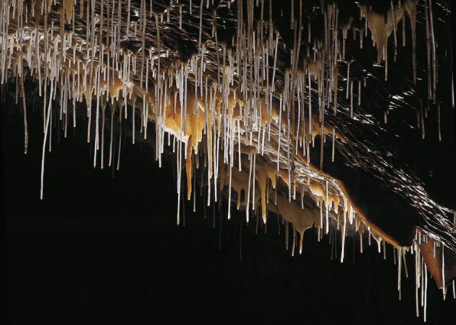
Postojnska jama, Špagetna dvorana