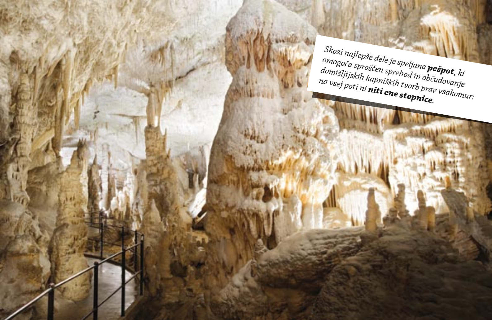
Postojnska jama, Lepe jame - Bela dvorana

Skozi najlepše dele je speljana pešpot , ki omogoča sproščen sprehod in občudovanje domišljjskih kapniških tvorb prav vsakomur: na vsej poti ni niti ene stopnice .