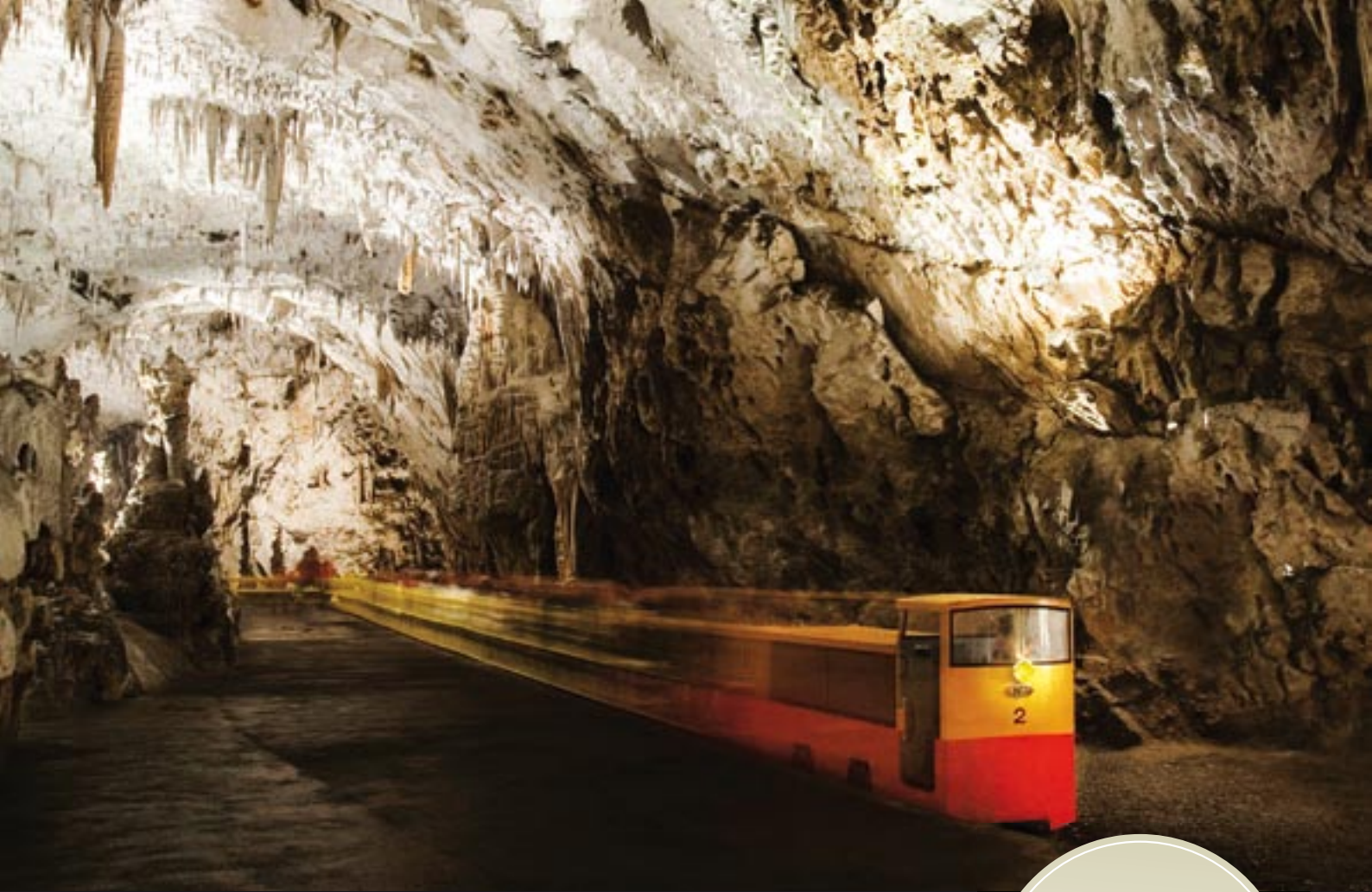
Postojnska jama, vlak pod Veliko goro