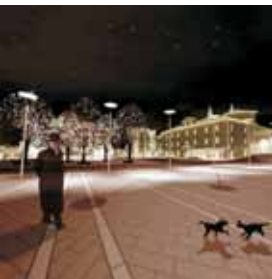
Prostorski prikaz ureditve Titovega trga

DRUGA NAGRADA za urbanistično zasnovo preнове in revitalizacije mestnega jedra Postojne TRETJA NAGRADA za arhitekturno idejno zasnovo mestne tržnice