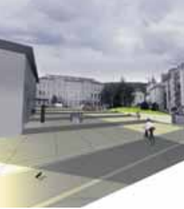
Prostorski prikaz ureditve Trga padlih borcev