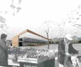
Prostorski prikaz ureditve mestne tržnice

Tržnica s poslovnim objektom zaključuje fasado Titove ceste in mestni kare. Predvideno je nivojsko parkiranje in v garažni hiši pod tržno ploščadjo in objekti.