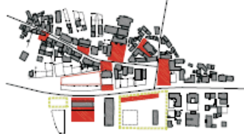
Postojna - mesto trgov

Elaborat rešuje območja ločeno predvsem s predlogi intenzivnejši novogradnji in širitev obstoječih programov v smislu zgoščanja stavbnega tkiva.