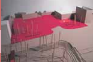
Prostorski prikaz ureditve Titovega trga

OBČINA POSTOJNA v sodelovanju z Zbornico za arhitekturo in prostor