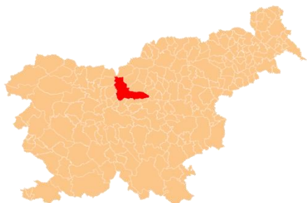
Slika 1: Lega občine v Sloveniji

Po zadnjih podatkih v občini živi 29.394 prebivalcev (vir: SURS) v 102 naseljih, od katerih je največje naselje Kamnik.