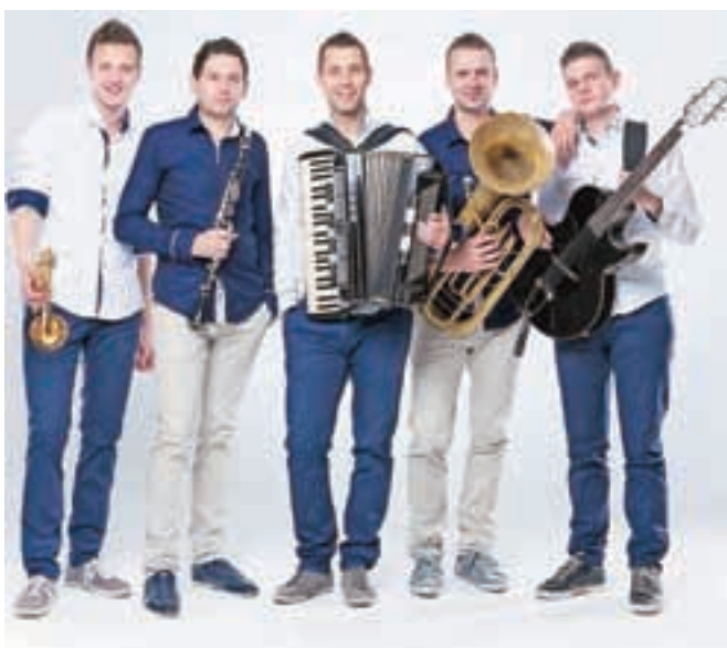
Zmaga na Slovenski polki in valčku je Ognjenim muzikantom dala veliko zagona za nadaljnje delo. V kratkem bodo predstavili videospot za zmagovalno polko Našel te bom.

V tem letu so bili mladi glasbeniki zelo dejavni, saj so izdali prvo zgoščenko z naslovom Ognjeni med vami, na kateri je trinajst skladb, imeli so prvi samostojni koncert in posneli tri videospote. »Nadaljevati nameravamo v podobnem tempu. Čez kakšen teden bo izšel tudi videospot za zmagovalno polko Našel te bom,« je