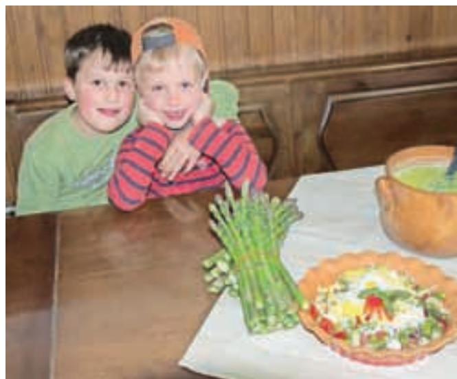
Beluši so v sezoni seveda dnevno na jedilniku. Tudi otroci jih imajo radi, predvsem v okusni kremni juhi in solati.

usmradi. Doma jih je najbolje hraniti na hladnem, v hladilniku, pokonci in zavite v vlažno krpo, svetuje Danica. Trenutno imajo v nasadu le zelene beluše, ki so bolj aromatični in krhki, gojenje belih pa so zaradi manjšega povpraševanja opustili pred leti. Beluši velja za kralja zelenjave, saj ima od vse zelenjave največ zdravilnih učinkov, pripisujejo mu celo moč zdravljenja rakavih obolenj kot tudi sloves močnega afrodisiaka. Ljudsko izročilo pravi: Kdor poje veliko belušev, ima veliko ljubimcev. Beluši odlično čistijo celoten organizem in ga preskrbijo z mnogimi hranilnimi snovmi, zato si jih surove ali kuhane privoščimo čim večkrat.