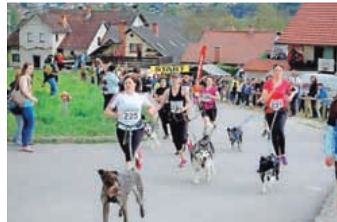
V Mekinjah so letos tekmovali tudi štirinožci.

so se pomerili na 500, 1000 in 2000 metrov, nato moški in ženske na pet kilometrov, najbolj vzdržljivi pa so se pomerili na 10-kilometrski progi. Najstarejši udeleženec je štel kar 75 let. Poleg tekačev je na progi nastopilo okrog trideset štirinožcev, ki so tekli poleg svojih lastnikov v disciplinah canicross ter bikejoring. Rezultate krosa si lahko ogledate na društveni spletni strani. ŠKD Mekinje se zahvaljuje prostovoljcem, donatorjem (posebna zahvala gre Občini Kamnik in podjetju Calcit), tekmovalcem ter tudi obiskovalcem, ki vsi skupaj prispevajo k vsakoletni tradiciji ter poskrbijo, da je dogodek vsako leto boljši.