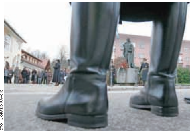
Kamničani si želijo vztrajati na poti, po kateri je stopal njihov rojak – general, domoljub in pesnik Rudolf Maister.