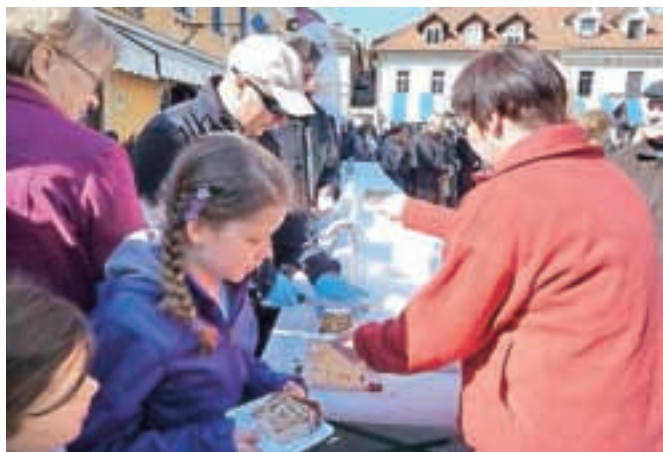
Razrez velikonočne potice velikanke