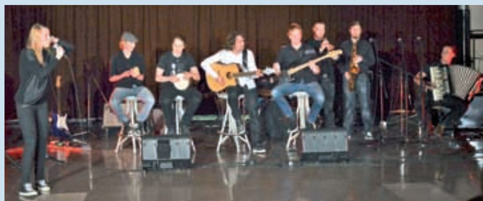
Koncert za dober namen na GSŠRM

Napovedujemo: Karierno tržnico in Prvi Maistrov pomladni ples v dobredelne namene.