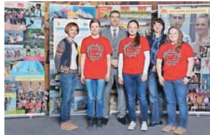
Ekipa Gimnazije in srednje šole Rudolfa Maistra Kamnik na letošnji Ekonomijadi