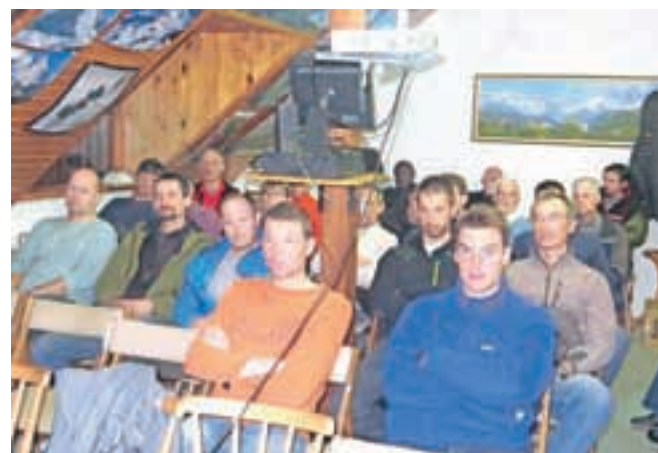
Na občnem zboru Alpinističnega odseka Kamnik