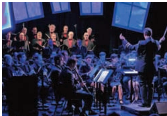
Za bogat kulturni program so med drugim poskrbeli člani Mestne godbe Kamnik in PSPD Lira.