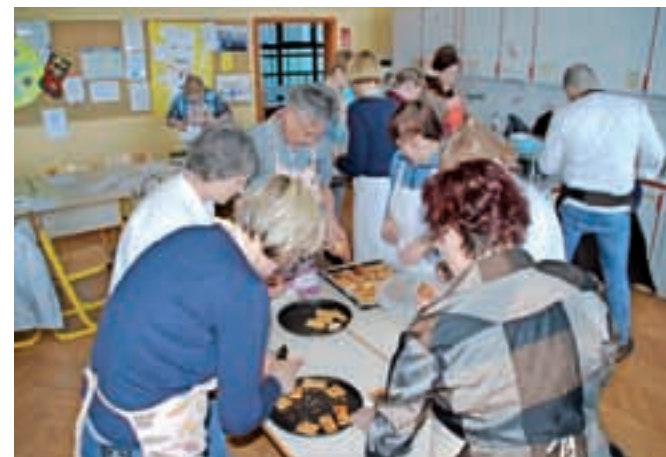
Udeleženci kuharske delavnice pri pripravi okusne kloštrske kremšnite

je namreč velik, saj šteje preko sto zaposlenih, poleg tega deluje na petih lokacijah, kar povečuje stalno skrb za ustvarjanje pogojev za sodelovanje. V delavnicah so zaposleni pridobivali timske izkušnje, se povezovali s sodelavci ter sebi omogočili nekaj časa za razvoj ustvarjalnih in drugih potencialov. V današnjih časih je sodelovanje med zaposlenimi še kako ključno za uspešnost in učinkovitost. Udeleženci so se поблиže spoznali z izdelavo sveč, pripravo jedilnika Okusi Kamnika, z jogo, pohodom v naravi, izdelavo mozaika, glasbeno sproščenostjo in modnimi smernicami z osnovami ličenja.