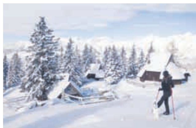
Krpljanje na Veliki Planini