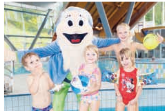
Zanimivi zimski paketi v Termah Snovik

Zimske vragolije lahko doživite na drsališču na prostem v starem mestnem jedru Kamnika, in sicer na parkirišču pri Franciškanskem samostanu. V času zimskih šolskih počitnic bo na voljo šola drsnja (od 23. do 28. februarja), vsak dan med 10. in 12. uro pa tudi pestra animacija . Prisluhnite zgodbam, ki jih s svojo bogato dediščino pripoveduje srednjeveško jedro