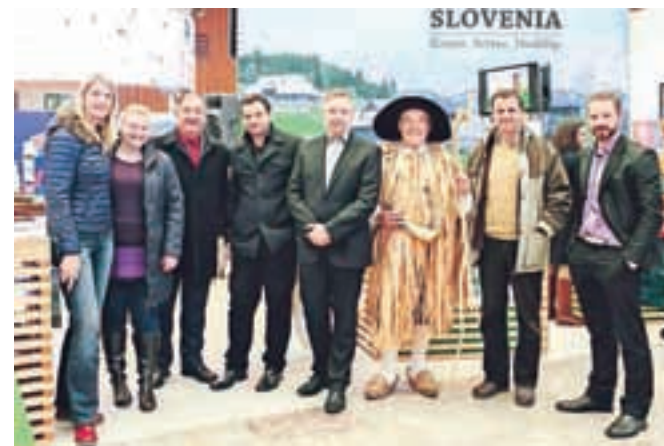
Predstavniki kamniške občine in turizma na sejmu Alpe Adria: Turizem in prosti čas