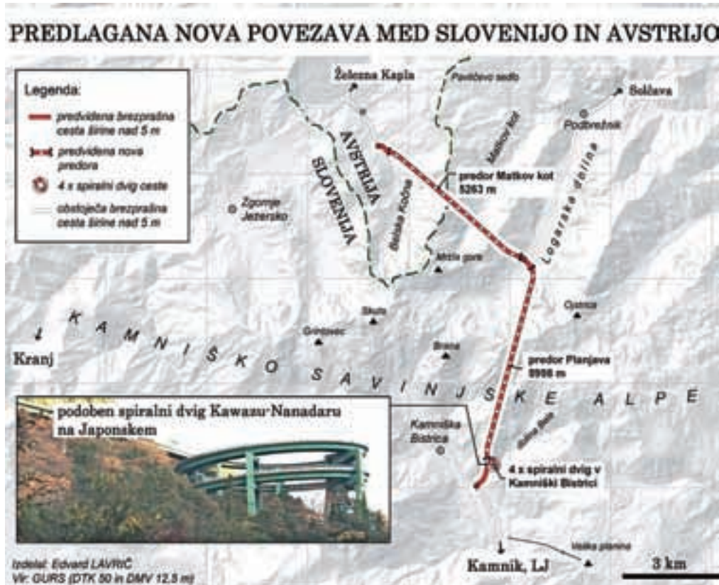
Grafični prikaz predlagane nove cestne povezave med Kamnikom in Avstrijo