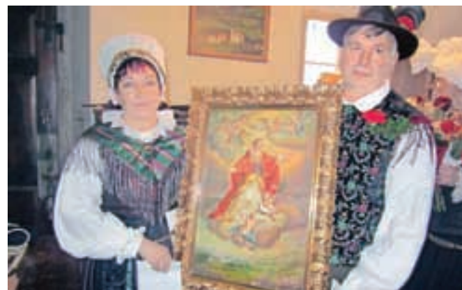
Selani so rojaku nadškofu podarili tudi sliko farne cerkve in zavetnice svete Neže.

»Nadškofa dojemam kot človeka širine, ki ga je prijetno poslušati, saj pove, kar tudi zares misli. Ko ti stisne roko, jo stisne krepko, te pogleda globoko v oči in to o človeku veliko pove. Misli, ki jo je danes namenil meni kot županu, ni kaj dodati. To je ena najlepših misli, kar sem jih slišal v zadnjem času in pove bistvo. Vsak naj stopi korak nazaj, vsak naj prizna drugega, pa bodo zadeve rešene. Za občino Kamnik je velika čast, da ima iz svoje srede nadškofa. Pri delu mu ne bo lahko, a ga bo zmož, ker je človek združevanja,« je povedal župan Marjan Šarec.