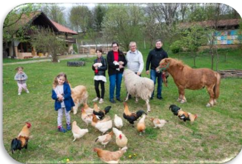
Čebelji gradič

Soba pod zvezdami – voden astronomski večer