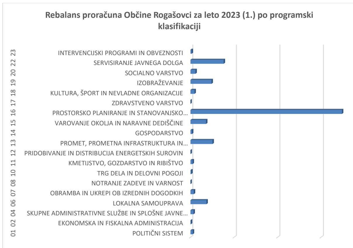
Graf 2: Programska klasifikacija – področja porabe