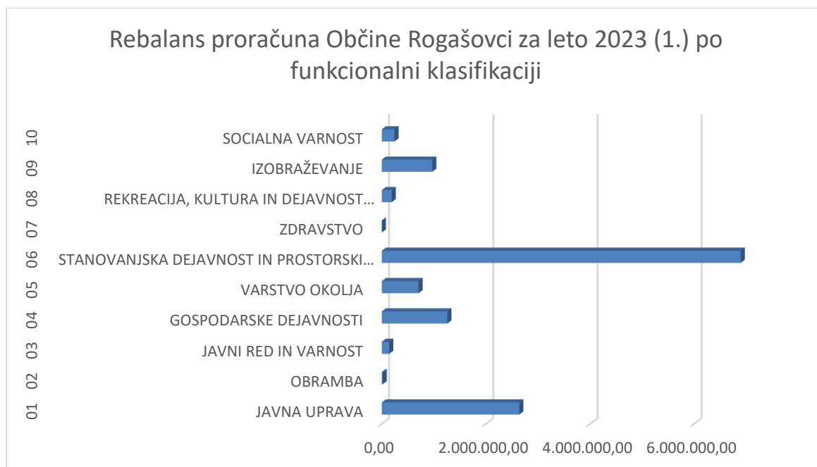
Graf 1: Funkcionalna klasifikacija – področje porabe