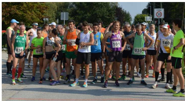
Pred startom 31. kostanjeviškega teka, september 2016

Prireditev šteje v točkovanje Tekov Dolenjske 2017 za pokal Vzajemne in za pokal Občine Kostanjevica. Proga je dolga 9 km. Start in cilj teka je pri Osnovni šoli Jožeta Gorjupa, Kostanjevica.