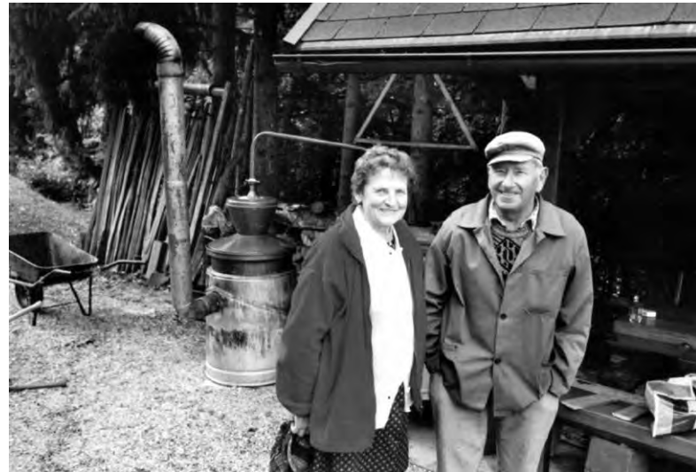
PRI ZIDANICI NA ŠMONKI OKOLI LETA 1995.