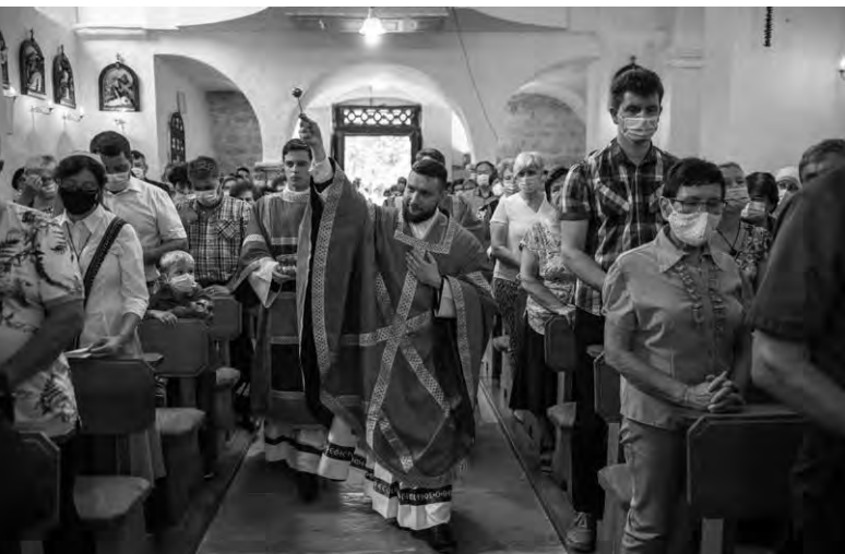
NOVA MAŠA V KOSTANJEVIŠKI FARNI CERKVI. foto: osebni arhiv

tega dejstva ne gre prezreti. Jasno pa je, da se je danes ideja evropskega zahoda začela rušiti, naše generacije so želele zgraditi najvišjo stolpnico človečnosti, toda pozabile so, da so še bolj kakor zunanji zidovi pomembni temelji. Bili smo idealisti, hoteli smo postati moderni, postali pa smo nihilisti, post (trans)humanisti. Ko smo tako najprej iz središča našega mišljenja spravili Boga, in smo sedaj izvrgli še človeka, kaj nam torej še preostane? Vsak dan smo priča, kako si evropski človek seka krščanske korenine, toda vsi razumemo, da drevo brez korenin ne more obstati. Tako ne bo mogla obstati niti Evropa. Ne moremo živeti evropskih vrednost, če ne živimo krščanskih krepostih. Če pomislimo na zadnjih 150 let filozofske misli, vidimo, da je kar nekaj odličnih mož poskusilo predstaviti sistem družbenega ustroja, etike in mišljenja brez Boga, pa jim to v širšem smislu ni uspelo, ker preprosto ne gre. Naša civilizacija je zato obsojena na propad in bo brez spreobrnjenja, brez pozitivnega vrednotenja lastne tradicije propadla kakor grška ali rimska, pri čemer je naravnost osupljivo, kako podobni postajata (ne)moralnost antičnega sveta in (ne)moralnost sedanjega sveta. Prišle bodo torej nove civilizacije kakor za Rimom in Atenami. Vprašanje je torej le še kdaj. Obstoj naše družbe je seveda mogoč, toda zavedati se moramo, da ne tudi absoluten in da bo potrebna tudi naša konkretna aktivna participacija v tej obnovi.