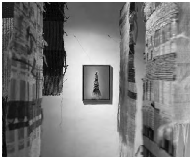
Eva Sajovic, Visenje na nitki