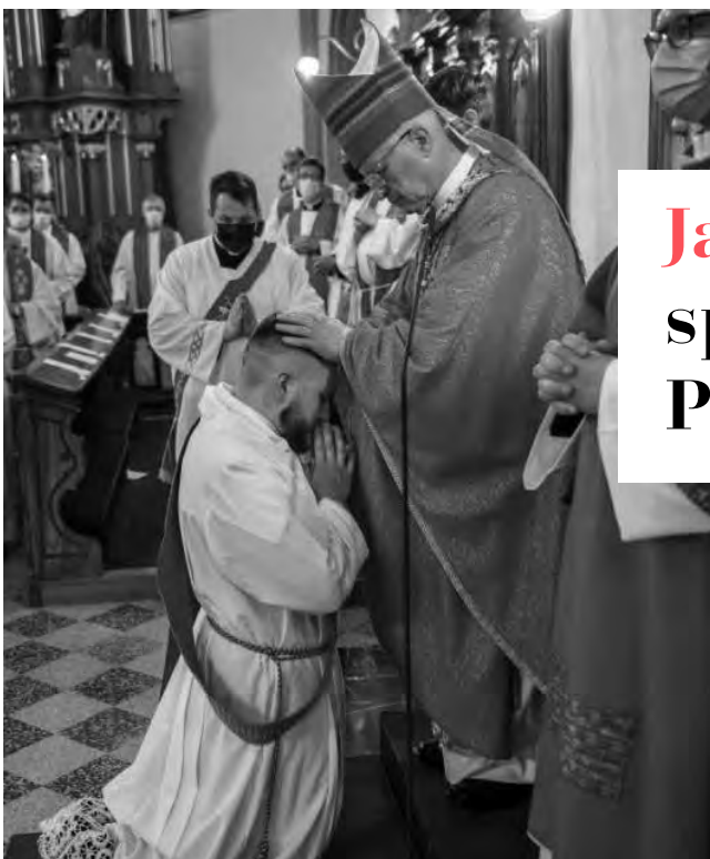
MAŠNIŠKO POSVEČENJE V STOLNI CERKVI SV. NIKOLAJA V NOVEM MESTU.