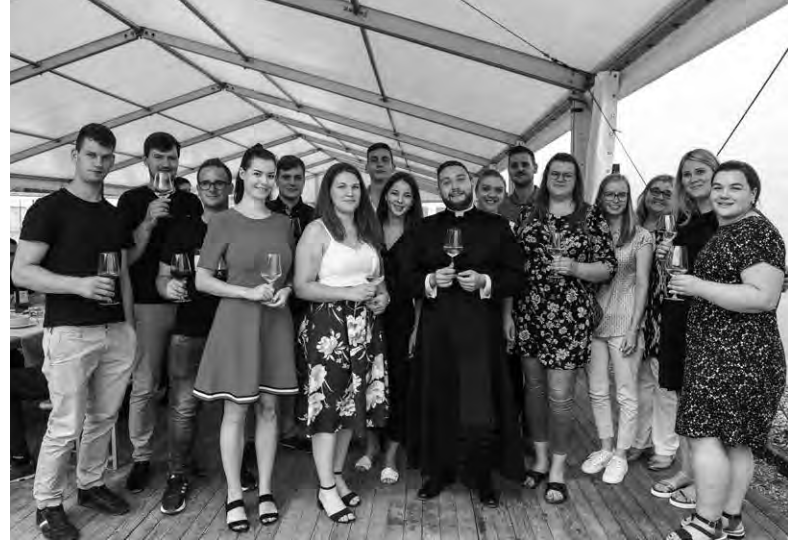
Z OSNOVNOŠOLSKIMI SOŠOLCI NA NOVOMAŠNEM KOSILU.

Zadnje čase se pogosto zalotim ob misli, kako stari so ljudje, ki vodijo in usmerjajo naš svet, v mikro in makro okoljih. Nikakor ne zanikam izkušenj, modrosti, vsega dobrega, kar prinesejo leta, toda z druge strani, pogosto pogrešam svežino, entuziazem, drugačne poglede, nove poti. Morda so danes mladi premalo glasni, lahko pa rečemo tudi, da so premalo slišani. Verjetno je to tema,