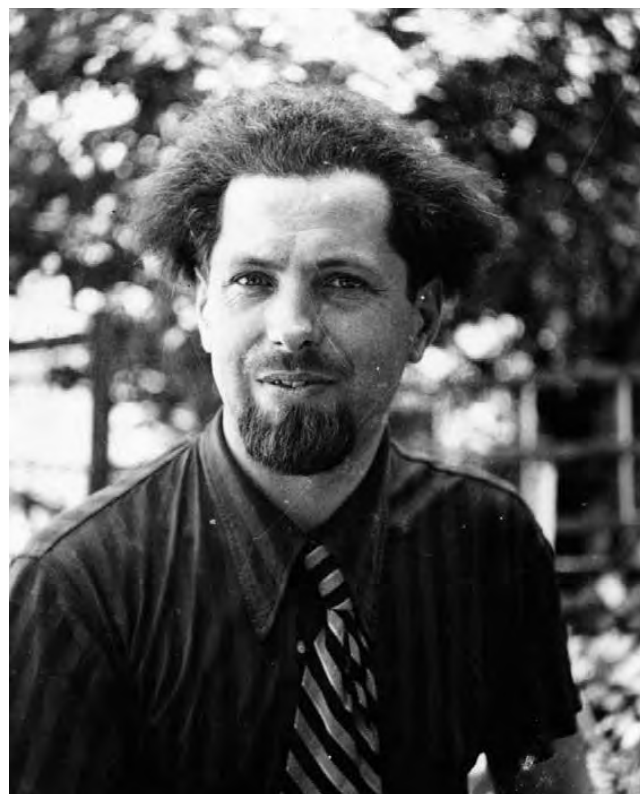
Tone Kralj okrog leta 1940