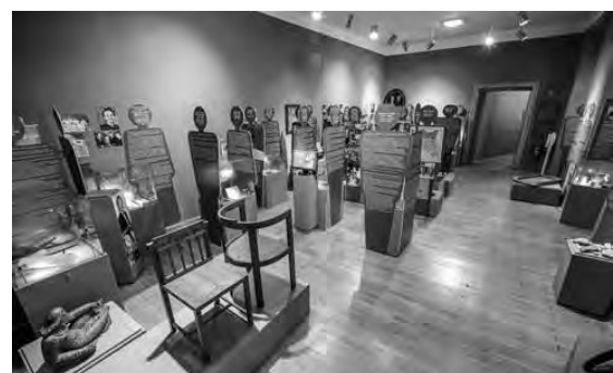
Pogled na razstavo Štirje elementi: 3 – ZEMLJA.