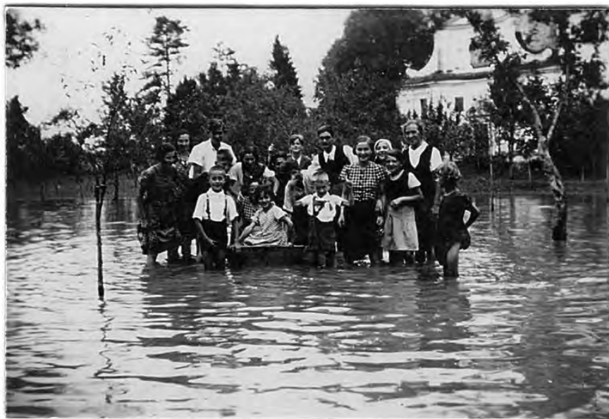
Pred drugo svetovno vojno je v prostorih nekdanjega samostana, gradu, kot so ga domačini imenovali, živelo 23 družin. Fotografija je iz avgusta 1937, ko so se velike vode bližnjega Obrha razlile po sadovnjaku pred grajskim poslopjem.