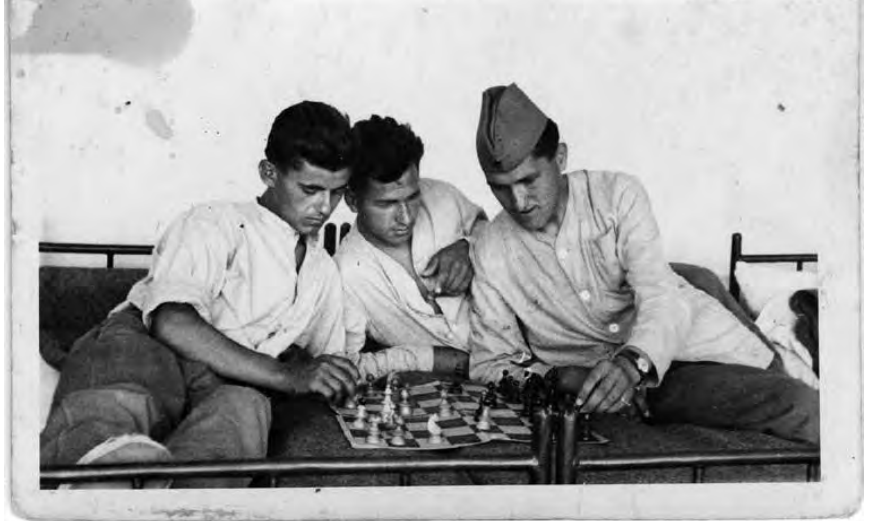
Med dvoletnim služenjem vojaškega roka v Makedoniji smo si vojaki krajšali čas z igranjem šaha.

Leta 1970 sem se vpisal v delovodsko šolo v Novem mestu in po končanem šolanju postal delovodja, kar se je poznalo tudi pri osebnem dohodku. 1974 sem se za nekaj let zaposlil v SOP IKONU v Kostanjevici na Krki in delal veliko po terenu. Na prigovarjanje nekdanjega sodelavca in prijatelja sem se vrnil v IMV, kar sem pozneje obžaloval. Leta 1991 sem se po šestintridesetih delovnih letih upokojil in to z veseljem, saj so bili v tistem času odnosi v podjetju izredno slabi. Doma me je čakala mlada upokojenka, ki je šla v pokoj leto dni prej. Zaživela sva svobodno življenje. Tako je prišel čas, ko si sam sebi šef in po svoji volji odločaš, kaj boš počel. Ker moraš približno deset ur, ki si jih prej posvetil službi z nečim nadomestiti, sem začel