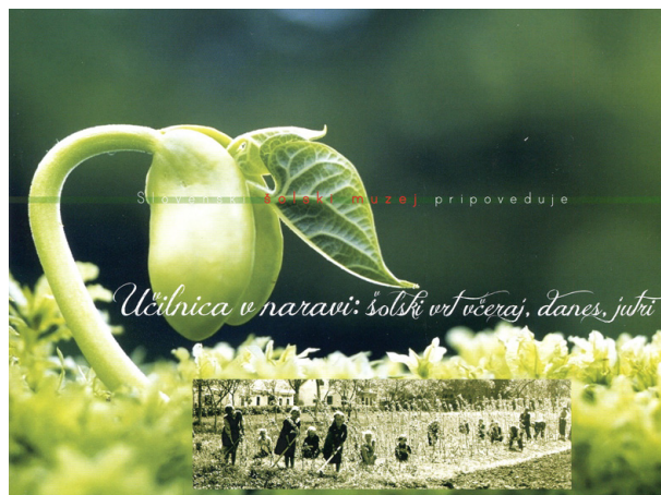
Otroci na šolskem vrtu, Državna ljudska šola v Sentjernejem na Dolenjskem, okoli 1930

Sodelujejo: Ministrstvo za kmetijstvo, gozdarstvo in prehrano, Ministrstvo za zdravje, Nacionalni inštitut za javno zdravje, projekt Kuhnapat, muzeji (Slovenski šolski muzej, Mestni muzej Krško...), slovenski arhivi