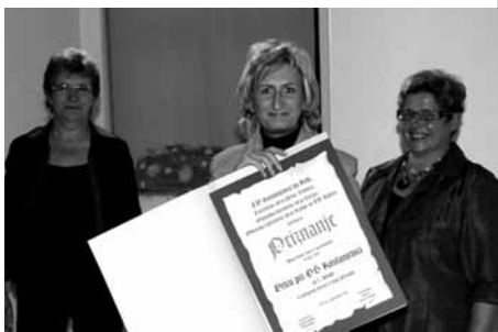
Turistične nagrade 2009

V petek, 25. septembra 2009, je bila na brežiškem gradu osrednja prireditev Turistične zveze Posavja, regijsko ocenjevanje v okviru projekta "MOJA DEŽELA - LEPA IN GOSTOLJUBNA". Na njej so podelili priznanja za najlepše urejene kraje, mesta, šole in vrtnice. V kategoriji šol, zgrajenih pred letom 1980, je Osnovna šola Jožeta Gorjupa prejela POSEBNO PRIZNANJE za ohranjanje in varstvo kulturne dediščine, vrtec pri naši osnovni šoli pa je med vsemi vrtnicami v posavskih občinah (Radeče, Sevnica, Krško, Brežice, Kostanjevica na Krki) osvojil TRETJE MESTO. V kategoriji izletniških krajev je Kostanjevica na Krki zasedla 1. mesto.