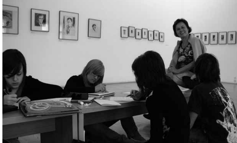
Literarna skupina pri ustvarjanju