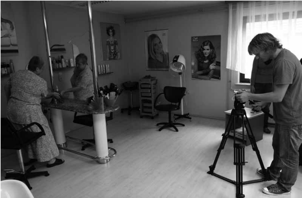
Med snemanjem dokumentarca o frizerjih