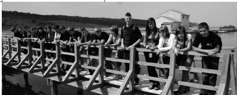
Učenci 9. razreda na zaključni ekskurziji v sečoveljskih solinah

Šolski koledar letos določa 190 šolskih dni, mednje sodijo tudi dnevi dejavnosti, ekskurzije, šole v naravi ... Že na začetku leta so si učenci od 1. do 5. razreda v okviru kulturnega dneva v Ljubljani ogledali baletno predstavo, ki je nastala po znanem literarnem delu Picko in Pačko. Devetošolci so na zaključni ekskurziji spoznali geografske, zgodovinske in naravoslovne posebnosti primorskega sveta, podali pa so se tudi v zabavišni park v italijanski Gardaland.