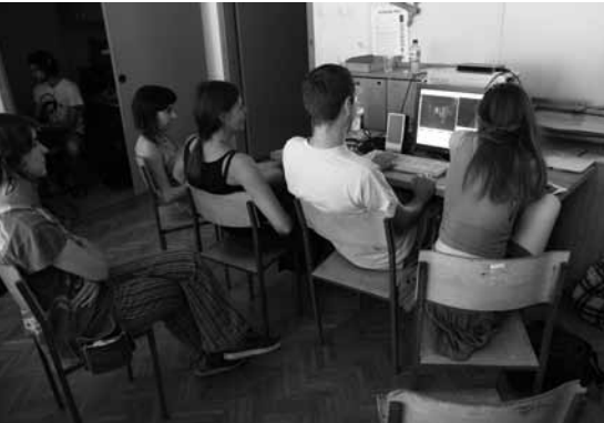
Med montiranjem filma Evrosad