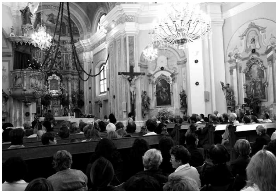
Kvatrna maša v cerkvi na Slinovcah