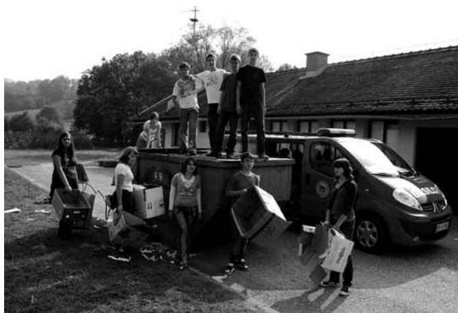
Zbiranje odpadnega papirja