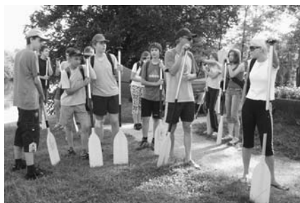
Športno – naravoslovni tabor 8. razreda