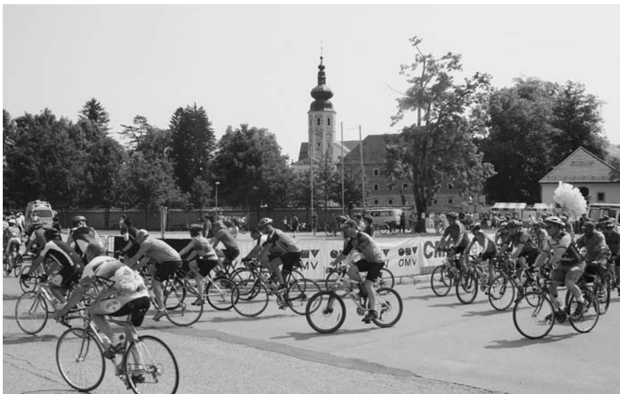
Start diplomatskega kolesarskega maratona pred Galerijo Božidar Jakac