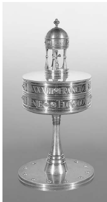
»Plečnikov ciborij« po posredovanju mag. Emilije Fon ga je po Plečnikovih načrtih izdelal Ivan Kregar