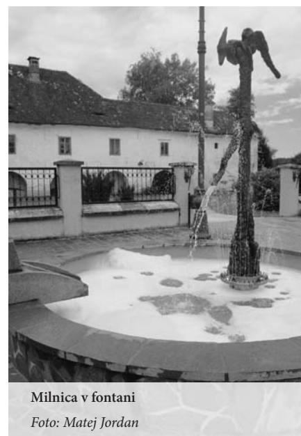
Milnica v fontani

– Ponovno moram izpostaviti problem odlaganja smeti na pokopališču. Uporabniki se ne držijo reda, saj smeti odlagajo izven predpisanege predela, kjer stojijo smetnjaki, ali pa ob samih smetnjakih. Naročili