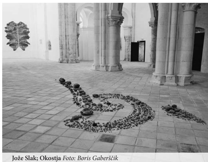
Jože Slak; Okostja