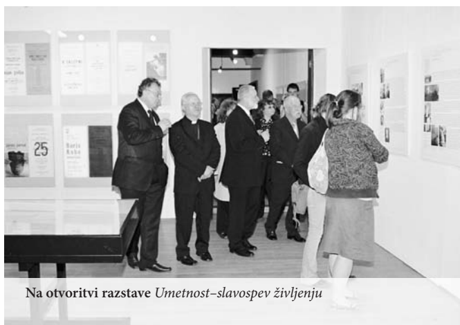
Na otvoritvi razstave Umetnost–slavospev življenju