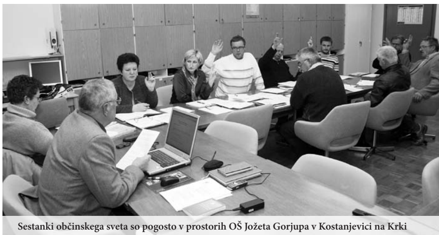
Sestanki občinskega sveta so pogosto v prostorih OŠ Jožeta Gorjupa v Kostanjevici na Krki