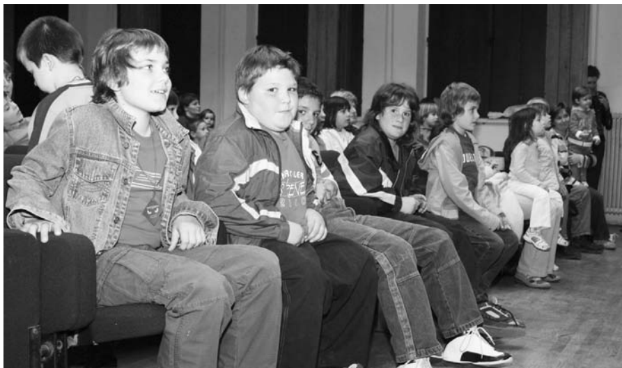
Naši osnovnošolci na lutkovni predstavi Zverjasec