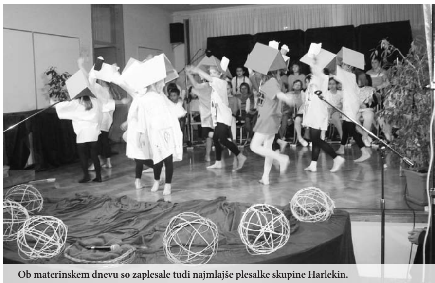
Ob materinskem dnevu so zaplesale tudi najmlajše plesalke skupine Harlekin.

slednjih dveh mesecih pa pripravljamo še celo vrsto različnih taborjenj. Najprej se bodo na tridnevno bivanje v CŠOD v Rakov Škocjan odpravili učenci, ki so bili identificirani kot posebej nadarjeni. Njihova tema bo od 13. do 15. aprila predvsem kras in njegove značilnosti. To bo poleg obiska Hiše eksperimentov že druga dejavnost za nadarjene v tem letu. Od 11. do 13. maja se na podobno taborjenje v CŠOD Fara odpravljajo tudi naši tretješolci, za otroke, ki obiskujejo vrtec, pa bomo prvič organizirali tridnevno bivanje v mladinskem zdravilišču na Rakitni . Vsem tem izvenšolskim oblikam bo sledila še dvodnevna ekskurzija za učence 9. razreda, ki se bodo junija preizkusili še na planinski turi , bivanje v šoli kot obliko športno-naravoslovnega tabora pa bomo ponudili osmošolcem in prvošolcem. Poleg tega nas v juniju čaka še letna šola v naravi v Nerezinah za četrtošolce in plavalni tečaj za učence drugega razreda – predvidoma v začetku junija.