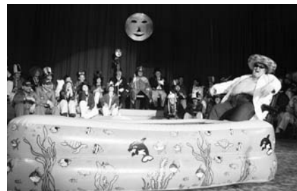
Vrelec mladosti Štihe, ki bo v bližnji prihodnosti nadomestil Jadransko riviero.