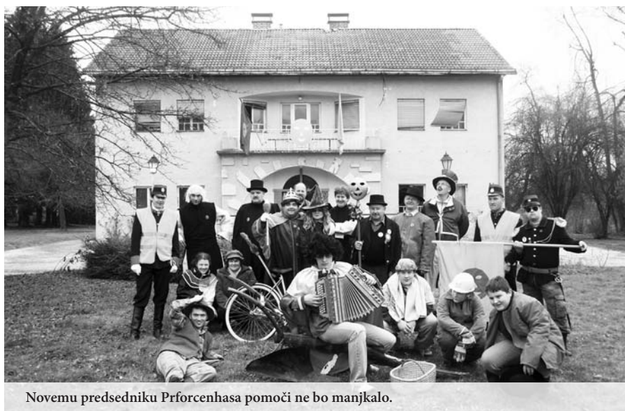
Novemu predsedniku Prforcenhasa pomoči ne bo manjkalo.