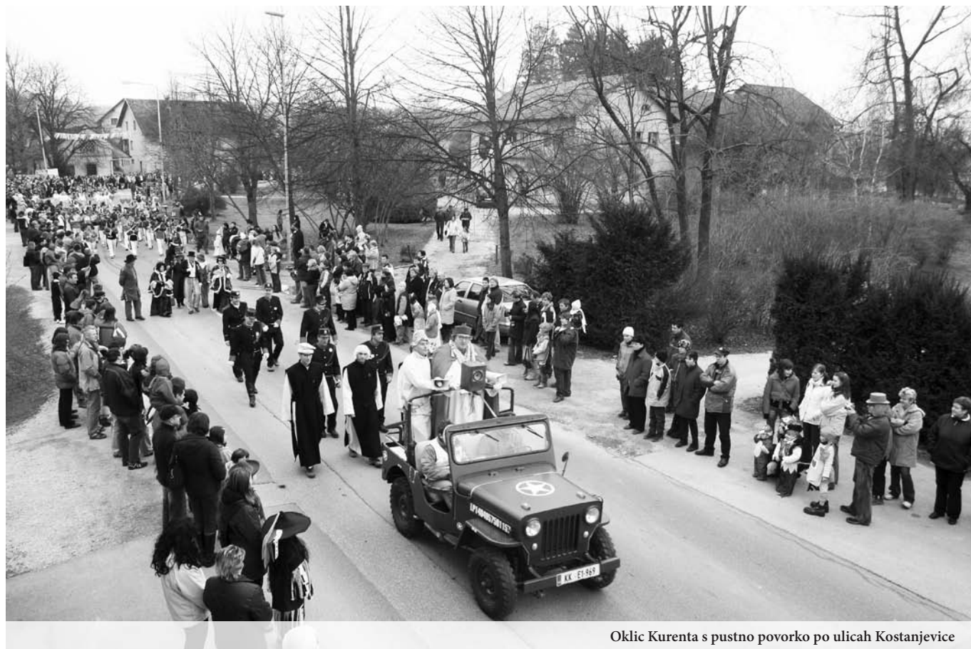
Oklic Kurenta s pustno povorko po ulicah Kostanjevice