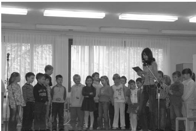
Sprejem prvošolcev v šolsko skupnost

8. novembra 2006 smo naše prvošolce sprejeli v šolsko skupnost. Prvič so se nam predstavili s pesmicami in igrico, njihov vstop med »taprave šolarje« pa so spremljali tudi številni starši.