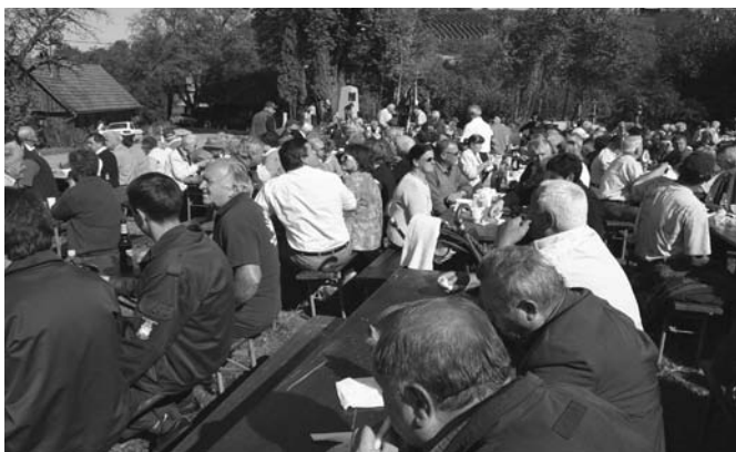
Prijetno druženje ob lovskem golažu