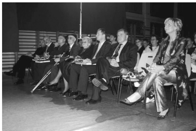
Visoki gostje na slavnostni akademiji