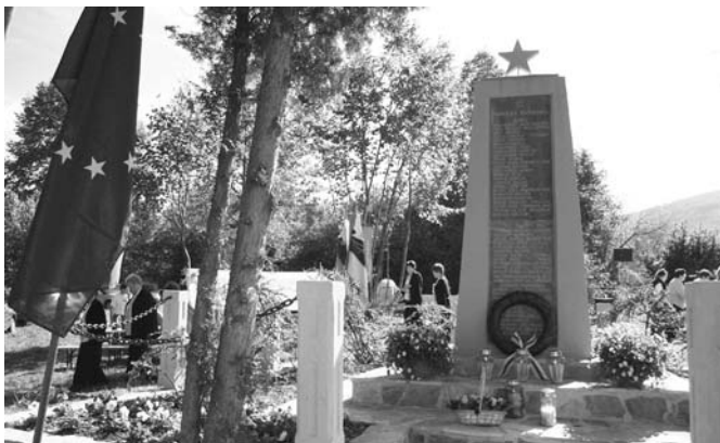
Obnovljen spomenik na Oštrcu