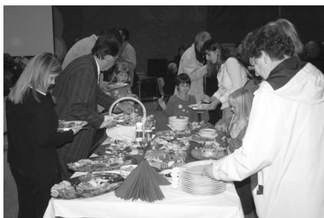
Ob okusni hrani naših odličnih kuharic je tudi druženje prijetnejše.