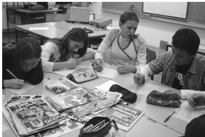
Skupina raziskovalcev 9. a razreda