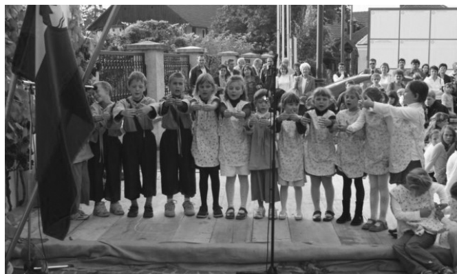
Nastop najmlajših pred Lamutovim likovnim salonom