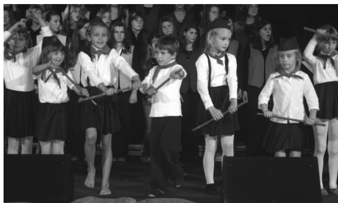
Plesalci skupine Harlekin so nas popeljali v čas pionirjev.