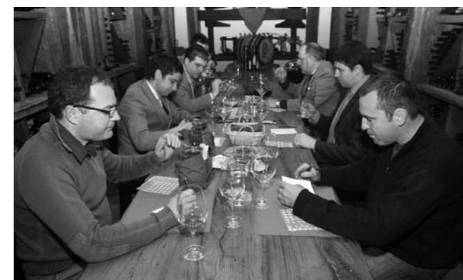
Ocenjevanje vin v vinoteki Gostilne Kmečki hram.