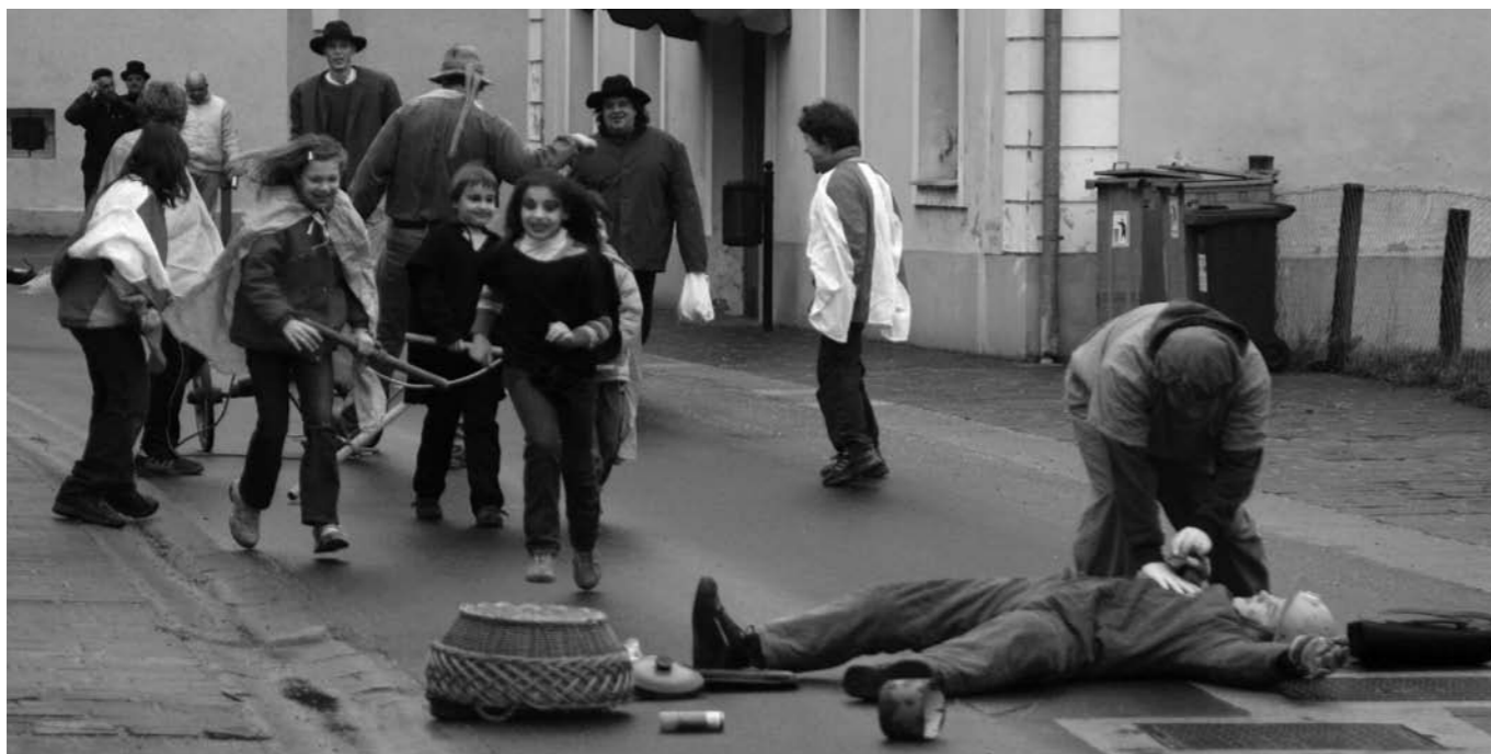
Oranje in sejanje.