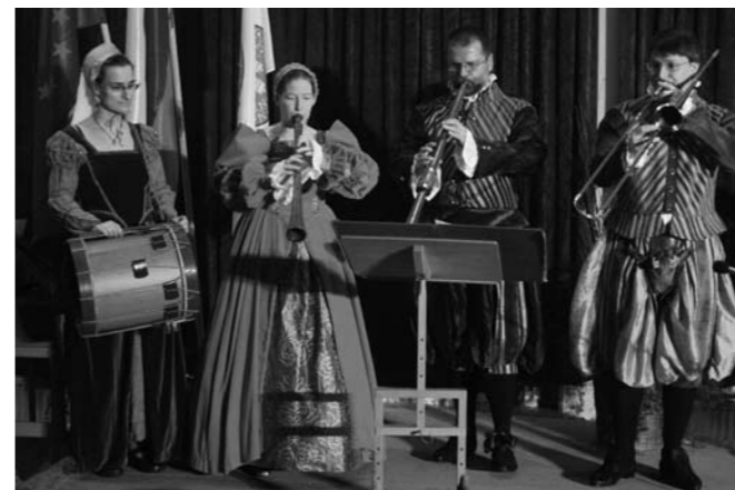
Ob slovenskem kulturnem prazniku nam je srednjeveško glasbo predstavil kvartet ALTA CAPELLA CARNIOLA.

V prireditvi želimo vključiti tudi člane vaših društev (sodelovanje so že potrdili društvo upokojencev, planinsko društvo in Društvo podeželskih žena pod Gorjanci), saj se trudimo, da bi akcija doživela čim boljši odmev in da bi resnično združila vse, ki jim ni vseeno za njihovo zdravje.