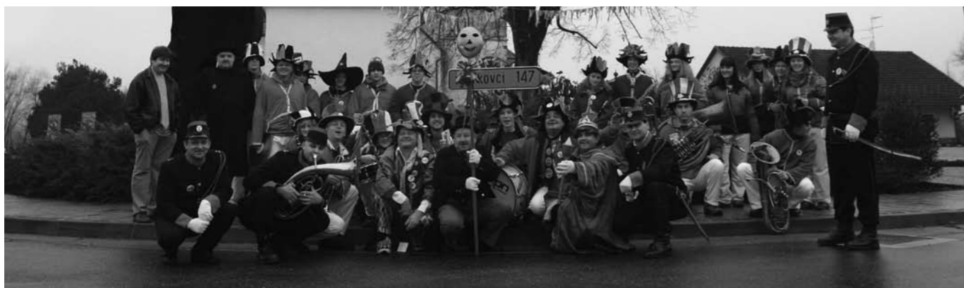
Glavni akterji pred cerkvijo sv. Jakoba.