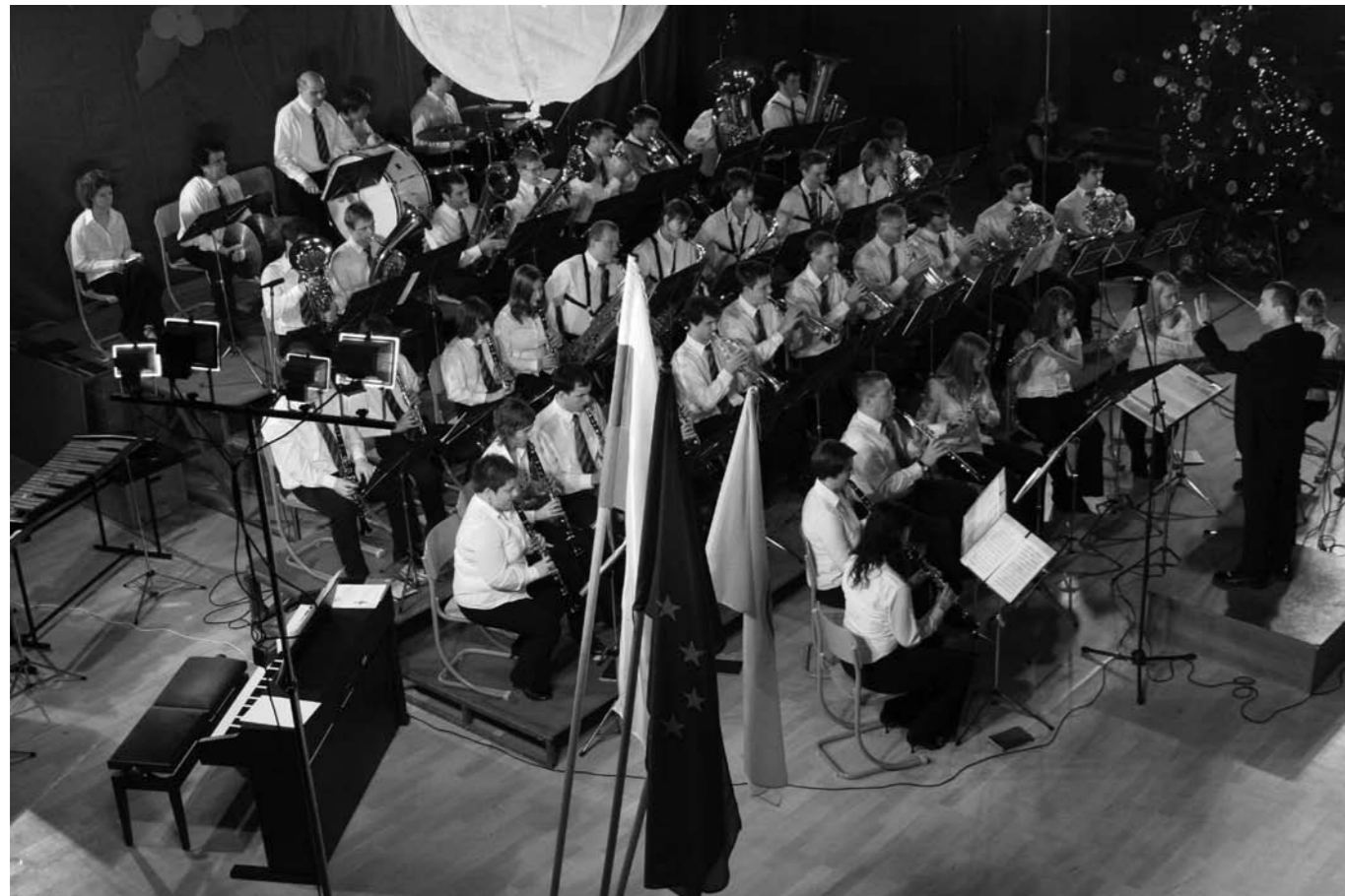
Božično-novoletni koncert 2007.