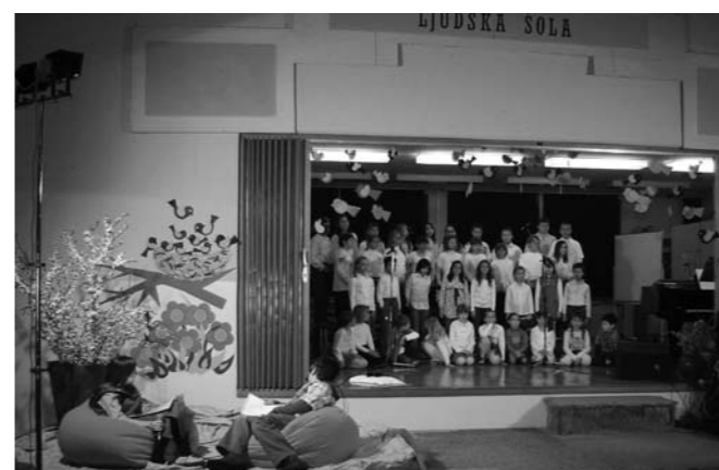
Nastopajoči na osrednji prireditvi ob dnevu žena in materinskem prazniku.