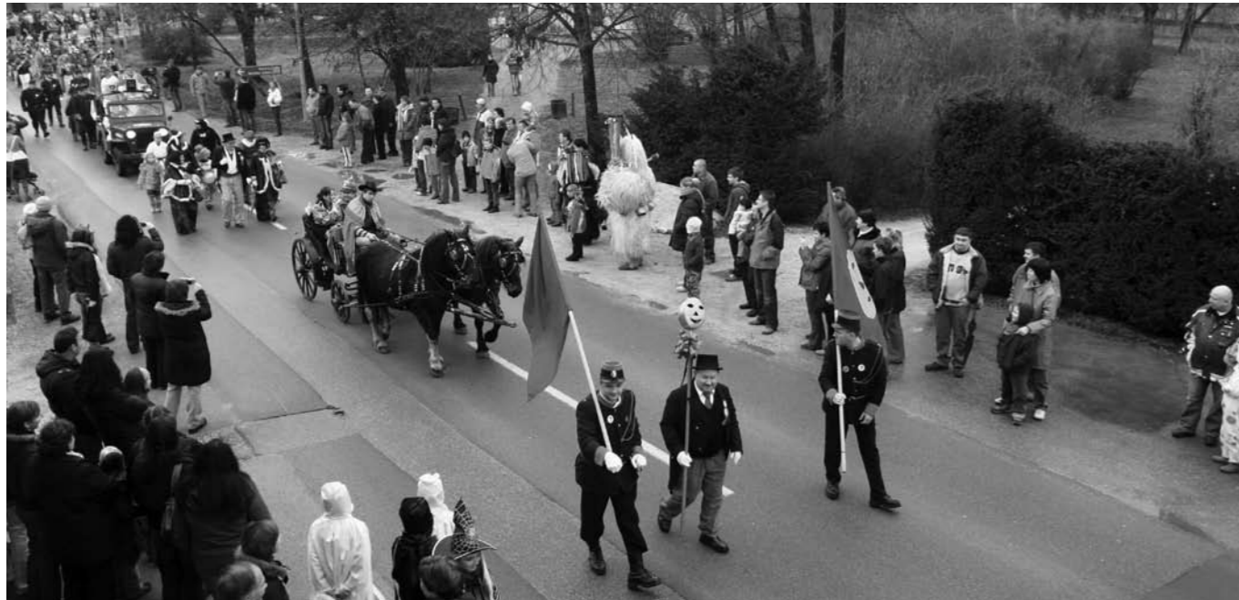
Oklic kurenta.