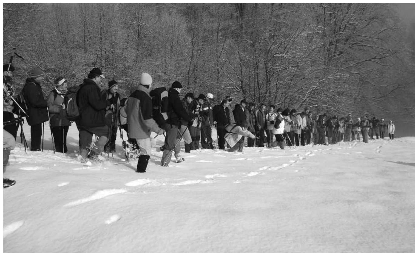
Zasnežena idila.