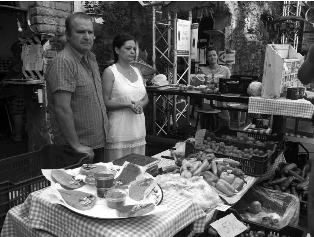
NEDELJKSA TRŽNICA V SZIMPLA KERT | FOTO: JANA MILOVANOVIĆ