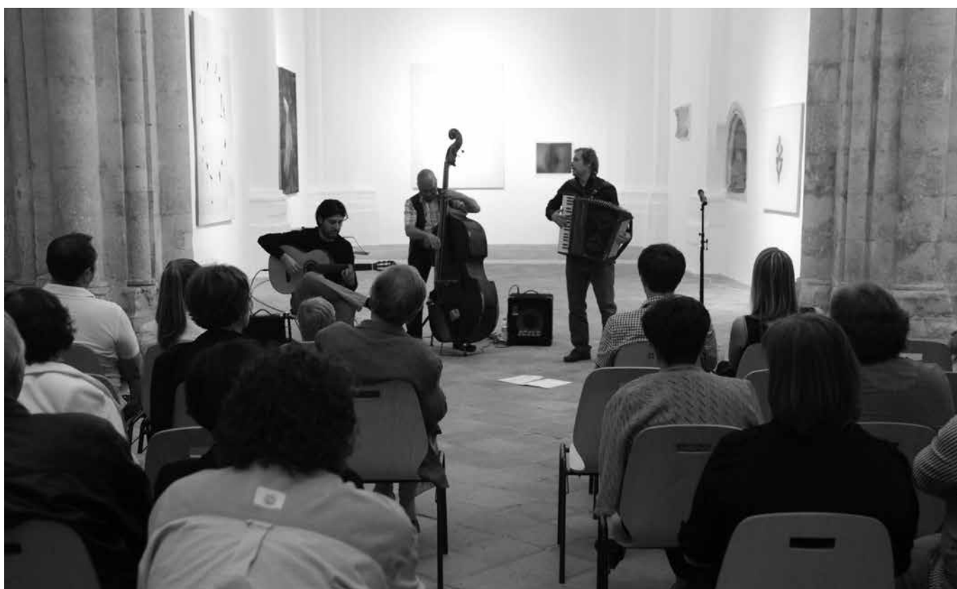
KONCERT SKUPINE TORI TRIO