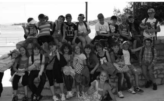
LETNA ŠOLA V NARAVI