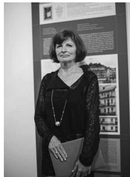
AVTORICA RAZSAVE ŽIVA DEU