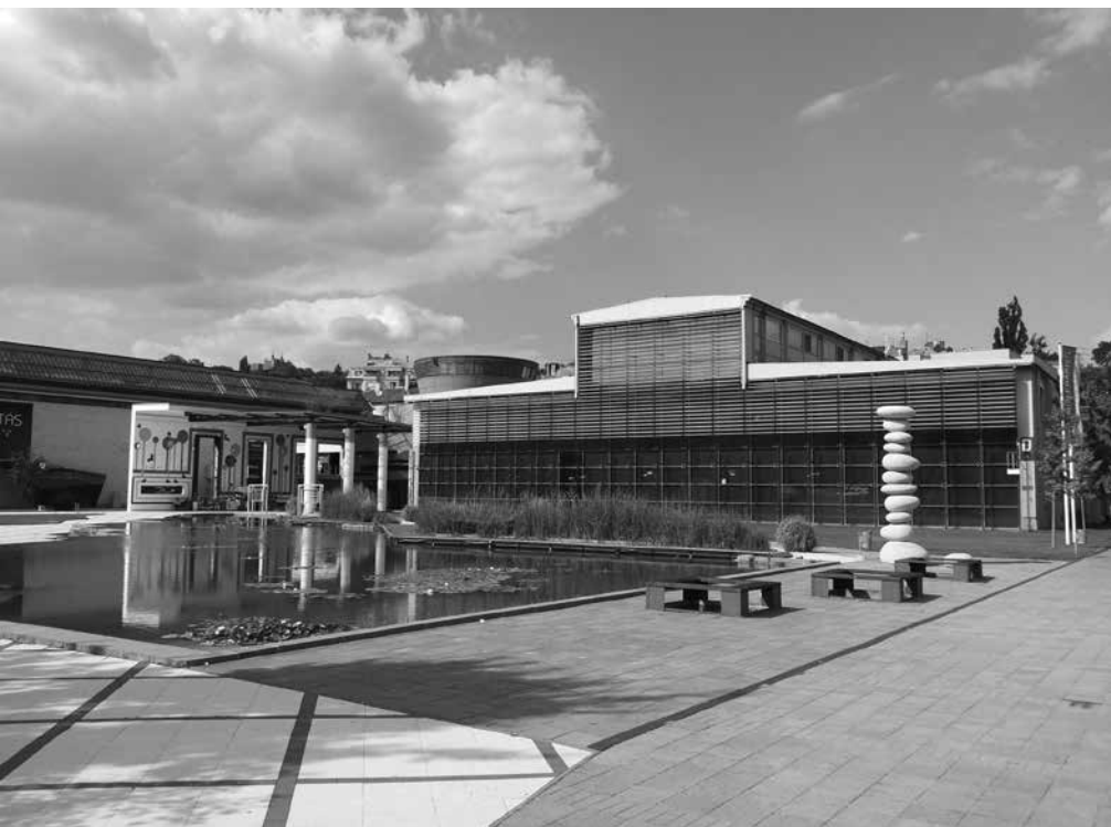
EDEN OD OBJEKTOV KULTURNEGA CENTRA MILENARIS

Čeprav sodi Budimpešta posredno, kot nekdanja prestolnica Ogrske, v venček naših nekdanjih glavnih mest, je v kolektivni zavesti ne nosimo kot eno pomembnejših turističnih destinacij. Razlogov za to je prav gotovo več, eden verjetno tudi ta, da kljub vrhunski turistični ponudbi in relativni bližini (Budimpešta je konec koncev od Kostanjevice na Krki oddaljena le nekaj kilometrov več kot Dunaj, in nekoliko bližja kot Beograd) ne premore tako organizirane turistične infrastrukture na državni ravni, ki bi načrtno utrjevala turistično promocijo v tujini, kot to denimo več kot uspešno počneta sosednji Avstrija, pa tudi Hrvaška (precej Budimpešte je denimo prelepljene z velikanskimi podobami Dubrovnika). Kljub vsemu je Budimpešta, ki danes po neuradnih podatkih šteje preko 2,5 milijona prebivalcev, evropski biser vreden ogleda. Pri Lonely Planetu so jo letos denimo uvrstili med 10 najboljših evropskih popotniških destinacij, kar se vidno pozna tudi pri gneči turistov v mestu. Nekdaj dve ločeni mesti Pešto in Budim povezuje reka Donava, na njenem širšem obrežju pa kar mrgoli stavb izredne arhitekturne dediščine. Oba