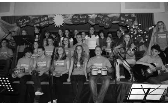
GORJUPOV VEČER