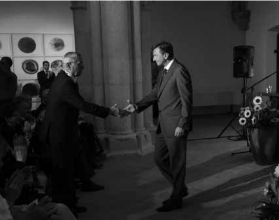
SLAVNOSTNI GOVORNIK JE BIL PREDSEDNIK REPUBLIKE BORUT PAHOR