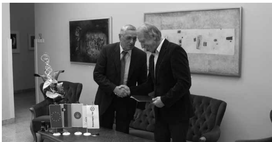
PODPIS POGODBE, VRTEC, 26. 8. 2013

Občina Kostanjevica na Krki je, na pobudo Sveta zavoda Osnovne šole Jožeta Gorjupa Kostanjevica na Krki, že v letu 2011 pristopila k izdelavi projektno gradbene dokumentacije za rekonstrukcijo in prizidek k obstoječemu vrtcu, glede na to, da so se že trije oddelki vrtca nahajali v osnovni šoli, kjer ni bilo zagotovljenih standardov, ki jih določa Pravilnik o normativih in minimalnih tehničnih pogojih za prostor in opremo vrtca ter da je bilo vedno več vlog za prvi vpis v vrtec. V aprilu 2012 je bilo pridobljeno gradbeno dovoljenje. Po pridobitvi gradbenega dovoljenja so stekli nadaljnji postopki za pridobivanje sredstev za sofinanciranje investicije iz Evropskega sklada za regionalni razvoj, kjer smo bili uspešni in uspeli pridobiti 673.712,00 EUR. Ker je predračunska vrednost investicije 1.564.599,28 EUR, bo občina razliko sredstev zagotovila iz 21. člena Zakona o financiranju občin (278.166,00 EUR), 612.721,28 EUR, pa bo krila iz občinskega proračuna. V ponedeljek, 26. 8. 2013, je župan