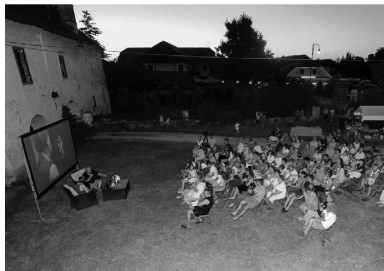
ŽIVELA SVOBODA