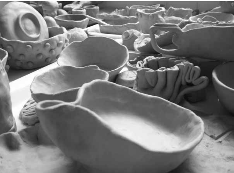
NAŠI IZDELKI