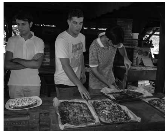
KRUHAPEČKE