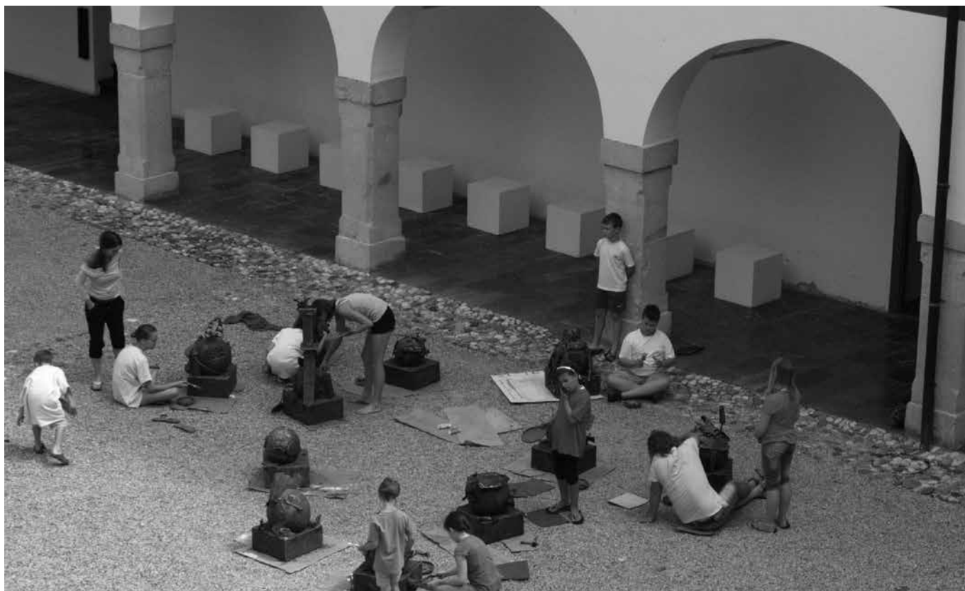
DELAVNICA NA TEMO MOJ SVET

za ohranitev naše identitete. Po dveletnem zatišju je v letošnjem juliju ponovno zaživela Forma viva. Park skulptur je danes bogatejši za tri dela: Ladjo Donalda Buglassa iz Nove Zelandije, Cvetje Liliye Pobornikove iz Bolgarije in QR kodo domačega umetni-