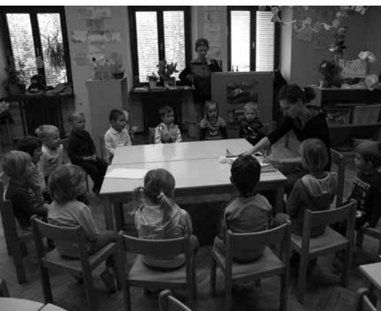
PORAJAJOČA SE PISMENOST