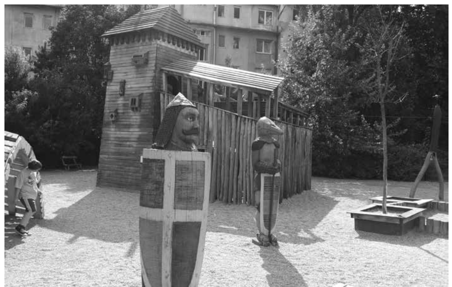
VITEZI, KI ČUVAJO KRALJIČNO

inkubatorska točka 'zelenih' projektov temelječih na sonaravnem razvoju. Zaradi njihovega delovanja se počasi transformira celotno okrožje Erzsébetváros. Eden pomembnejših projektov je prav gotovo poizkus neposrednega povezovanja lokalnih ekoloških proizvajalcev hrane z urbaniimi potrošniki. Tako se vsako nedeljo med 9. in 14. uro prostor alternative prelevi v ekološko zelenjavno tržnico, ki je v vseh pogledih nekaj posebnega. Če se znajdete v Budimpešti v nedeljo, se odpravite tja čim prej in na tešče. Čakal vas bo omamen