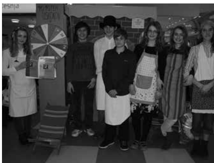
TURIZMU POMAGA LASTNA GLAVA