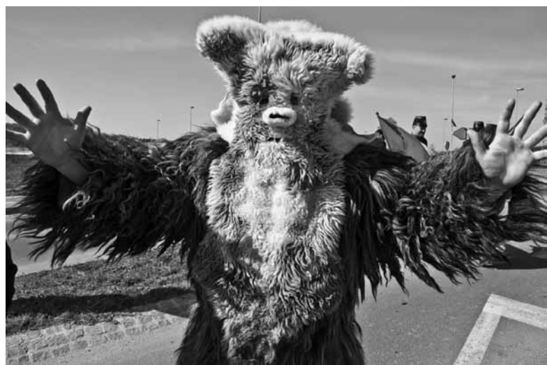
MEDO II.