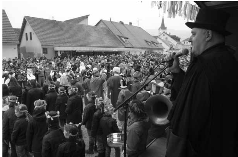
NA TAMALEM PLAC