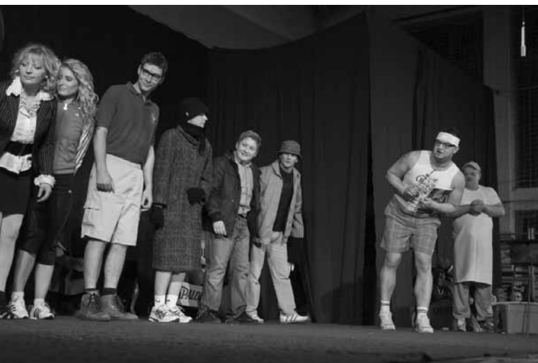
OBČNI ZBOR PRFORCENHAUSA