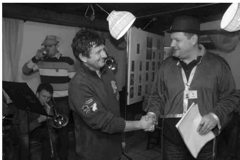
ZMAGOVALEC NA DEGUSTACIJI CVIČKA