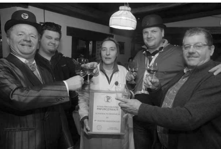
DEGUSTACIJA CVIČKA | FOTO: MATEJ JORDAN