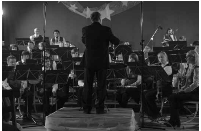
BOŽIČNO NOVOLETNI KONCERT 2010