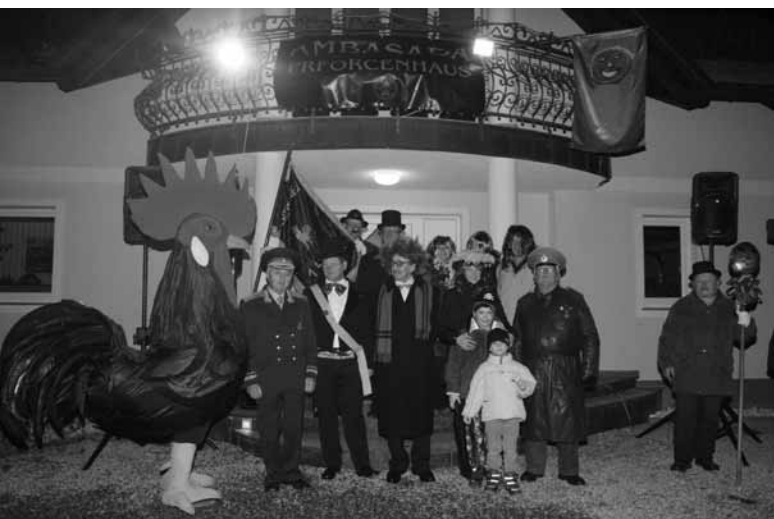
OTVORITEV AMBASADE V ŠENTJERNEJU