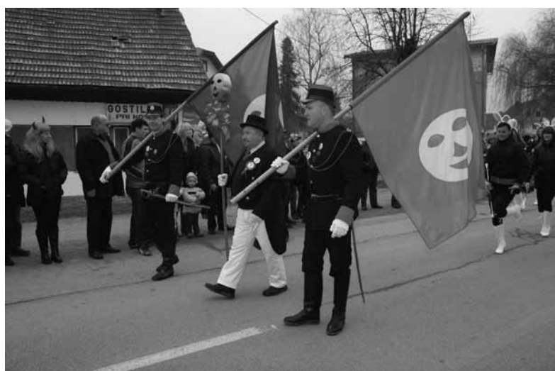
... IN POVORKA SE LAHKO ZAČNE