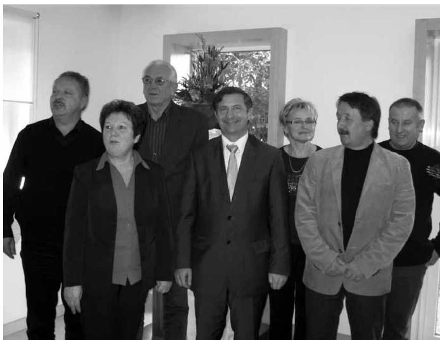
OO DeSUS

Konec novembra so imeli člani in simpatizerji v gostilni Žolnir ustanovno skupščino občinske organizacije DeSUS Kostanjevica na Krki. Organizacija je po zaporednem številu OO DeSUS dvestota. Skupščine so