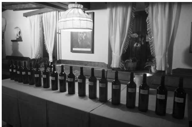
DEGUSTACIJA CVIČKA