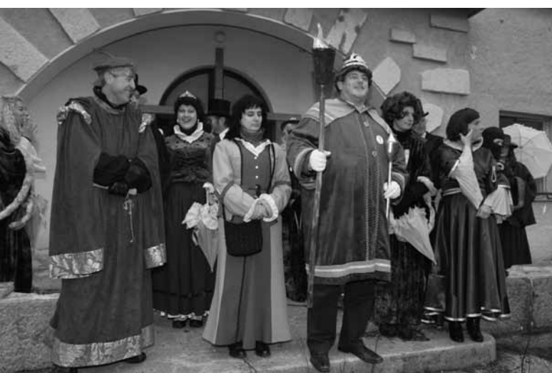
PREDSEDNIK PRIŽIGA OGENJ ...