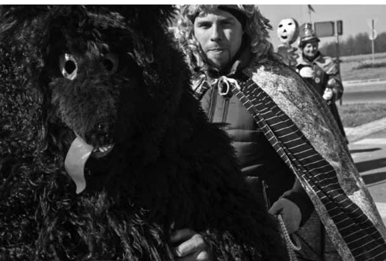
MEDO I.