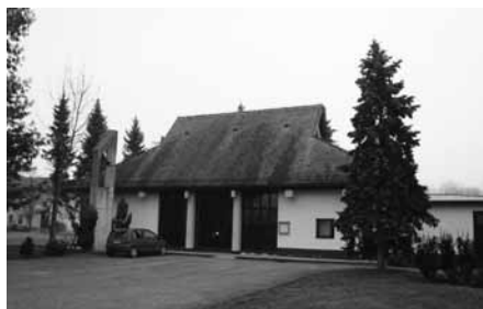
MRLIŠKA VEŽICA - POTREBNA BO OBNOVE