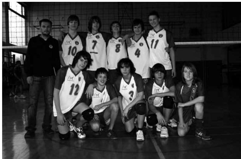
Kadeti – sezona 2008/2009