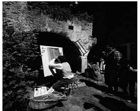
Fasin la mede | Poletni festival povezan s tradicijo košnje in pripravo sena