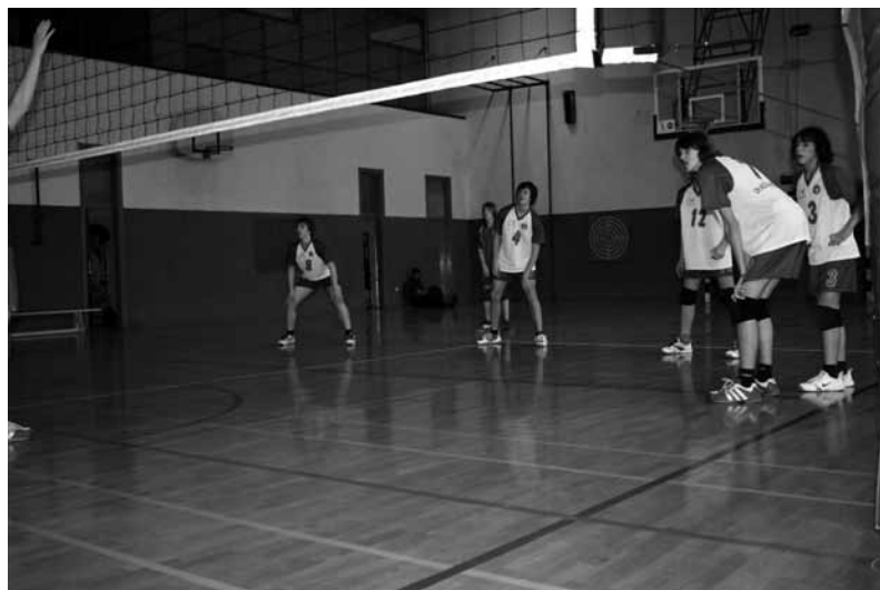
Priprava na sprejem servisa