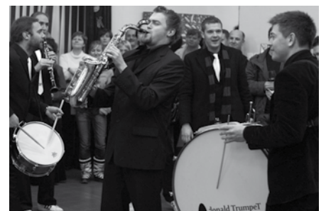
Gostje večera Donald Trumpet

cert leto poprej je tudi ta potekal v telovadnici odnove šole Jožeta Gorjupa, ki so jo godbeniki posebej pripravili prav za koncert. To je bil hkrati tudi prvi božično-novoletni koncert, na katerem ni bilo vstopnine ampak le prostovoljni prispevki. Prav tako so na omenjenem koncertu igrali le člani Pihalnega orkestra Kostanjevica na Krki, katerega število se je povečalo, saj sta k članom pristopila Aljaž Košir in Vid Jordan. Prvič se je zgodilo tudi to, da godbeniki po koncertu niso odšli na večerjo, temveč so v šolski jedilnici ob jedachi in pijači poklepetali s poslušalci, ki so se druženja udeležili. Za 15. obletnico kostanjeviške godbe je domača občina pripravila presenečenje. Povabili so glasbeno zasedbo Donald's Trumpet, ki je s svojo glasbo razživila vse zbrane.