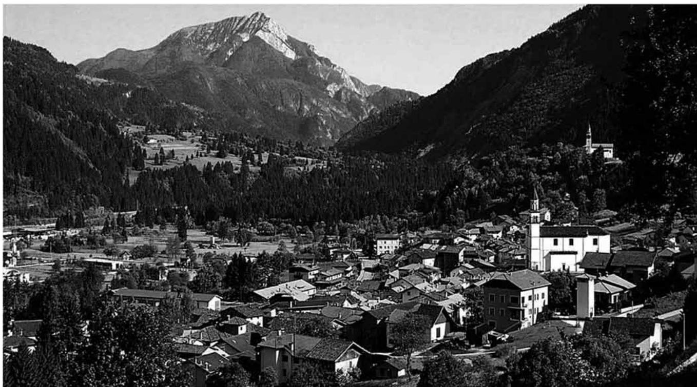
| Izvedba ideje modela razpršenega hotela v Sutriu (Albergo Diffuso)

Na Centru za podjetništvo in turizem Krško, ki nudi informacije in svetovanja tudi občanom, podjetjem in institucijam v občini Kostanjevica na Krki, skupaj z občinsko upravo Občine Kostanjevica na Krki pripravljamo strokovno ekskurzijo v Italijo, z destinacijo Rezija - Pušja vas - Sutrio, in sicer v soboto, 21. marca 2009. Vabimo vas, da se prijavite na Občini Kostanjevica na Krki, predvsem tisti s podjetniškimi idejami po razvoju turizma, v nadaljevanju pa vam predstavljamo nekaj utrinkov z destinacije, ki smo jo že obiskali, predvsem zaradi »modela razpršenega hotela«, ki bi ga bilo možno v neki meri prenesti tudi v naše okolje (npr. ureditev nočitvenih kapacitet v že obstoječih objektih).