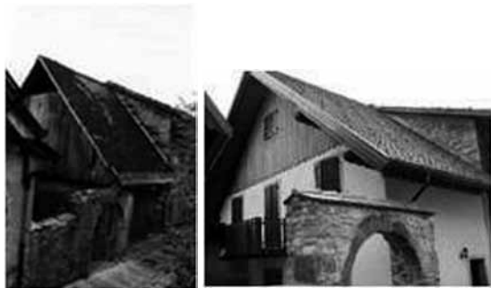
Pogled na stavbo pred in po obnovi

– zadruga »Borgo Soandri«, tako so tudi vsi stroški obratovanja, kot je npr. vzdrževanje, stvar družbe, investicijski del pa je stvar zasebnikov. Letno plačilo za nepremičnino, ki ga prejmejo lastniki stavb in je sicer odvisno od zasedenosti, se giblje med 2-3 tisoč EUR na apartma. Zadruga skrbi, da so objekti kolikor se da enakomerno zasedeni, vaščani pa ustvarjajo prihodek tudi s prodajo proizvodov kmetij tradicionalne obrti.