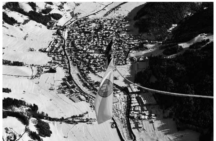
Pogled na zasneženi Innichen

Kmečki turizem na višinskih kmetijah zaradi gora in