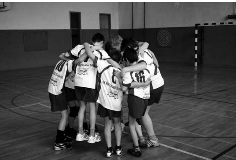
Na zmago

V nadaljnje tekmovanje se uvrstila ekipi Kostanjevica na Krki in Knauf Knauf Insulation.