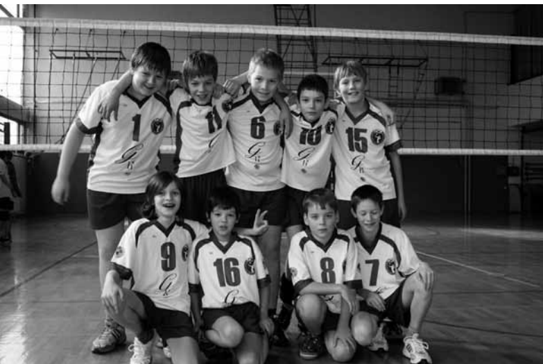
Mlajši dečki – Kostanjevica na Krki