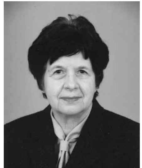
JELKA, 2000

„Nič več ne moti te želja vihar in dvomov črna zmeda in prevar, strasti in sanj neutešeni ples. O molk, o mir, neskaljena tišina! Zdaj zopet ravna duše je gladina ...“