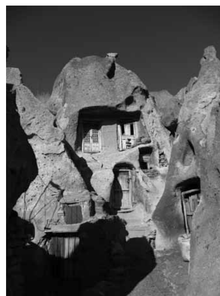
VASICA KANDOVAN PREBUDI SPOMIN NA PRAVLJICE IZ TISOČ IN ENE NOČI

tih vasicah živi kurdsko prebivalstvo, ki se že desetletja bori za avtonomijo. Poselitveno območje Kurdev sega iz Irana še v sosednji Irak, Sirijo, Turčijo in Armenijo. Pot nas je vodila do vasiče Čuplu, kjer smo vaščane zmotili pri dnevni opravi. Po fiziognomiji obrazov in po pisanih oblačilih smo že