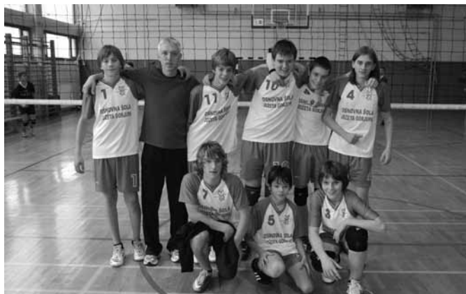
MEDOBČINSKI PRVAKI V ODBOJKI S ŠPORTNIM PEDAGOGOM ERVINOM FELICIJANOM