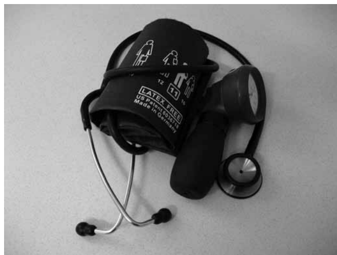
MERILEC KRVNEGA TLAKA

Diastolični krvni tlak pa je izmerjen v fazi mirovanja, počitka srčne mišice, ko je ta „raztegnjena“ in deluje kot črpalka, v katero priteka kri iz telesa.