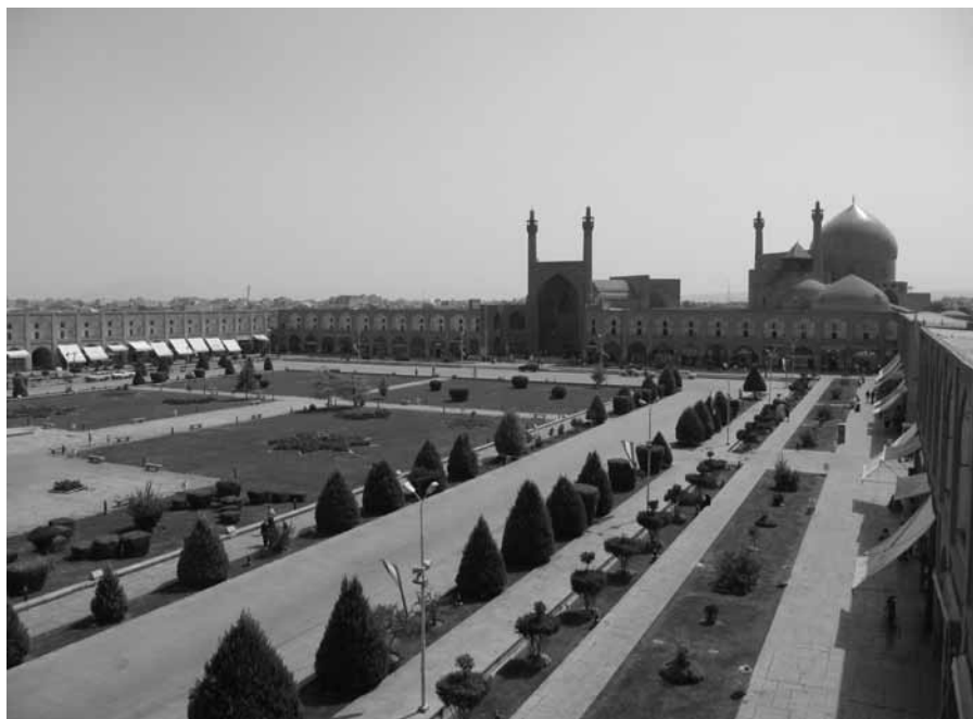
ŠAHOV TRG V ESFAHANU

Umeščen z južnim delom v puščavo, na severu pa na nižja pobočja visokega gorovja Elbrus, je skozi stoletja zrasel v moderno prestolnico z muzeji, molilnicami in s šahovimi palačami, v katerih hranijo predmete neprecenljive vrednosti. Vse bogastvo, ki ga je lahko občudoval in ob njem užival le nekdanji iranski šah Reza Pahlavi, je danes podržavljeno, vse zbirke so odprte za javnost. Glavno mesto islamske republike Iran, ki danes šteje od 9 do 14 milijonov prebivalcev (s predmestji ali brez), je eno najgosteje naseljenih območij sveta in med svetovnimi mesti