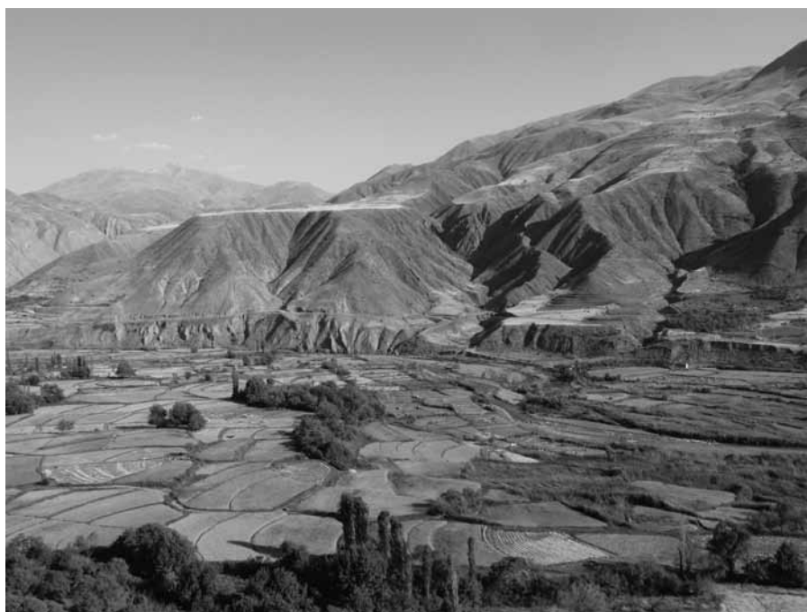
POGLED NA RIŽEVA POLJA IN GOROVJE ZAGROS V OZADJU

Stare države Elama, Perzije in Medije so v 7. stoletju zavzeli Arabci in jih islamizirali. Proti koncu srednjega veka so po deželi pustošili in ji vladali Mongoli. Od začetka 16. stoletja do sredine 18. stoletja je bila na oblasti dinastija Sefvidov, proti koncu 18. stoletja je prestol zasedla turkmenska dinastija