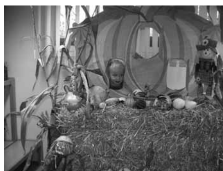
PRAZNOVANJE JESENI

V novembru smo Jurčki obiskali Valvasorjevo knjižnico, kjer sta nas pričakali prijazni knjižničarki. Skupaj smo si ogledali knjižnico, se pogovorili o kulturi vedenja v njej ter ravnanju s knjigo. Poslušali smo poučno pravljico in prelistali slikanice ter si ogledali risanko o Frančku v knjižnici. Bilo je nadvse prijetno.