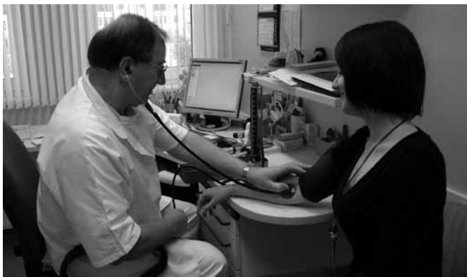
MERJENJE KRVNEGA TLAKA