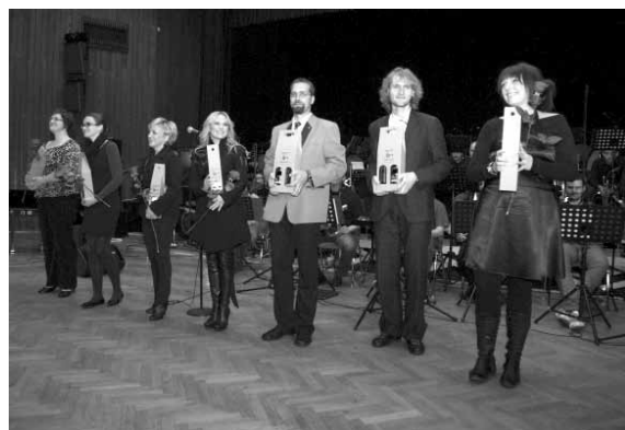
DOBRODELNI KONCERT