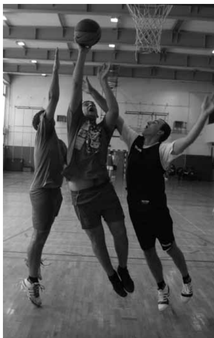
TURNIR TROJK

V soboto, 4. 12., smo v športni dvorani OŠ Kostanjevica izvedli Turnir trojk v košarki. Turnirja se je udeležilo sedem ekip; tri iz Kostanjevice, po