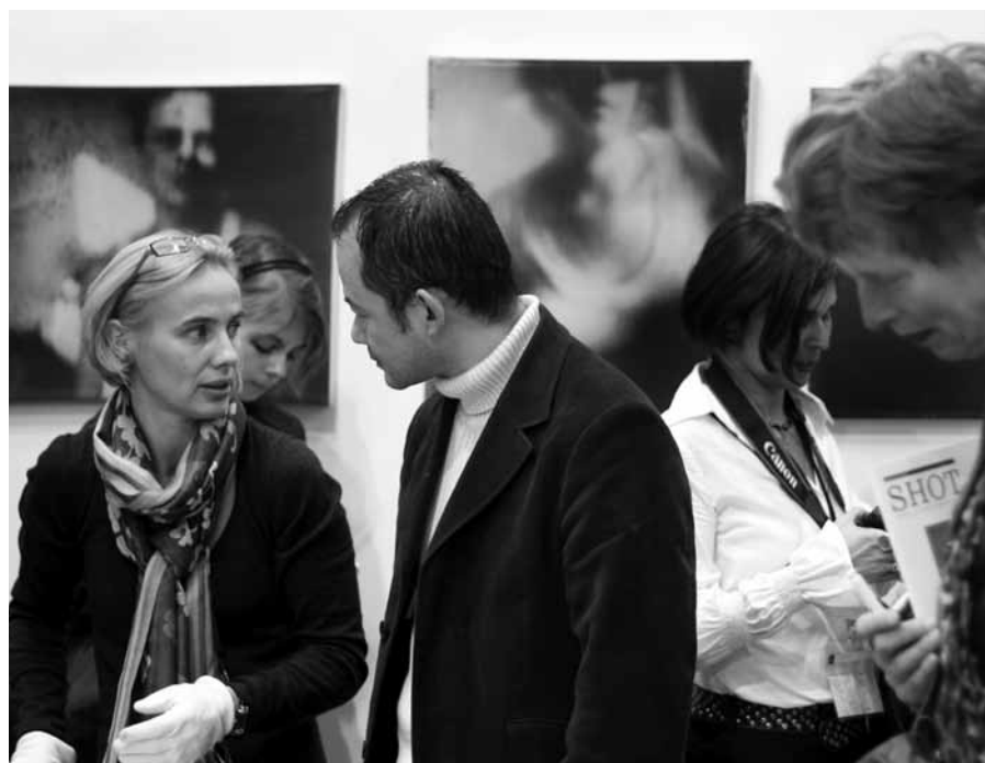
UTRINEK Z RAZSTAVE