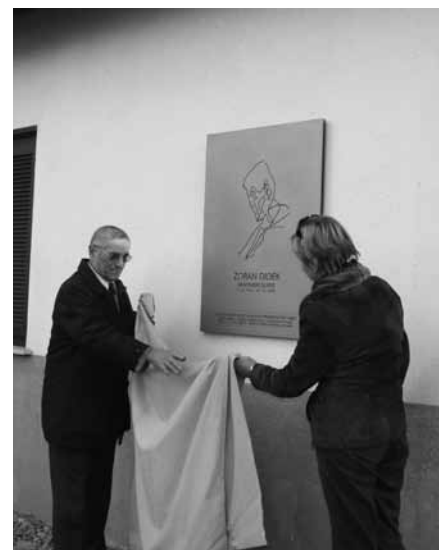
ODKRITJE OBELEŽJA NA DIDKOVHI HIŠI