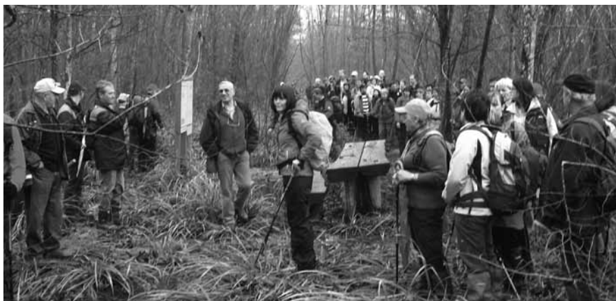
ČEBULARSKI POHOD

V nedeljo, 21. 11. 2010, je bil organiziran tradicionalni planinski pohod na Rako. Včasih so kmečke žene hodile prodajat čebulo na trg v Kostanjevico. Raška rdeča čebula je bila priznana daleč naokoli, še danes je rdeča čebula nekaj posebnega, na Raki pa ozimnica vsakega gospodinjstva. Zamisel za sam pohod je dal naš vodnik Franc Bakšič iz Cirja pri Raki. Danes ta steza ni več vidna, pa vendar vsako leto novembra PD Polom načrtuje pohod po neoznačeni poti čez Krakovski gozd na Rako. V letošnjem letu smo organizirali pohod skupaj z vinogradniškim in turističnim društvom z Rake.