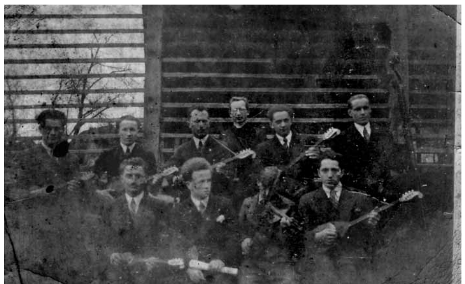
KOSTANJEVIŠKI TAMBURAŠKI ORKESTER 1935