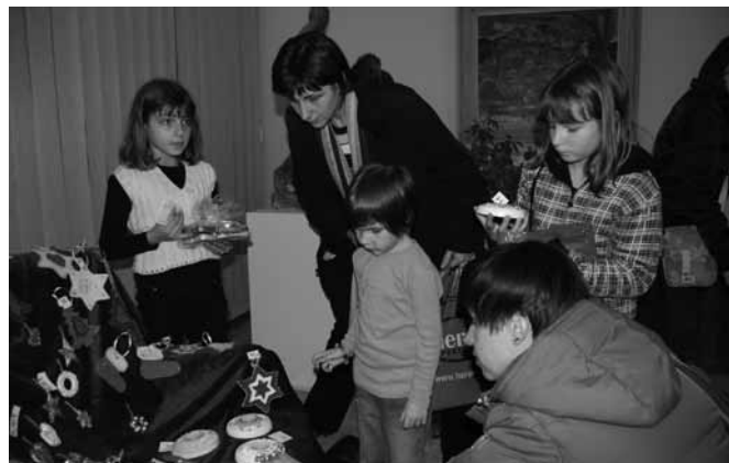
UTRINEK Z DOBRODELNEGA PRAZNIČNEGA SEJMA