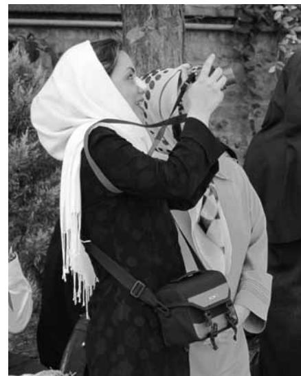
Z OBLIŽEM ZALEPLJENI NOS MODERNE IRANKE