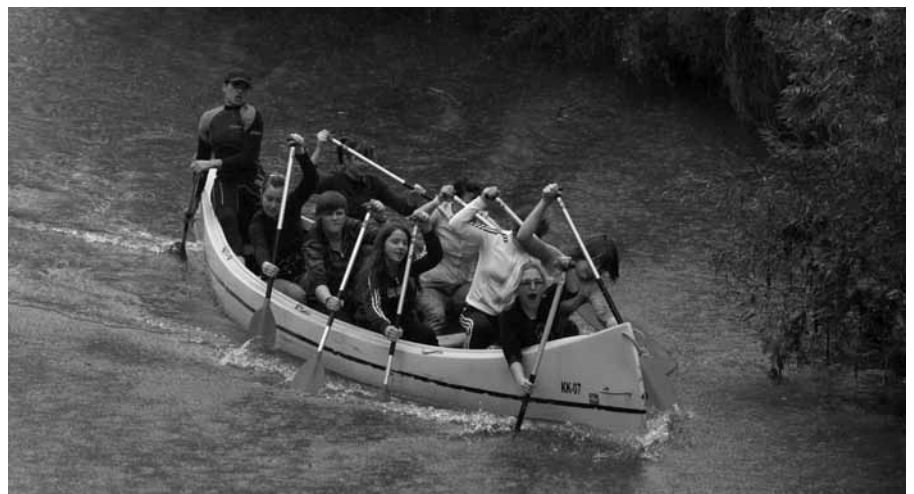
ŽENSKA EKIPA CELINA

Tradicionalna prireditev se je pričela na starem kostanjeviškem kopališču, kjer so se okoli ene ure zbrale veslaške ekipe. Reka Krka je bila glede na povprečni vodostaj letošnje jeseni tokrat precej nizka in umirjena, zato se je bilo za dober čas treba bolj potruditi. S prvim štartom, ob dveh popoldne, se je skupno v šestih ekipah pomerilo okoli petdeset veslačev in veslačic. V ženski konkurenci sta nastopili rivalski ekipi OTOK in CELINA, kjer je bila zadnje- navedena ekipa (čas 9:42) že drugo leto zapored boljša. V moški konkurenci so s štartnega mesta odveslale štiri ekipe: predstavniki ekip OTOK in OREHOVEC ter mladi v ekipah TABALUGA TEAM in TRAMPAMPULE. Vse štiri ekipe so v cilj priveslale z medsebojno razliko, manjšo od dvajsetih sekund, kar priča o napetem boju na vodi. Najboljši čas (8:24) si je s složnimi zaveslaji prikrmarila ekipa TRAMPAMPULE. Nedeljsko dogajanje se je okoli štirih z Otoka preselilo na Tamal plac, kjer so se tekmovalci in obiskovalci lahko nadjeli, kaj popili, se posladkali in kupili