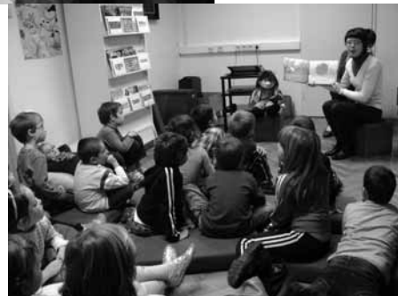
V KNJIŽNICI