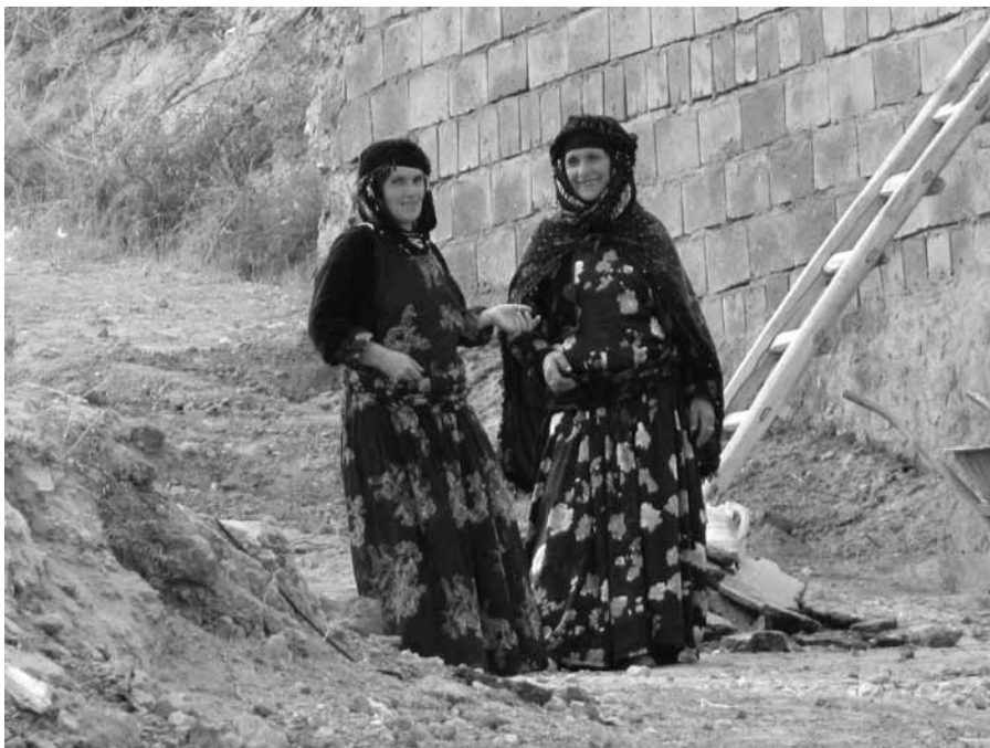
KURDINJI | FOTO: TAMARA ZAKŠEK

od daleč videli, da se prebivalci precej razlikujejo od Perzijcev. Zanimivo je, da Kurdinje ne nosijo tančice čez obraz, dovoljeno jim je tudi druženje ter ples z moškimi ob kurdskih praznikih, porokah in drugih družabnih srečanjih, kar je bolj podobno kulturi Vzhodne Evrope kot Bližnjega vzhoda. Kurdi, ki živijo v manj razvitih delih Irana, so za oblast v državi resen notranji problem, saj v zahtevah po avtonomiji večkrat uporabijo tudi orožje. Med našim potovanjem po Iranu je ob praznovanju 40. obletnice iraško-iranske vojne na severozahodu države ob jezeru Orumiyeh eksplodirala bomba, ki so jo aktivirali prav oni.