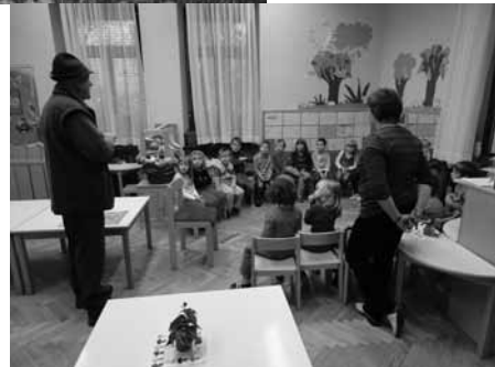
LOVEC NA OBISKU