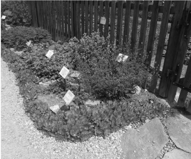
Detajl samostanskega vrta, Foto: Vesna Zakonjšek