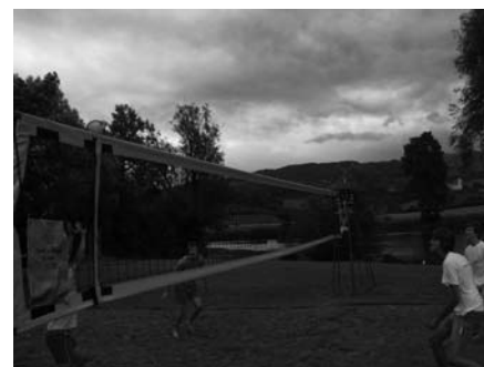
črni oblaki nad turnirjem v odbojki

14. septembra ob 10. uri bo potekala prireditve 24. Tek ob Krki. Za tiste,