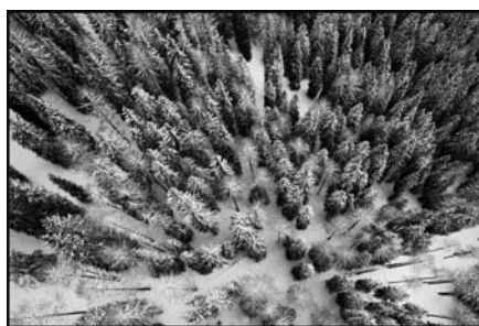
Zima