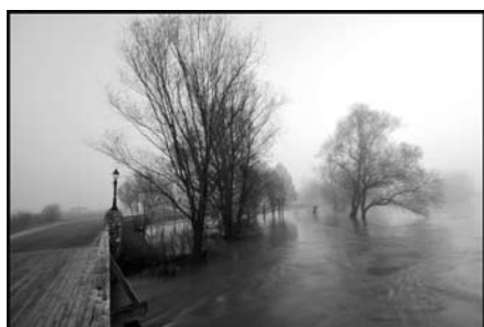
Jesen