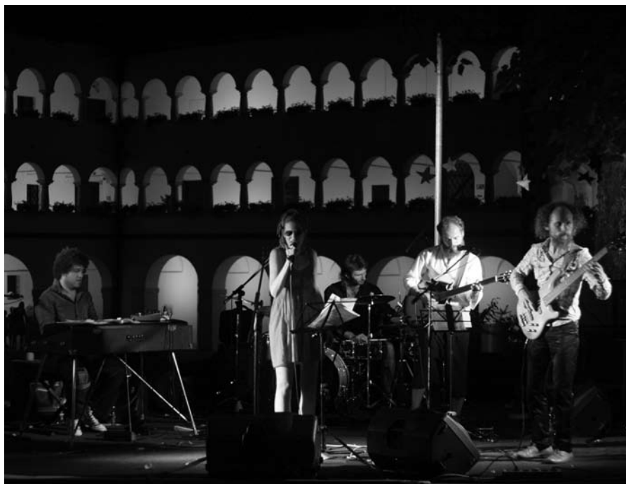
Noster nostri 2009 – uvodni koncert, foto: Matej Jordan