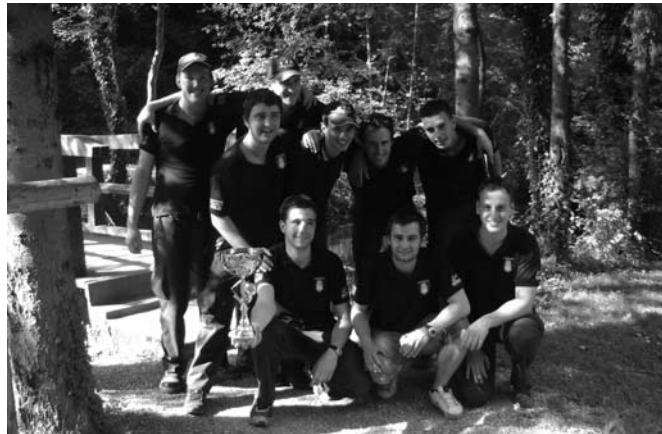
Člani A, foto: arhiv PGD

Ena pomembnejših nalog gasilskega društva je tudi izobraže-