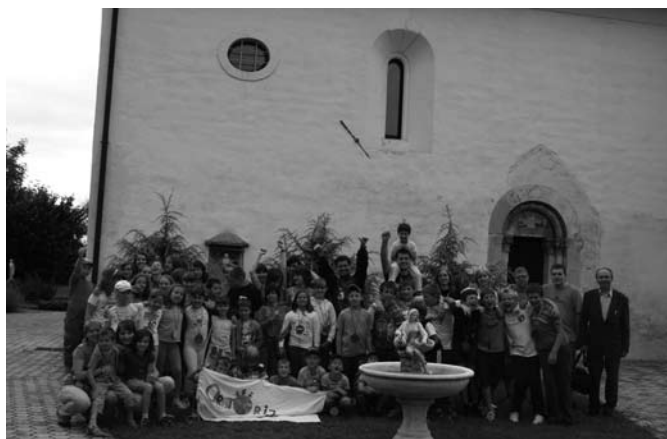
Udeleženci oratorija 2009, fotoarhiv župnije Kostanjevica

Počitnice so veliko hrepenenje osnovnošolcev, pa vendar se zgodi, da se otroci v dveh mesecih počitnic tudi dolgočasijo, nekateri so celo prepuščeni ulici in slabi družbi v soseski. Starši so v službah, mnogi si več ne morejo privoščiti dolgih in dragih dopustov na morju ali v tujini.