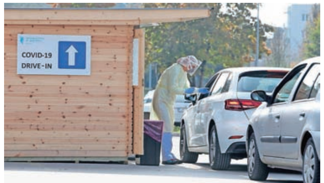
V zadnjih dneh se povečuje tudi število odvzetih PCR-brisov.