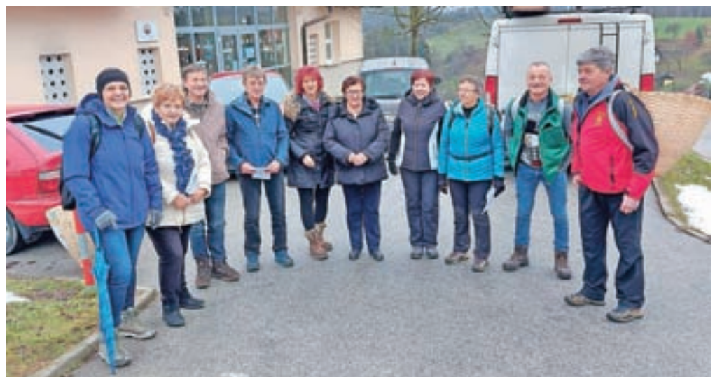
Člani društva, ki so Tunjški glas dostavili na domove krajanov

Eden pomembnejših dogodkov v Tunjicah je bilo praznovanje tristote obletnice rojstva Petra Glavarja, ki je s cerkvijo sv. Ane tudi v Tunjicah pustil pomemben pečat, bralci pa si lahko preberejo prispevke o zgodovini Tunjic, tunjških domačinah in o drugih zanimivostih in dogodkih v minulemu letu. Novost je rubrika, namenjena mladim, v kateri se tokrat predstavljata mlada nogometašica in smučarski skakalec. "Na ta način želimo več prostora nameniti mladim, bodisi da jih spodbudi-