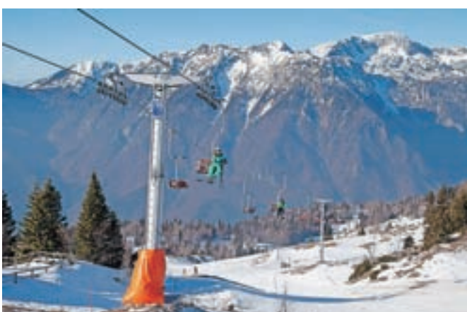
Smučanje na Veliki planini ponuja tudi izjemne razglede.

17. uri in poteka po 2,4 kilometra dolgi osvetljeni prog. Zaradi omejitve oseb na sankališču je sicer za sanjanje potrebna predhodna prijava. V času nočnega sankanja nihalka vozi ob 17. in 18. uri (gor) in 20. ter 21. uri (dol). Možna je tudi izposoja sani. Aktualne informacije o delovanju smučišča in obratovanju naprav pa velja preveriti na spletni strani družbe Velika planina. Nihalka sicer v času obratovanja smučišča vozi vsake pol ure od 8. do 17. ure, ob petkih pa do 18. ure. Sedežnica obratuje od 8.30 do 16.15, razen ob petkih do 17.15, smučišče pa je odprto med 8.30 in 15.30. Smučišče ponuja 3,5 kilometra prog, od katerih večina sodi med srednje zahtevne, vlečnica Jurček pa je namenjena otrokom in smučarjem začetnikom.