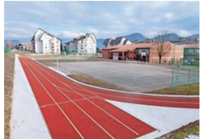
Pogled na prenovljeno atletske stezo ob Osnovni šoli Marije Vere na Duplici

čje občasno uporabljajo tudi otroci iz sosednjega vrtca Antona Medveda. "Celotno območje športnega parka ob šoli je sicer od-