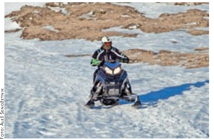
Rekreativna vožnja z motornimi sanmi v naravnem okolju Velike planine ni dovoljena. Fotografija je simbolična.

je sodeloval tudi policijski helikopter. Po obeh zakonih so ugotovili kršitve. Vožnja z motornimi sanmi, nad katero se pritožujejo pohodniki in lastniki koč na planini, prepoveduje tudi odlok o javnem redu na območju Velike planine. Vožnja z motornimi sanmi je namreč dovoljena le za potrebe oskrbovanja objektov po predhodni pridobitvi ustreznega dovoljenja in za nekatere druge izjeme.