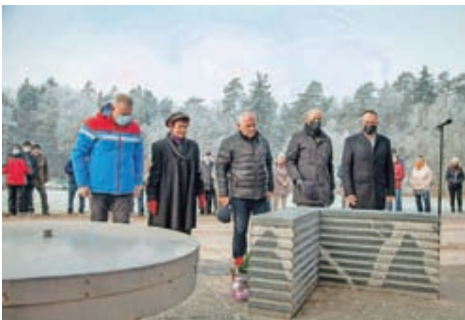
Delegacija se je padlim poklonila s polaganjem venca.