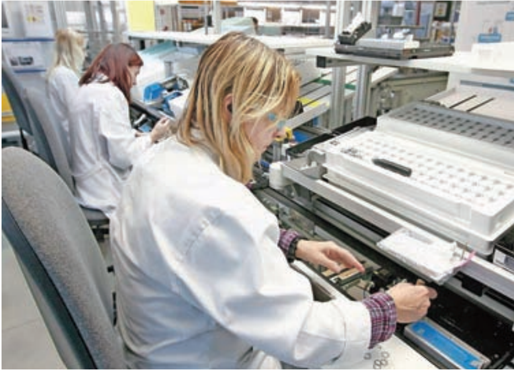
Veliko zanimanja je še vedno za delavce v proizvodnji oz. za enostavna dela. Fotografija je simbolična.

"Glede na leto 2020 je bilo za skoraj polovico večje in je celo za 20 odstotkov presešlo tudi povpraševanje v letu pred epidemijo," pravi sogovornica, ki dodaja, da so podjetja največ iskala proizvodne delavce in druge delavce za enostavna dela. Povpraševanje je bilo tudi po delavcih v gradbeništvu, v elektro, kovinski in avtomobilski industriji, voznikih, precej se je zaposlovalo v trgovini, ves čas je bilo veliko tudi povpraševanja po kadru za delo v šolstvu, zdravstvu, negi in oskrbi. "Največ potreb po kadru so sicer prijavile različne zaposlitvene agencije (Adecco, Naton, Manpower, Workforce), Ko-