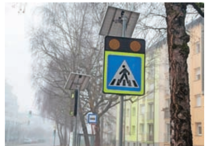
Opozorilne table na Ljubljanski cesti

Kamnik – Svet za preventivo in vzgojo v cestnem prometu Občine Kamnik je v sodelovanju z Občino Kamnik na Ljubljanski cesti namestil nove opozorilne table na prehodih za pešce. Opozorilne table s svetlobnimi elementi opozarjajo na hitrost vozila, ki se bliža prehodu za pešce. A. Se.