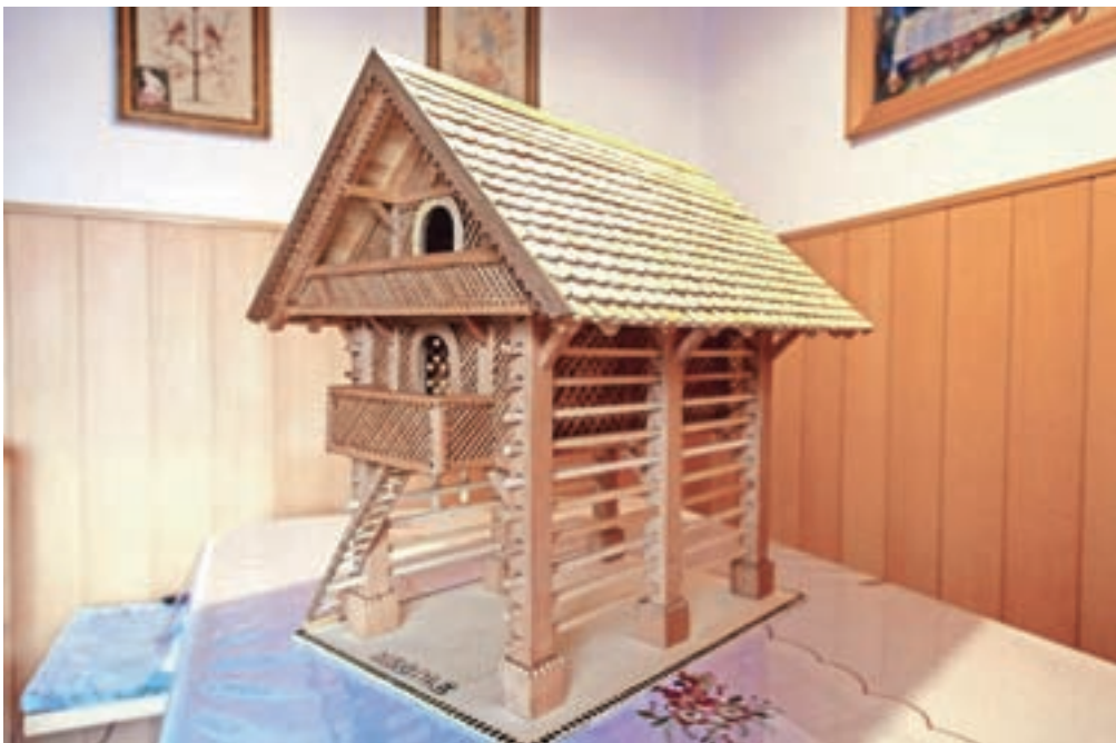
Natančno izdelana maketa topolarja bo mesto dobila v domači hiši.

Sicer ne ve natančno, iz koliko kosov je izdelana maketa, zgolj ena stran strehe je sestavljena iz približno petsto malih skodel. Zaradi velikega števila delov majhne velikosti pa je tudi izdelovanje vzelo kakšne tri