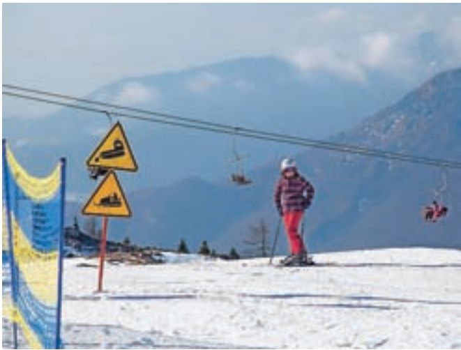
Smučarjem je na voljo 3,5 kilometra prog.

Že nekaj let na Veliki planini zagotavljajo tudi nočno sankanje. "Nočno sankanje je iz leta v leto bolj priljubljena aktivnost, zato imamo skoraj vsak petek in soboto vsa mesta povsem zasedena," še pojasnjujejo na Veliki planini in dodajajo, da bo sankališče odprto še naprej vsak petek in soboto. Nočno sankanje se začne ob