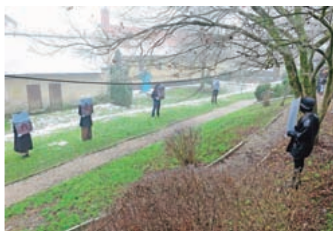
V Parku Evropa je bilo uro in pol na ogled devet fotografij.