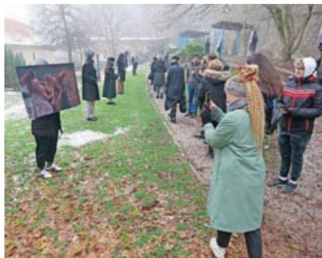
Obiskovalci so se z zanimanjem sprehodili po živi galeriji.