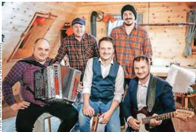
Modrijani so ob desetem rojstnem dnevu pesmi Ti, moja rožica občinstvu predstavili njen remiks, potem pa na Veliki planini posneli videospot.

Za Ti, moja rožica 2022 je nastal tudi že videospot, ki je svojo premiero doživel lani decembra. Odziv na zimsko vizualno podobo pesmi na spletu je zelo dober, v priredbi pa bo pesem zaživela, ko se bodo znova začele zabave in veselice, dodaja Švab. Namreč videospot za novo Ti, moja rožica je nastal na Veliki planini, režiral pa ga je Jani Pavc. Švab pojasni: »Jani obožuje te planine in sneg. On najlepše ujame to vzdušje. In Občina Kamnik nam je zelo pomagala, da smo lahko posneli