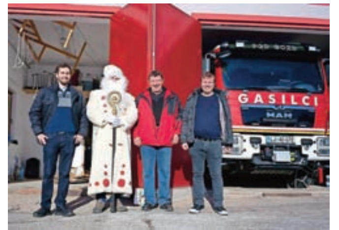
Predstavniki KS Črna ob obisku Dedka Mraza

Otroci so se tudi letos razveselili obiska Dedka Mraza.