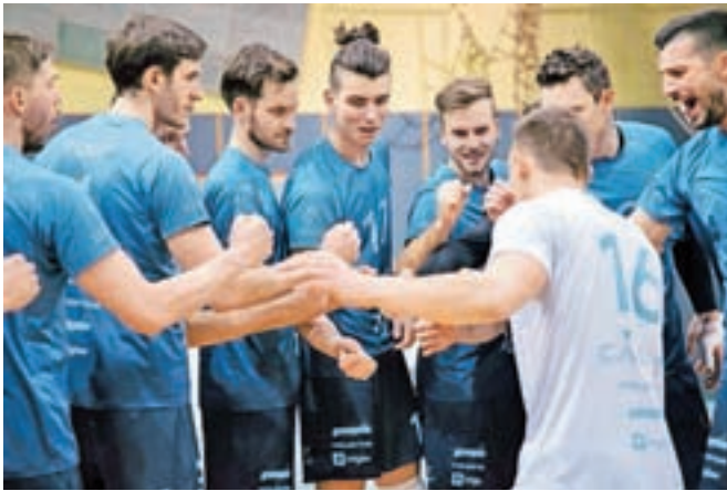
Kamniški odbojkarji so leto začeli uspešno.

"Po osvojenih pokalnih lovoriki smo igralkam namenili nekaj več odmora, ki je prišel ob pravem trenutku. Rešili smo se nekaterih mikro poškodb, predvsem pa so se igralke tudi psihično odpočile od vsega skupaj. S tem nekaj daljšim premorom so pridobile nov elan, novo voljo za delo, kar se je poznalo že na prvih treningih po novem letu. Žal pa se tudi mi nismo mogli ogniti karanteni, tako da je v tem trenutku težko reči, kakšne bodo posledice, saj smo bili ravno v fazi, ko smo več pozornosti namenili telesni pripravlje-