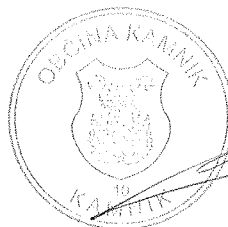
Matej Slapar ŽUPAN

Priloga 1: Pregled za 2015-2018 – DNR 2015-2022 – tabela odsekov poškodovanih cest