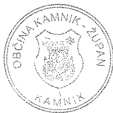
Marjan Šarec ŽUPAN

Oddaja pripomb in predlogov je mogoča najkasneje do 7. 12. 2016 do 16. ure na naslov obcina@kamnik.si ali Občina Kamnik, Glavni trg 24, 1240 Kamnik, s pripisom »pripomba na predlog Odloka o proračunu Občine Kamnik za leto 2018«.