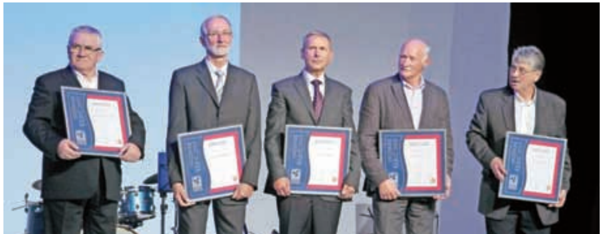
Prejemniki srebrnih ključev OZS