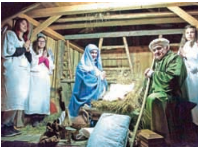
Božično vzdušje so v Tuhinjski dolini z živimi jaslicami, hlevčkom, svetimi tremi kralji, angelom in drugimi božičnimi elementi pričarali že v nedeljo.

Člani Turističnega društva Tuhinjska dolina so v nedeljo v Bizjakovih dolinah v Snoviku znova – že desetič – pripravili žive jaslice in tako številnim obiskovalcem že pričarali božično vzdušje.