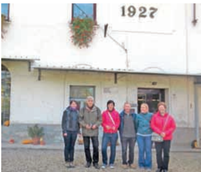
Lokalni turistični vodniki pred elektrarno na Bakovniku