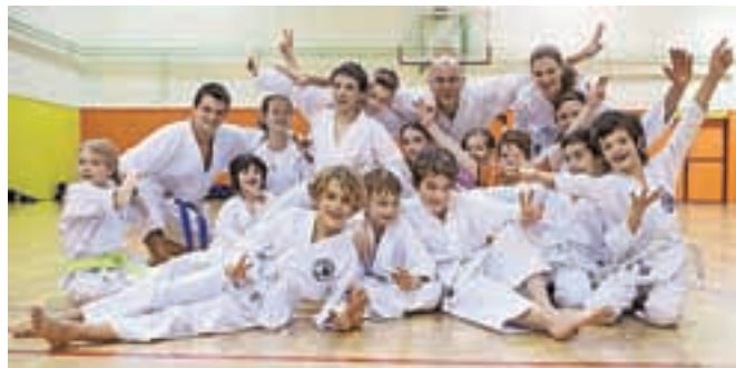
Člani Karate kluba Virtus Duplica na tekmovanjih dosegajo odlične rezultate.

te japonske borilne veščine pove Stanič. Med uspehe kluba sodi tudi to, da je za karate navdušil dekleta. Včasih so bili karateisti večinoma moški. Da so v tem športu odlične tudi ženske, pričajo uspehi Motnikarjeve ter nekaterih tekmovalk iz preteklih let. Za učenje karateja se ne odločajo zgolj mladi, čeprav je teh v klubu največ. V Virtusu so ponosni na svojo veteransko sekcijo. »Imamo štirinajst veteranov, med njimi tri ženske. Najstarejši šteje 64 let, s treningi pa je začel pred štirimi leti. Tudi to je dokaz, da za karate ni nikoli prepozno,« pove Stanič. Starost torej ni razlog, da se ne bi pridružili treningom, ki jih imajo vsak ponedeljek in četrtek zvečer v telovadnici GSŠRM, in odkrili lepote tega športa.