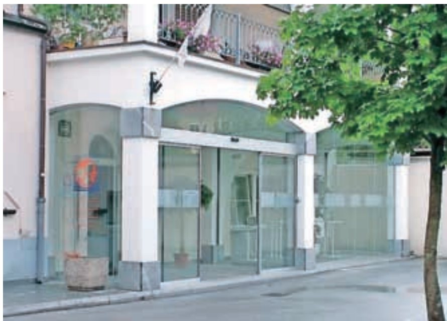
Prostori na Tomšičevi ulici, kjer Območna obrtno-podjetniška zbornica Kamnik deluje danes.

Mreža strokovnih svetovalcev poskrbi za pravi nasvet ob pravem času, po potrebi pa pripravi tudi strokovna mnenja, obrazložitve, pogodbe in drugo potrebno dokumentacijo.