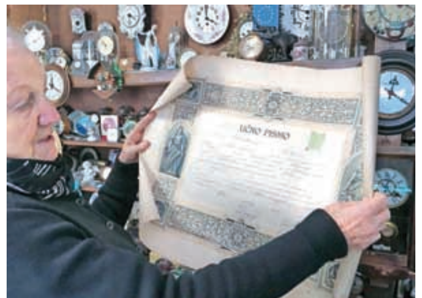
Na željo očeta sem naredila tudi mojstrski izpit.

da sem jim kaj popravljala,« se zasmehi in za konec pove, da sta jo pred časom našla dva tujca, ki sta