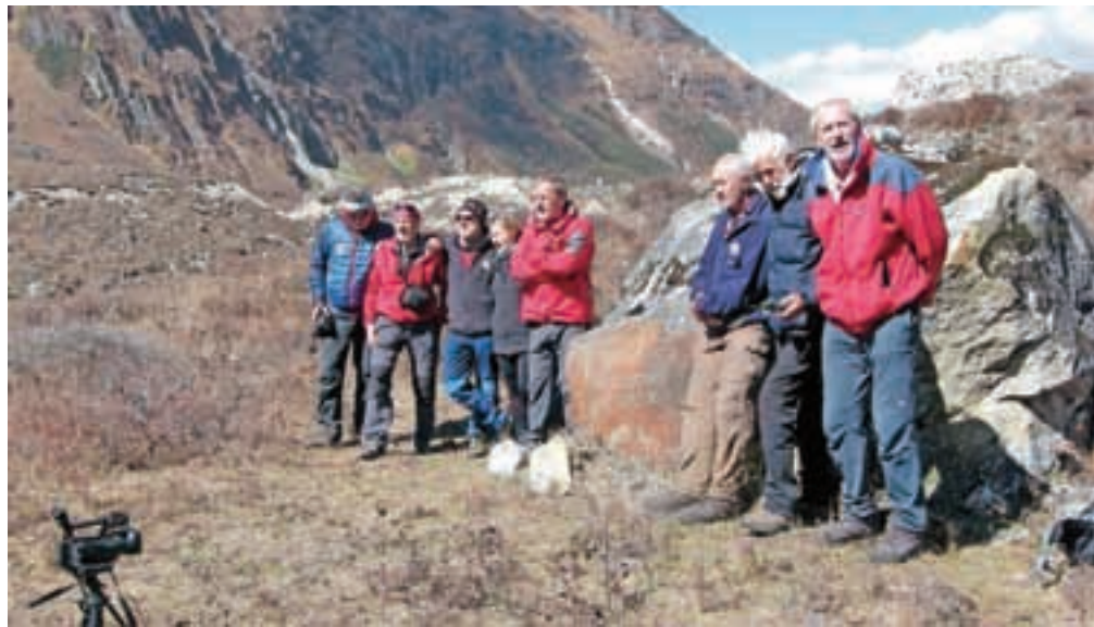
Ob spomeniku pokojnima Anteju Bučanu in Nejcu Zaplotniku / FOTO: IGOR TEKAVČIČ

Naslednji dan smo šli že pred 6. uro na rob leve morene in nato po njej malo nad jezerom Dona skoraj tri