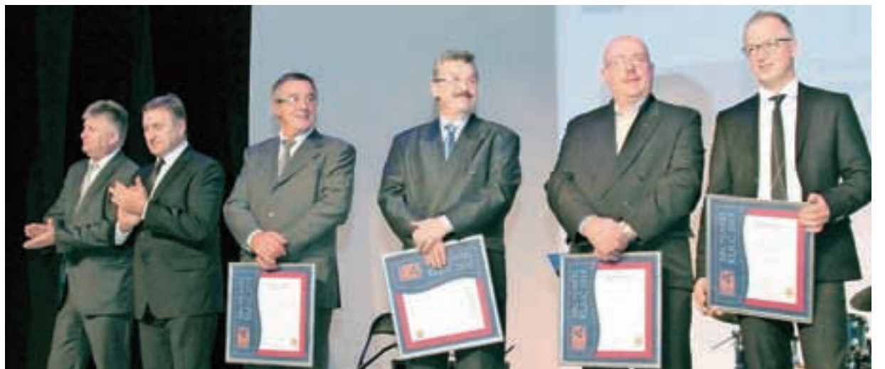
Prejemniki bronastih ključev OZS