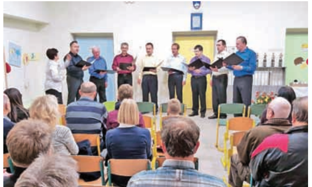
Pevci Tunjiškega okteta so letos praznovali trideset let delovanja.