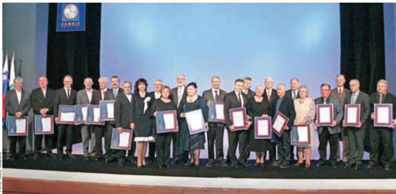
Vodstvo Območne obrtno-podjetniške zbornice Kamnik z dobitniki prestižnih priznanj ob svoji štiridesetletnici

Območna obrtno-podjetniška zbornica Kamnik letos praznuje štiridesetletnico združevanja obrtnikov in podjetnikov v lokalnem okolju. Ob jubileju so pripravili slavnostno akademijo, na kateri so počastili nagrajence, se ozrli v zgodovino ter opozorili na težave in priložnosti obrti in podjetništva danes.