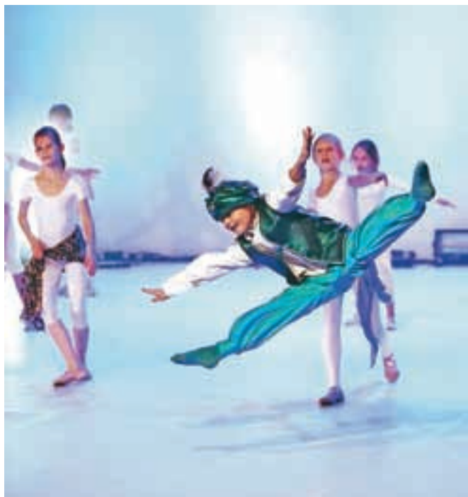
Plesalci Plesnega kluba Šinšin so v nedeljo, 20. decembra, v Domu kulture Kamnik pripravili že svojo deseto plesno produkcijo.

Plesni klub Šinšin je v nedeljo pripravil kar dve predstavi svoje zimske produkcije in obkral napolnil dvorano Doma kulture Kamnik.