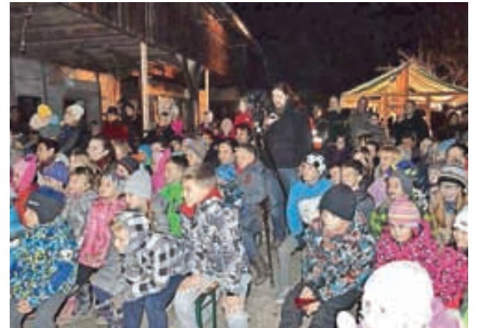
Miklavž je na Brezjah letos k sebi poklical kar petinosemdeset otrok.