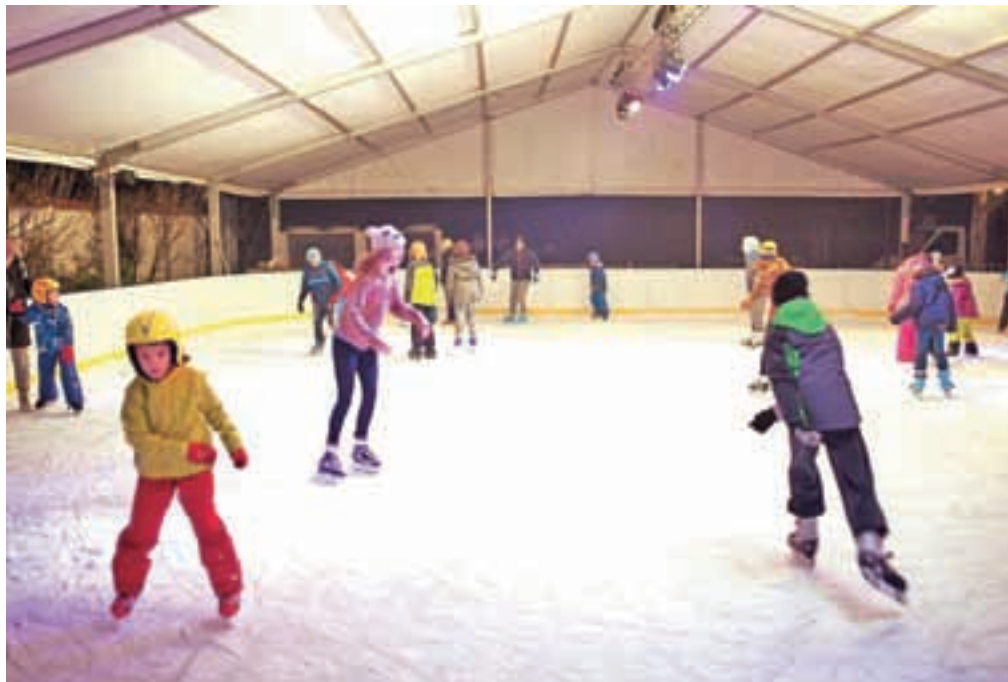
Odprtja dršališča so se tudi letos najbolj razveselili najmlajši.